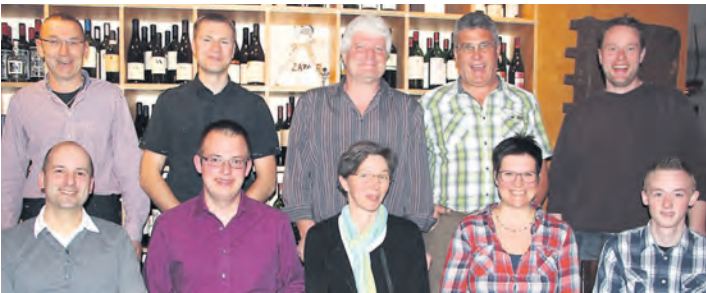
Die Kandidaten der Freien Wähler für Bohlingen.