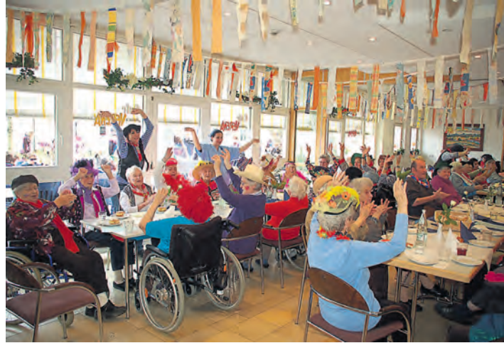
Launige Fastnachtsstimmung am Schmutzigen Dunschdig im Pflegezentrum St. Verena.

sprechend, wurden Pizza und französische Baguette serviert. Wir freuen uns alle schon auf das nächste Jahr wenn es wieder heißt »Hoorig, hoorig«.