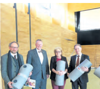
Als Dank für die »Alucobond«-Fassade der Stadthalle Engen gab es »AIREX«-Matten.