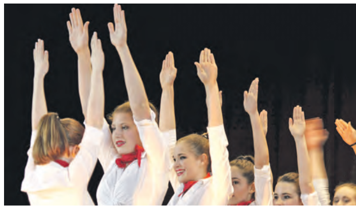
Die Tanzgruppe »Fortitude« der Schule Diessenhofen führte die Zuschauer auf einen Flug nach Südamerika beim Showtanzturnier in Randegg.

Randegg (ri). Vor vollen Rängen zeigten zahlreiche Tanzgruppen in Randegg bei einem Showtanzturnier ihr Können. Schon am Nachmittag traten 18 Kinder-Tanzgruppen auf. Als Eröffnung heizten die Tanzgruppen aus Randegg den Zuschauern mit einem Flash-Mob ein. Die Kinder auf der Bühne machten einfache Bewegungen vor, und die Zuschauer machten sie nach. Schon bald herrschte im Saal eine fantastische Stimmung. Die meisten Teams zeigten rhythmusbetonte, jazzige Tänze. Es gab »Flea Steps«, »Just4Fun« »Funny Kids« und »Freaky Girls«. Am Abend gehörte die Grenzlandhalle den Erwachsenen. In zehn Auftritten maßen sich Tanzteams aus dem Hegau, dem Bodenseegebiet und aus der Schweiz. Leiterinnen der Tanzgruppen bewerteten die Darbie-