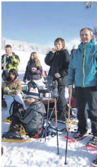
Viel Spaß hatten die Kinder bei der Schneeschuhtour des Alpenvereins im Schwarzwald.