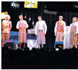
Die »Dramatischen Vier« in Aktion.