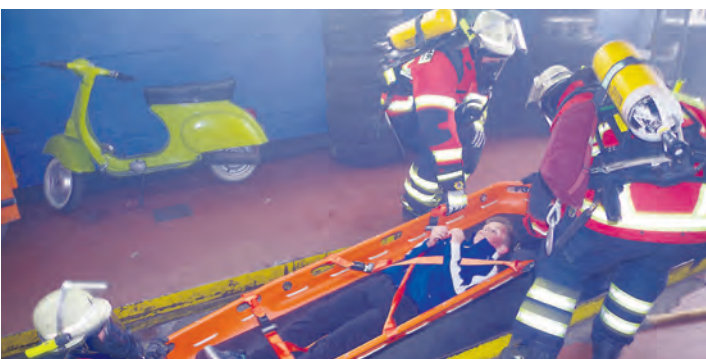
Ein »Verletzter« musste bei der Rielasinger Hauptprobe aus dem Montagegraben gerettet werden.