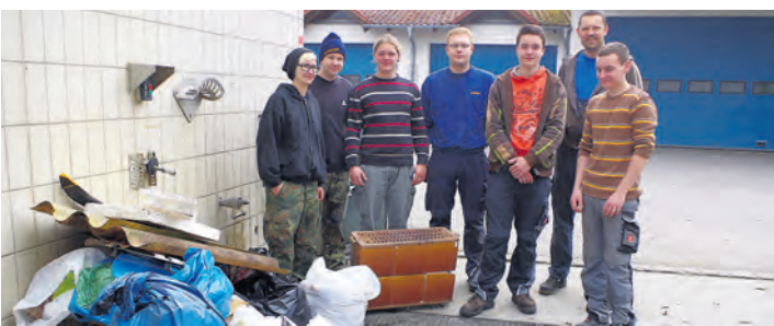
Fleißig haben Helfer des Volkertshäuser Jugendtreff am Samstag wieder die Gemarkung der Gemeinde von Müll befreit den andere in der Landschaft hinterlassen haben.