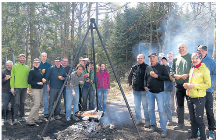
Nach getaner Arbeit gab es noch einen Grillplausch für die Helfer von ProRiwo auf dem Herrentisch.

Rielasingen-Worblingen (of). Der Finanzausschuss und der Gemeinderat von Rielasingen-Worblingen haben nach längerer Diskussion der Erhöhung der Gebühren des Naturbades Aachtal um rund 5 Prozent zugestimmt. Damit soll den allgemein steigenden Kosten Rechnung getragen werden. Auch die Preise für die Zwei-Bäder-Karte, mit der man auch das Aachbad in Singen besuchen kann wird nach diesem Muster erhöht, aber nicht den in Singen im Aachbad erhobenen Gebühren gleichgesetzt. Die 2-Bäder-Saisonkarte wurde in der letzten Saison im Naturbad 107 Mal verkauft. Es kamen 615 Besucher mit der Singener Saisonkarte ins Naturbad, umgekehrt wurde das Singener Aachbad 489 Mal mit Singener 2-Bäder-Karte betreten, berichtete Kämmerin Verena Manuth in der Sitzung des Ausschusses. Sie hat auch mal errechnet, was eine Eintrittskarte kosten würde, wenn nicht die Gemeinde massiv mit Subventionen das Bad unterstützte: 28,50 Euro!