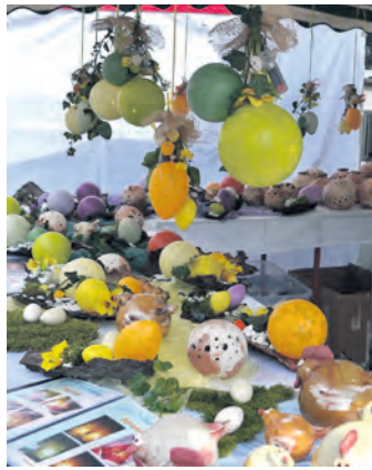
Osterdekoration in allen Varianten gab es zu bewundern.