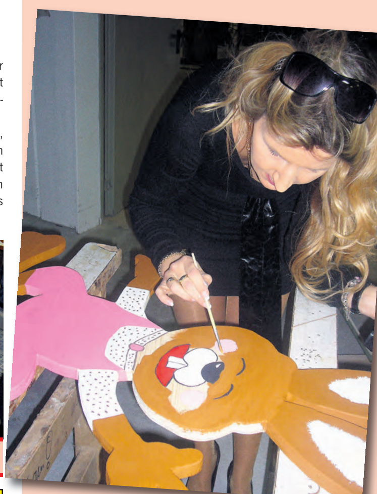
Jedes Geschäft hat seinen Hasen liebevoll gestaltet.