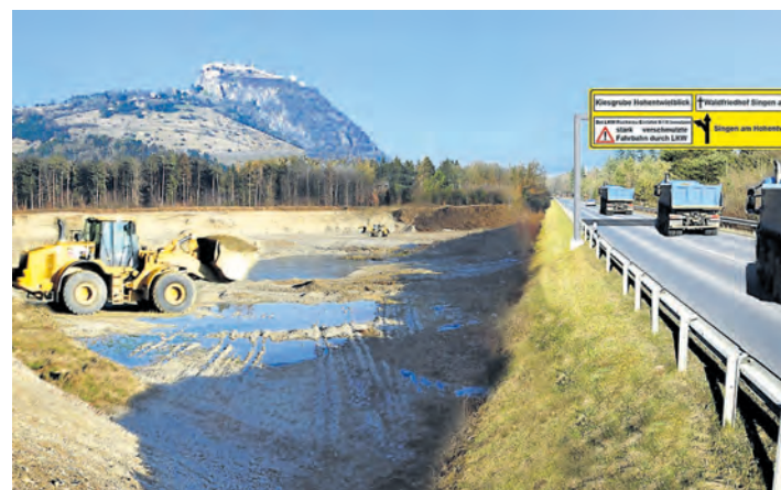
Diese Fotomontage zeigt, wie das Gelände an der B34 zwischen Gottmadingen und Singen vor dem Singener Waldfriedhof bei einem Kiesabbau aussehen könnte.