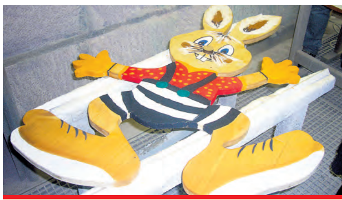
Dieser Mümmelmann wartet auf seinen Einsatz in Gottmadingen.

Gewerbevereins im Strauß seiner Aktivitäten zu Ostern ist der seit Jahren beliebte Gottmadinger Geschenkgutschein. Eine pfiffige und praktische Idee, mit der ein sinnvolles Geschenk in den Osterkorb der Lieben gepackt werden kann. Geparkt werden kann im Zentrum Gottmadingens übrigens kostenlos.