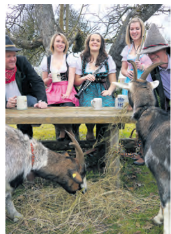
Die Musiker aus Überlingen haben schon ihre Lust am Bockbier entdeckt.

sorgen und für beste Unterhaltungsmusik bis spät in die Nacht garantieren. Gäste, die in Tracht (Dirndl oder Lederhose) erscheinen, bekommen einen Getränkutschein. Für die weitere musikalische Umrahmung hat sich unter anderem die Clownkapelle Schneckenburg angekündigt. Am Sonntagmorgen ab 11 Uhr beginnt der Weißwurst-Frühschoppen. Die beiden Musikvereine Kirchzarten und Hilzingen werden hier bei bierseliger Gemütlichkeit für zünftige Musik vom Feinsten bis in den frühen Abend sorgen.