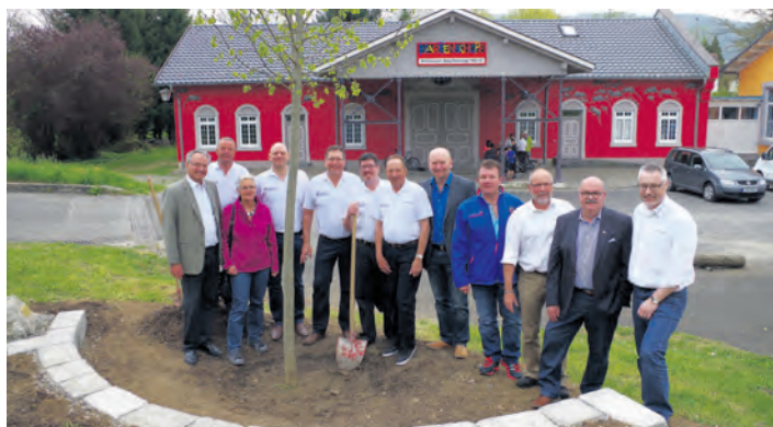
Vorstandsmitglieder der Narrenzunft Burg Rosenegg und Mitglieder der »Zunft zu Wartenfels« aus Lostorf/AG beim Pflanzen der Kaiserlinde vor dem Rielasinger Narrenschoopf.