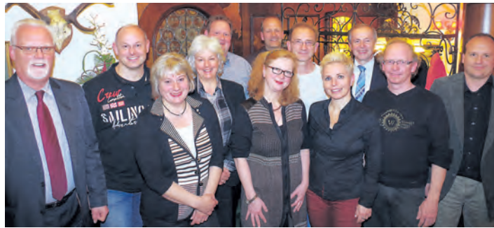
Der Vorstand des Handels- und Gewerbevereins Rielasingen geht mit Tatendrang ins neue Geschäftsjahr, bei dem das 4. Industriefenster in der Hardberghalle Zeichen setzen soll. sub-Bild: of

unmittelbaren Umgebung ab, so bleiben ziemlich genau die 30 angehenden Erstklässler aus Radolfzell übrig, die man abweisen müsste. So eine Entscheidung gefiel weder der Steißlinger Schulleitung, noch der Verwaltung in Steißlingen und in Radolfzell. Also setzte man sich zusammen und fand schließlich eine Lösung. In Böhringen könnte, befristet, unter der schulischen Leitung der Steißlinger Schule und mit Lehrkräften aus Steißlingen eine Nebenstelle der Steißlinger Gemeinschaftsschule eingerichtet werden. Gegen diese Lösung des »gesunden Menschenverstandes« wehrt sich aber das Kultusministerium zur Zeit noch standhaft mit der Begründung, dass es keine vertikale Teilung innerhalb einer Schule geben dürfe und dass man vermeiden möchte, dass ein Präzedenzfall geschaffen werde. Eltern, Lehrkräfte und die lokale Politik hoffen, dass sich im Ministerium die »höhere« Einsicht durchsetzt, dass man sowas nicht auf dem Rücken der Kinder durchsetzen sollte.