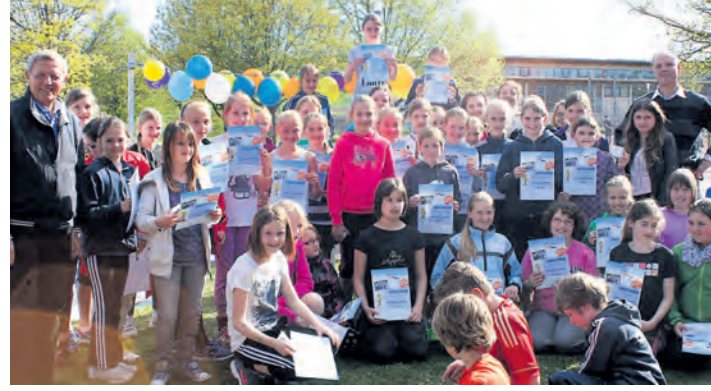
Viele Gewinner gab es bei der Talentiade in Engen.