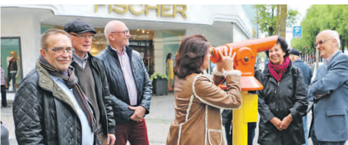
Am Freitag konnte nach längerer Pause wieder das Fernrohr in Richtung »Julius« auf dem Maggi-Wasserturm in der Scheffelstraße in Betrieb genommen werden.