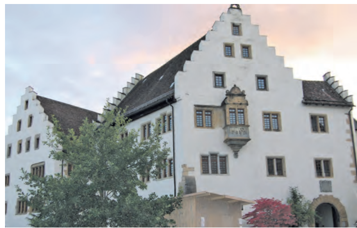
Sorgenkind in Tengen: Die Pflegeheime Schloss Blumenfeld. Was soll mit ihnen geschehen?

versorgung mit Ärzten, Apotheke, Sparkasse und Lebensmitteläden usw. ist uns sehr wichtig. Darüber hinaus freuen wir uns, dass es uns in den vergangenen Jahren gelungen ist, große Baugebiete zu erschließen, die es jungen Familien ermöglicht, kostengünstig den Traum vom Eigenheim zu verwirklichen. Zudem wollen wir die Vereine in allen Belangen unterstützen.