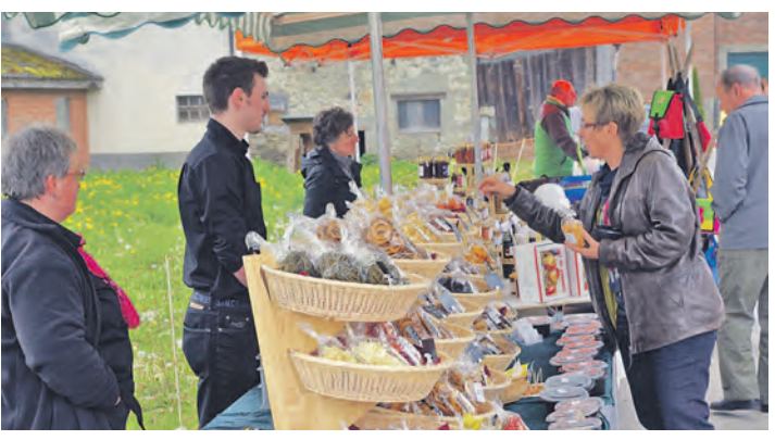
Sehr guten Anklang fand das diesjährige Spargelfest auf dem Hof Sätteli bei Ramsen. Viele Aktionen begleiteten den Anlass.