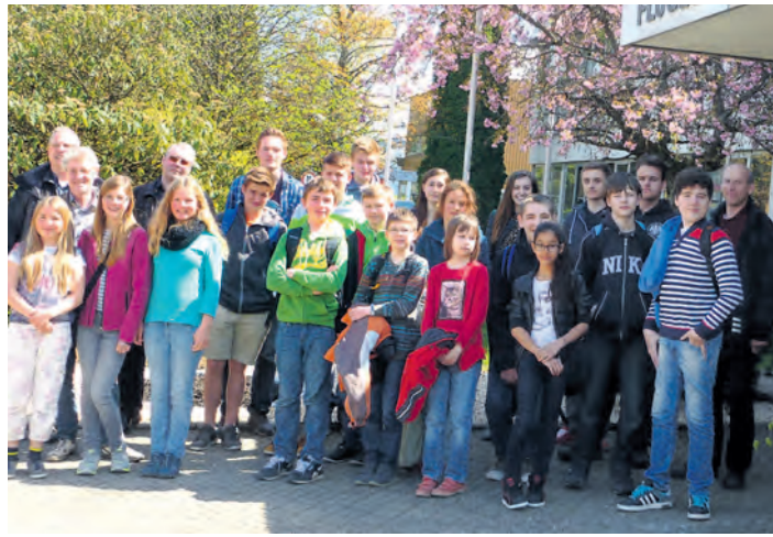
Die Klavierschüler der Jugendmusikschule Westlicher Hegau verbrachten einen anregenden und lehrreichen Tag in Spaichingen.

zeigt, sodass das Interesse auch nach zwei Stunden Besichtigung nicht erlahmte. Anschließend durften die jungen Pianistinnen und Pianisten ihr Können am Instrument zeigen. Nach dem anspruchsvollen Vorspiel auf einem tollen Flügel ging es bereits wieder auf die Heimfahrt. Für alle Teilnehmer war es ein interessantes, gelungenes Ferienprogramm.