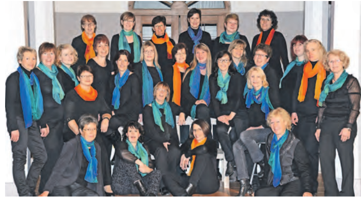
Das Publikum kann sich auf einen charmanten Abend mit dem Frauenchor »Impuls« freuen.

wegende Programm mitgestalten. Karten gibt es bei TraumDeko 07774/9252810 sowie an der Abendkasse.