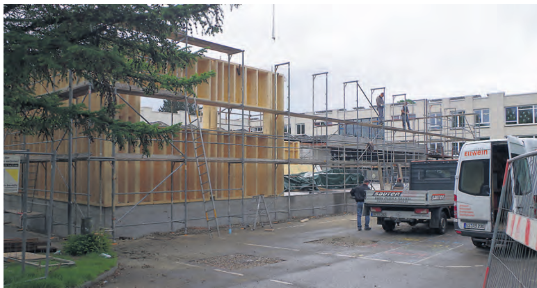
Der Bau der Mensa an der Beethovensschule schreitet voran, über die Gestalt der Gemeinschaftsschule wird erst jetzt nach der Anmeldung der Schüler entschieden.

Deshalb werde es wohl räumlich temporäre Engpässe geben, die man nur über die befristete Nutzung von Containern für Klassenzimmer überbrücken könne. Die Zahl von 65 ist noch nicht ganz in Stein gegossen, da durch die Überbuchung der Gemeinschaftsschule in Steißlingen und nach der Ablehnung einer Übergangslösung in der ehemaligen Böh-