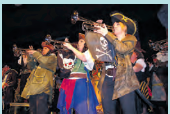
Nicht nur an Fastnacht (im Bild) lässt es der Fanfarenzug Rielasingen-Arlen so richtig krachen. Das kommende Festwochenende steht ganz im Zeichen badischer Gemütlichkeit.

schen Gelassenheit und Gastfreundschaft und zünftiger Feste ist der »symBadische Hockete« die richtige Adresse am Pfingstwochenende.