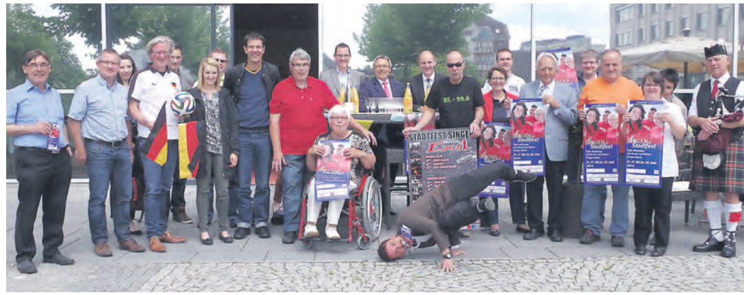
Bereits am gestrigen Dienstag wurde durch die Gemeinschaft der Organisatoren unter dem Dach des Stadtmarketing »Singen aktiv« das Programm für das Stadtfest 2014 vorgestellt, das vom 27. bis 29. Juni steigt.

Schon in diesen Tagen beginnt das Jugendreferat und die Kriminalprävention mit Alkohol-Testkäufen, um für den Jugendschutz zu sensibilisieren.