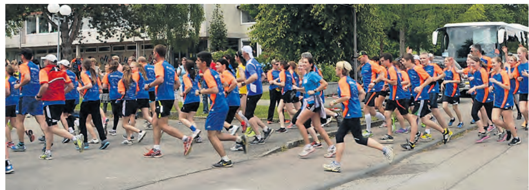
418 Läufer nahmen insgesamt am HegauBergeAbenteuer der Volksbank teil und begaben sich von Singen quer durch den Hegau nach Welschingen.