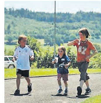
Auch die Kleinen können beim Sponsorenlauf in Hilzingen teilnehmen.

Hegau (mm). Am Samstag, 28. Juni, von 12 bis 17 Uhr, veranstaltet der Förderverein der Christlichen Schule im Hegau wieder einen Sponsorenlauf in der Sportanlage des FC Hilzingen.