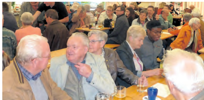
Der vom MV Bietingen erstmals veranstaltete Seniorennachmittag kam sichtlich bei den Senioren gut an, sodass manche sogar noch bis zum Abendprogramm blieben.