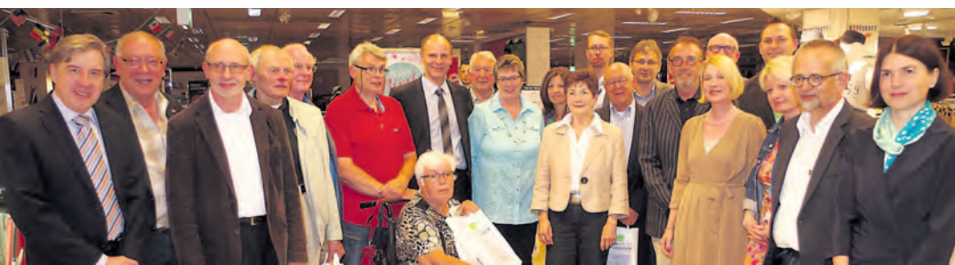
Eine ganze Schar an Autoren hat ein ereignisreiches Jahrbuch 2013 zusammengestellt, das am letzten Mittwoch im Warenhaus Karstadt zu dessen 40. Geburtstag vorgestellt werden konnte.