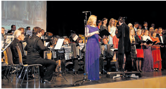
Mit einem fulminanten Festabend wurde der 10. Geburtstag der Partnerschaft mit Ardea in der Talwiesenhalle nachgefeiert.