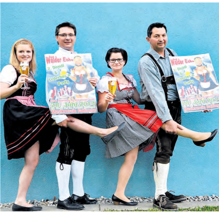
Zünftige Stimmung herrscht bei der 2. Dirndl- und Lederhos'nparty in Gailingen am 28. Juni mit der Partyband Wälder Echo aus Österreich.