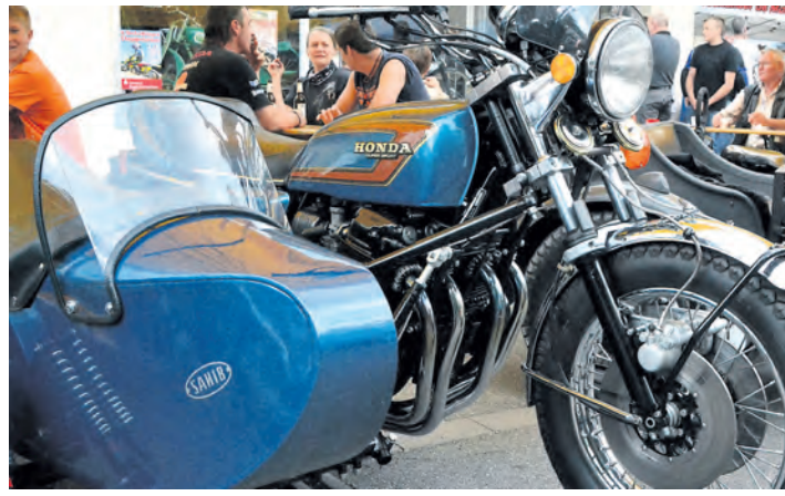
Viele Motorradfans kamen von nah und fern mit ihren Schmuckstücken nach Engen zum 1. Classic-Oldtimer-Motorradtreffen.

Aus der näheren und weiteren Umgebung kamen die Motorradfreunde auf zwei Rädern oder mit ihren Gespannen: von kleinen 98-Kubik-Zweitaktern aus Neckarsulm über elegante italienische Modelle bis hin zu wuchtigen Boxer-Maschinen bayrischer Herkunft oder schweren »Californias« war alles dabei, was das Liebhaber-