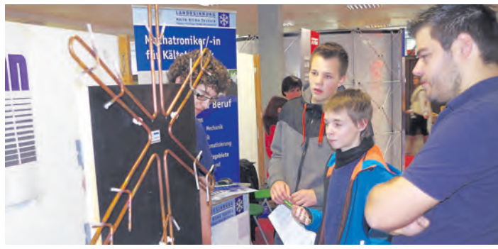
Wie weit die Rielasinger Ten-Brink-Schule schon auf dem Weg zur Gemeinschaftsschule ist, führte sie bei der Lehrstellenbörse (im Bild) wie zu den Tagen der offenen Türe in den letzten Monaten vor.

Rielasingen-Worblingen (of). Der Gemeinderat von Rielasingen-Worblingen hat in dritter Lesung am vergangenen Mittwoch mit 13 gegen 4 Stimmen für die Beantragung einer Gemeinschaftsschule ab dem Schuljahr 2015/16 gestimmt. In den letzten Wochen hatte die CDU eine Informationsveranstaltung durchgeführt. Zudem hatte die Gemeinde eine Woche vor der Sitzung eine umfassende Informationsveranstaltung in der Talwiesenhalle mit Vertretern des Regierungspräsidiums und des Schulamts sowie Vertretern der Schule angeboten, bei der Pro und Contra ausgetauscht werden konnten. Bürgermeister Baumert bedauerte nochmals die Eile, die für diese Entscheidung nötig war. Es habe zum einen, den Beschluss der Schulkonferenz für die Gemeinschaftsschule gegeben, zum anderen sei die Frist zur Beantragung von Oktober auf Juni vorgezogen worden. Baumert warb für die Gemeinschaftsschule, denn die Initiative sei von den Bildungsexper-