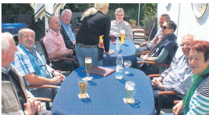
Bei einer fröhlichen Einkehr schmiedeten die Mitglieder der Worblinger Mundartbühne schon Pläne für ihre Aufführung im Oktober.