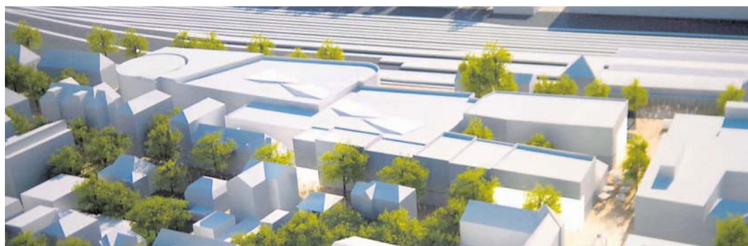
So stellt sich das Unternehmen ECE ein Shopping-Center in Singens Mitte vor.

Singen (of). Bei den Singener Händlern wird derzeit intensiv gebrütet. Beide am Ort vertretenen Handelsorganisationen, der dem Standortmarketing »Singen aktiv« angeschlossene City Ring wie auch der Handelsverband Ortsgruppe Singen mit seinen rund 50 Mitgliedern, haben in diesen Tagen Fragebögen versandt, um ein möglichst vielfältiges Meinungsbild zu den Plänen des Unternehmens ECE für die Einrichtung eines Shopping-Centers zu erhalten. Bis zum 27. Juni haben die Verbände sowie andere Institutionen, wie etwa die Industrie und Handelskammer, noch Zeit, ihre Stellungnahme zu einer Auswirkungsanalyse der BBE-Handelsberatung abzugeben. Das ist inzwischen das dritte Gutachten für die geplante Investition von ECE an der Singener Bahnhofstraße, das allerdings genau hinterfragt, wie welche Branchen in der Singener Innenstadt von den 16.000 Quadratmeter Verkaufsfläche betroffen oder sogar gefährdet sein können.