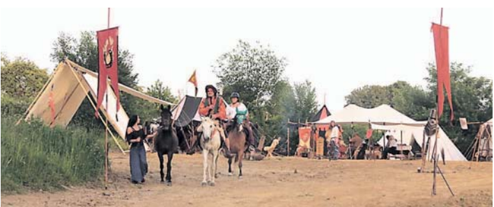
Kreuzrittergefühle kamen beim Saisonstart von »Flammensprung« auf.