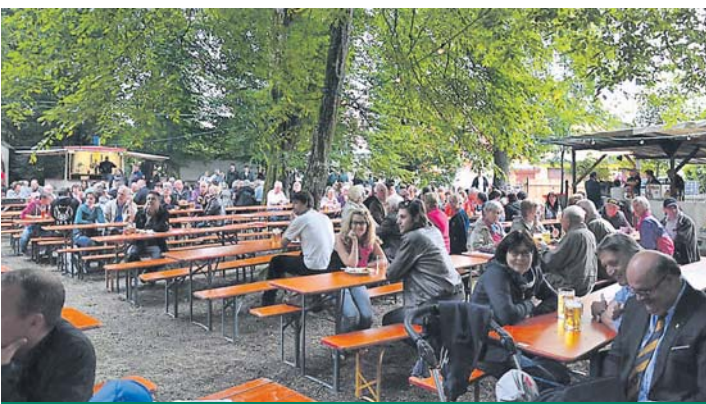
Einmalig ist das Ambiente auf dem Natur-Festplatz im Rielasinger Schnaidholz. Auch in diesem Jahr lädt der Musikverein Rielasingen-Arlen vom kommenden Freitag bis Montag zu seinem Waldfest mit einem attraktiven Programm ein.