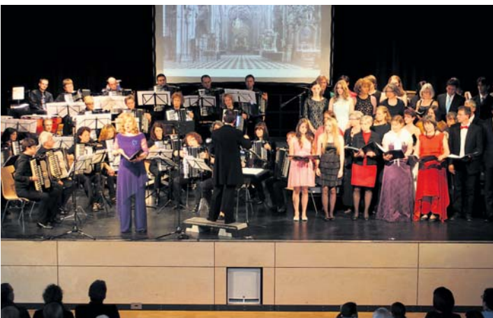
Einen riesigen Konzertabend legte das Akkordeonorchester mit seinem »Wien bleibt Wien« in der Talwiesen-Festhalle hin.