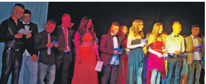
Mit einem gemeinsamen Song von der Fußball-WM feierten die Abschlussklassen der Schillerschule in Singen ihren Abschied von dieser Schule. Die meisten von ihnen werden weiter die Schulbank drücken.

Bilder von der Abschlussfeier gibt es unter bilder.wochenblatt.net .