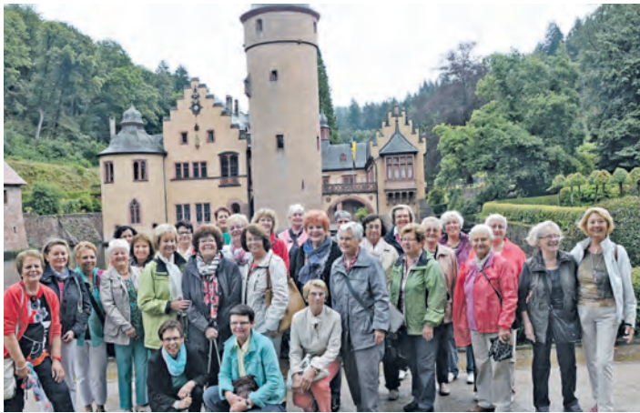
Einen Ausflug in die Zeit der Räuber und Quacksalber machten die Frauen der Katholischen FG Worblingen.