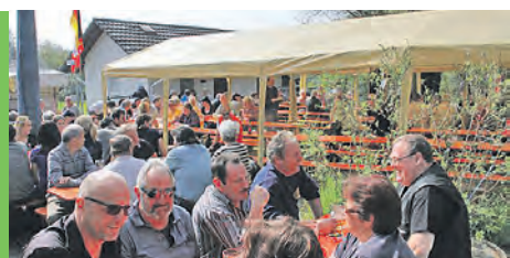
Mi., 23. Juli 2014