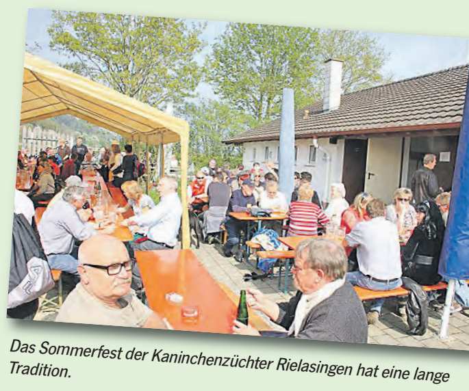
Das Sommerfest der Kaninchenzüchter Rielasingen hat eine lange Tradition.