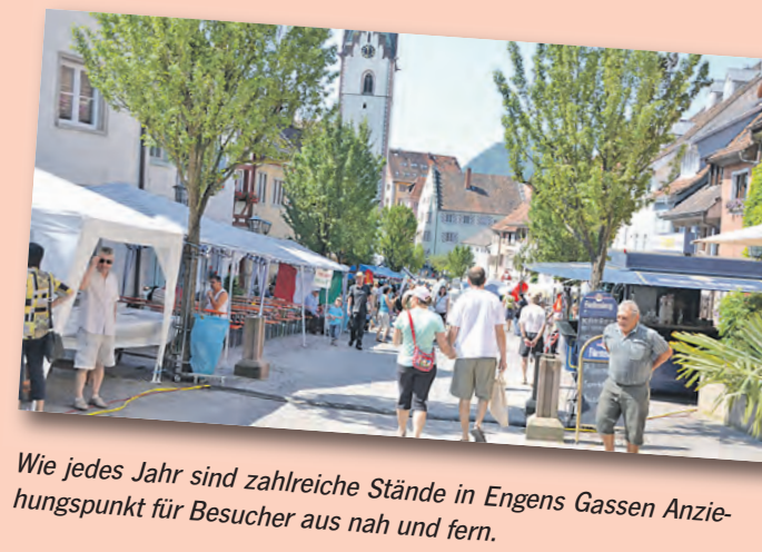
Wie jedes Jahr sind zahlreiche Stände in Engens Gassen Anziehungspunkt für Besucher aus nah und fern.