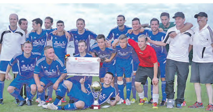
Im vergangenen Jahr sicherte sich der FC Rielasingen-Arlen im Endspiel gegen den FC Öhningen-Gaienhofen den begehrten Pokal des Emil Homburger Turniers, das traditionell vom FC Hilzingen ausgetragen wird.

gust um den begehrten Cup, den sich 2013 der FC Rielasingen-Arlen im Finale gegen den FC Öhningen-Gaienhofen sicherte. Für dieses Jahr ist den Veranstaltern wieder ein spannender Mix in zwei ausgeglichenen Gruppen gelungen: Mit dem frischgebackenen Verbandsliga Aufsteiger FC Rielasingen-Arlen, den beiden Landesligisten Hegauer FV, VfR Stockach und FC Hilzingen sowie den Bezirksligisten SV Worblingen, SV Aach-Eigeltingen, FC Öhningen-Gaienhofen und dem FC Böhningen. Die Spielzeiten sind vom 24. Juli bis zum 4. August jeweils um 17.30 sowie um 19.05 Uhr. Das Finalspiel um den dritten Platz beginnt am 4. August um 17.30 Uhr, ehe es um 19.05 Uhr im Finale um den diesjährigen Pokal beim Emil Homburger Turnier geht. Mehr Informationen und einen kompletten Spielplan gibt es im Internet unter www.fchilzingen.de.