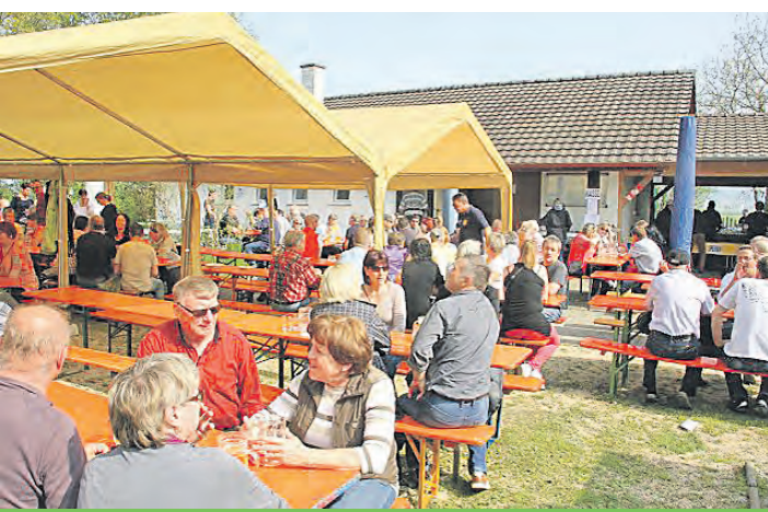
Bei schönem Wetter wird das Sommerfest des Kaninchenzuchtvereins beim »Hasenheim« Rielasingen natürlich unter freiem Himmel gefeiert.