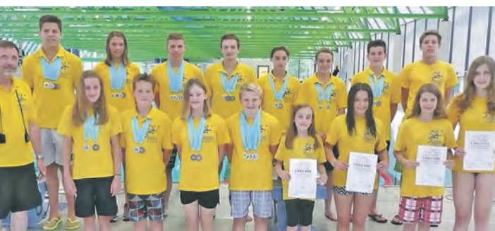
Die Schwimm-Sport-Freunde (SSF) Singen erschwammen bei den Badischen Meisterschaften 10 Titel und 36 Medaillen.