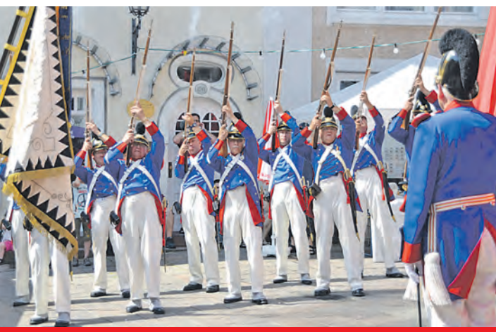
Mit den Salutschüssen der Bürgerwehr ab 11 Uhr auf dem Marktplatz beginnt der offizielle Startschuss für das 35. Engener Altstadtfest.

den Altstadtgassen die kleinen Besucher. Weitere Highlights im vielfältigen Programm des 35. Altstadtfestes, das sich auf Plätzen und in den Gassen verteilt, sind sicherlich die »Feuerkünstler Funkenflug«, das Bodensee-Alphorntrio und die Guggenmusik der »Engemer Schätterä Dätscher«. Andere Töne werden auf dem Schulplatz erklingen, wenn dort von 14.30 bis 22 Uhr Bands aus der Region wie Silent Chesnut, die Tanzgruppe der Kinderwohnung Kunterbunt sowie deutschsprachiger HipHop mit alesko & assa + feature aus Engen rocken. Der Kinderflohmarkt und der große Trödel- und Flohmarkt starten bereits um 8 Uhr. Am Festtag ist die Altstadt für den Verkehr gesperrt. Im Umkreis stehen Besuchern Parkplätze zur Verfügung.