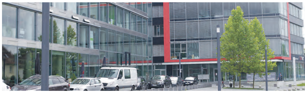
Die GVV wird geschrumpft zur Hausverwaltung. Auszug aus dem Hegau-Tower ist schon am Freitag.

Andererseits muss die GVV in den nächsten Monaten eine gewaltige Schrumpfkur auf ein Wohnungsverwaltungsunternehmen für dann noch 470 Wohnungen und rund 90 Gewerbeimmobilien durchmachen. »Wir haben da auch keine Zeit mehr, denn die Kreditgeber erwarten natürlich ein Signal, das jetzt gegeben werden muss«, sagte OB Bernd Häusler in der Sitzung am Dienstag.