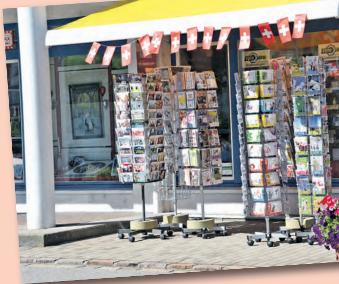
Die Gottmadinger Geschäfte heißen ihre Gäste mit passender Dekoration willkommen.