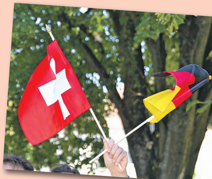
Besonders am Schweizer Nationalfeiertag am 1. August ist Gottmadingen beliebtes Ziel für Schweizer Kunden.

Weitere Informationen rund um den Gottmadinger Geschenkgutschein gibt es unter www.gewerbeverein-gottmadingen.de