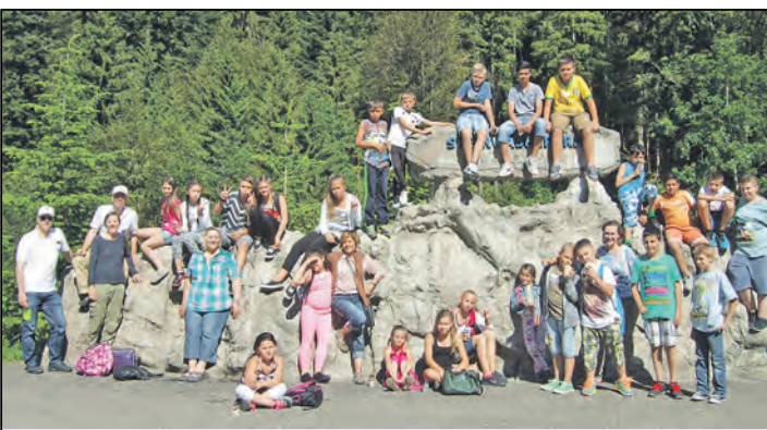
Viel Spaß bei traumhaftem Wetter hatten 24 Kinder aus dem Kinderhaus Langenrain, einer Einrichtung des Deutschen Kinderschutzbundes Singen-Hegau e.V., bei ihrem Ausflug in den Steinwasenpark. Der Ausflug wurde finanziert und begleitet vom Kiwanis Club Hegau und hat schon eine lange Tradition. Alle Betreuerinnen und Kinder sagen ein herzliches Dankeschön an den Kiwanis Club Hegau.