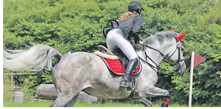
Der neue Dressurplatz in Bohlingen erlebte zum Turnier am Sonntag seine Feuertaufe, und bestand sie lässig.