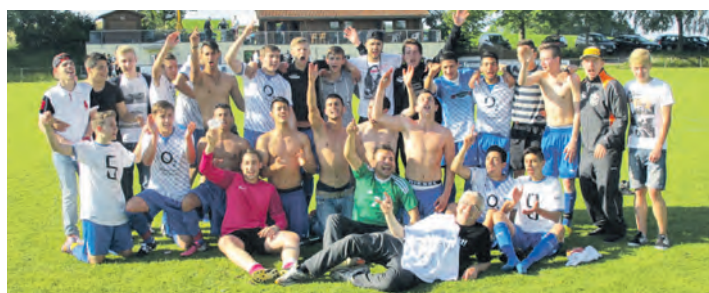
Ein stürmische Meisterfeier beging die A-Jugend der SG DJK/Margicos nach dem Aufstieg in die Landesliga.