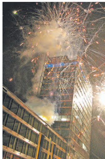
Selbst das Vorzeigeprojekt Hega-Tower wurde in der nachträglichen Analyse von OB Bernd Häusler als Desaster gesehen. Das Foto entstand bei der Einweihung im Jahr 2008.

»Ohne den im Jahr 2013 durch den damaligen OB gewährten Kassenkredit wäre die Insolvenz der GVV wahrscheinlich schon 2013 angestanden«, blickte OB Häusler in einer sehr emotionalen Ansprache auf den immer tieferen Blick in die »Black Box GVV« zurück. Es sei viel verschleiert worden, um das tatsächliche Desaster der finanziellen Situation der GVV zu verbergen, analysierte Häusler. Ein Desaster und eine wirtschaftliche Katastrophe in sich sei dabei schon alleine der Hega-Tower gewesen, der für sich ein jährliches Defizit von 800.000 bis einer Million Euro jährlich verursacht habe, obwohl dieser vom damaligen Aufsichtsratsvorsitzenden und dem damaligen Geschäftsführer immer als erfolgreich präsentiert worden sei. Dieses Defizit, so ergänzte dann allerdings Frank Bonath, sei vorerst ausgeräumt: Man habe ein halbes Stockwerk inzwischen zusätzlich verkauft, wieder einen Pächter für Hotel und Gastro-