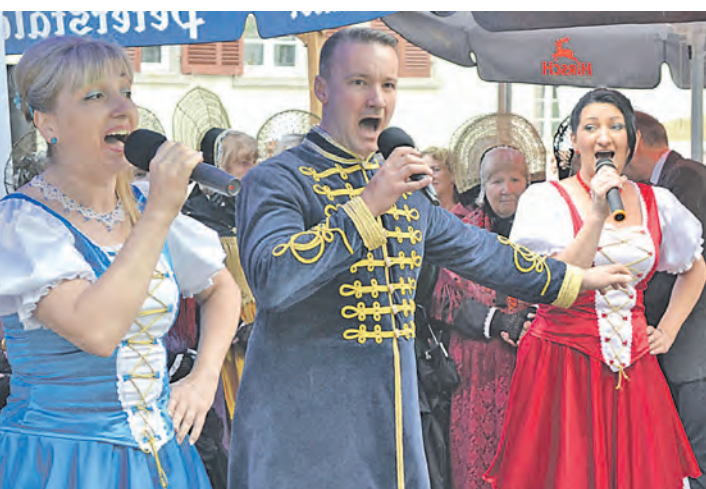
Ungarisches Feuer lodert trotz Regen: »Baráti-Dal-Szinház« auf dem Engener Altstadtfest.