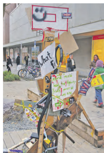
Geteilte Meinungen über die Hegastraße gab es schon immer. Die erste provisorische Umgestaltung wurde damals mit Müll-Kunst kommentiert.