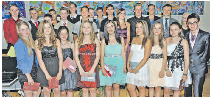
Die Preisträger des Jahrgangs 2014 der Zeppelin-Realschule stellen sich zum Abschluss ihrer Feier zum Gruppenbild auf.

am 24. Juni auch darüber beschwert, dass die Mitgesellschafter nicht über die Verkaufspläne informiert worden seien. Allerdings sei es in diesem Monat immer noch nicht möglich gewesen, Rücksprache mit einem Vertreter der auch als Gesellschafter vertretenen Metzger zu halten. Nun wurde der Beschluss gefasst, dass die GVV Singen zu einer Gesellschafterversammlung einladen soll, um ihre Anteile an der Kommanditgesellschaft von 77.500 Euro und dem Eigenkapital von 57.500 Euro allen Mitgesellschaftern anzubieten.