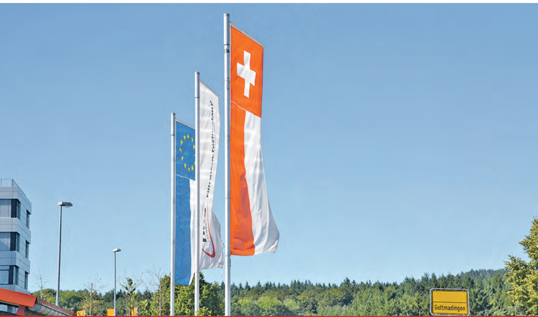
Gottmadingen lädt am 1. und 2. August zu seinem Schaufenster ein.

Ein weiteres Pfund für das Gewerbe in Gottmadingen ist der Geschenkgutschein. »Das ist ein Knüller«, so Growe, denn jährlich werden über tausend der Einkaufsgutscheine umgesetzt. Am Gottmadinger Schaufenster haben die teilnehmenden Geschäfte zu ihren üblichen Zeiten geöffnet und freuen sich auf ihre Kunden.