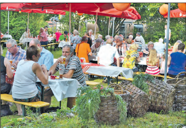
Ein lauer Sommerabend, eine stimmungsvolle Atmosphäre im Garten des Engener Krankenhauses und dazu ein feines Essen – das Sommerfest des Krankenhausfördervereines war rundum gelungen. Das Motto »Sommer auf dem Lande« hätte gar nicht passender gewählt sein können. 600 Portionen zauberte der Hobby-Kochclub auf die Tische und dies für einen guten Zweck: Damit soll der Aufenthaltsraum des Krankenhauses neu gestaltet werden.