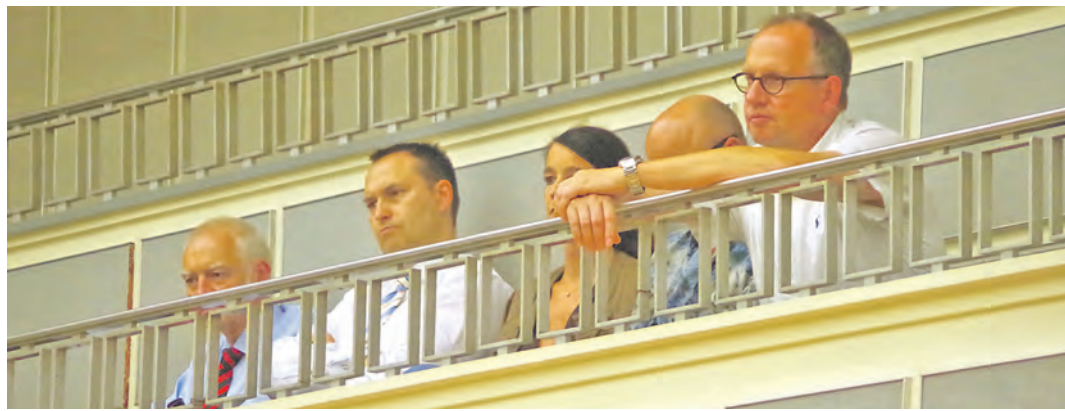
Einige Händler aus der Innenstadt verfolgten die Sitzung des Gemeinderats am Donnerstag zeitweise mit eigenen Ohren und Augen.

Singen (of). Wie der Ausschuss für Stadtplanung und Bauen hat auch der Gemeinderat in seiner letzten Sitzung der Legislaturperiode am Donnerstagabend mit zwei Gegenstimmen und zwei Enthaltungen für den Einstieg in eine Bauleitplanung gestimmt. OB Bernd Häusler informierte wie auch im Ausschuss ausdrücklich darüber, dass mit dem jetzigen Beschluss weder die Größe eines späteren Shopping-Centers, noch dessen Architektur oder auch die Frage von Stellplätzen oder Verkehrskonzept beschlossen worden sei. Es handle sich um einen vorhabenbezogenen Bebauungsplan, in dem nichts stehe, was die Stadt nicht wolle und der am Ende vom Unternehmen ECE unterschrieben werden müsse, das sich für eine ganze Reihe von Gebäuden in dem Quartier bereits Kaufoptionen gesichert hat. Zudem sei die Stadt Singen im Besitz von zwei Grundstücken in dem Gebiet. Die würden auch nur verkauft, wenn dafür eine Planung stehe, die