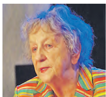
Bestseller-Autorin Ingrid Noll war für den Krimisommer gerne nach Singen in die Färberei gekommen.

Mehr Bilder gibt es in der Galerie unter bilder.wochenblatt.net