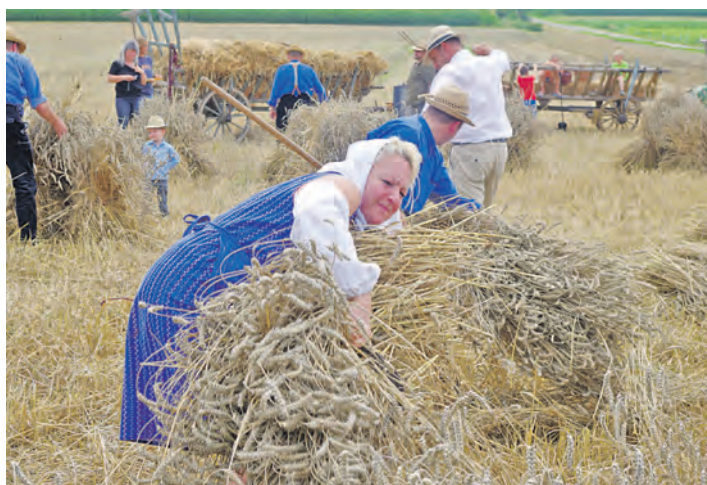
Harter Einsatz war bei den Erntehelferinnen und Schnittern und Seilelegern bei der diesjährigen Ernte für die Bohlinger Sichelhenke gefordert.