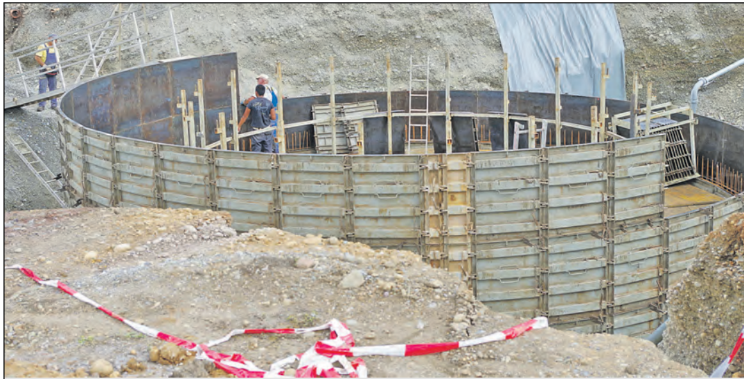
Erst Ende Oktober wird der FC Singen wieder im Hothentwielstadion aufspielen. Derzeit sind dort Baumaschinen und viele Menschen im Einsatz, um einen lang gehegten Traum von Fußballern, Trainern und Zuschauern zu erfüllen, nämlich den Spielrasen näher an die Tribüne zu bekommen. Im Rahmen des Sportentwicklungsplans wurde die Grundlage im letzten Herbst geschaffen, der Platz bekommt zur Regenwasser-Rückgewinnung sogar eine »Unterwelt« (im Bild). Ein Sportcampus auf der Ostseite des Stadions wird im kommenden Jahr fertig gestellt.

Singen (of). Eine durchweg verbesserte Bilanz der Stadtwerke Singen wurde den Mitgliedern des Betriebsausschusses am Mittwoch durch die Wirtschaftsprüfer des Unternehmens Delotte und Touche präsentiert. Unter dem Strich haben in der geprüften und bestätigten Bilanz die Stadtwerke im letzten Jahr einen Überschuss von rund einer halben Million Euro erwirtschaftet. Der Wasserbereich machte einen Gewinn von 1,42 Millionen Euro, ebenso der Bereich Energiebeteiligungen mit 200.000 Euro. Damit kann das Defizit des Stadtbusses (-907.000 Euro) wie das erfreulich geschrumpfte Minus von 199.000 Euro der beiden Parkhäuser mehr als ausgeglichen werden. Die separat geführte Abwasserentsorgung hat auch ein Plus von 889.000 Euro erwirtschaftet wie die Abfallentsorgung von 79.000 Euro. Da hier auch Rückstellungen aus Vorjahren anstehen, müssen die Stadtwerke auf das kommende Jahr die Gebühren senken, denn das Geld darf nicht in die Bilanz rückgeführt werden. OB Bernd Häusler kündigte an, dass man die Beschlüsse zur Senkung der Abwasser- und Abfallgebühren noch in diesem Jahr fällen werde.