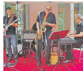
Die Rühland-Band spielte zum Auftakt des ersten Singener Musiksommers.

Singen (of). Einen guten Start hat der Singener Musiksommer am Samstag in der unteren Scheffelstraße hingelegt. Ab 11 Uhr spielte die Rühland-Band auf dem Roten-Teppich in der unteren Scheffelstraße vor den Postarkaden auf, und zeitweise scharten sich über 100 Zuhörer, die von den weithin hörbaren Klängen angelockt wurden, um die gestandene Kapelle, die mit vielen Evergreens für schöne Unterhaltung sorgte. Und weil die Sonne so schön schien, konnte man es sich im gegenüber gelegenen Café Estelle auch ganz gut gemütlich machen. Bei dem Anlass war auch der City-Ring als Veranstalter des ersten Singener Musiksom-