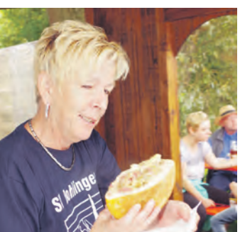
Die Bohlinger haben nicht nur ihren eigenen Wein und Most vom Feinsten. Auf dem Markt gab's viele originelle Spezialitäten vom »Galgenberg Fetzen« (im Bild) bis zum Bohlinger »Börger« im Festzelt.