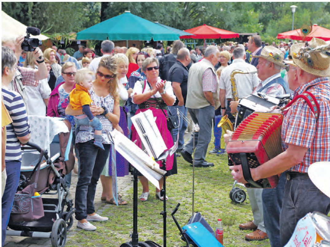
Richtig voll war die Marktgasse am Sonntagmittag. So voll, wie eigentlich noch nie. Für ein kleines Tänzchen zur Musik der Talheimer Straßenmusikanten war aber immer noch genug Platz. Auch dem benachbarten Küfer gefiel die volkstümliche Musik so gut, dass er an seinem Fass den Hammer im Takt schwang.