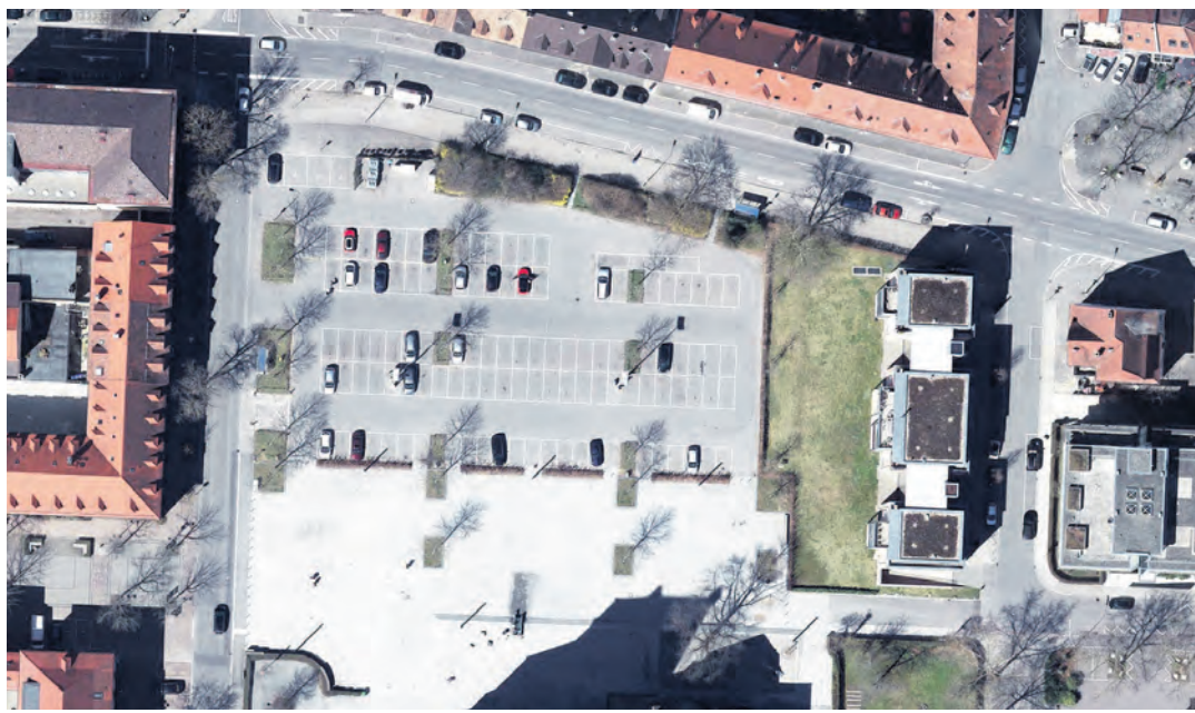
Laut der Ergebnisse der Bürgerwerkstatt könnten ein u-förmiger Neubau und ein Biergarten für eine Belebung am Herz-Jesu-Platz sorgen.

Singen (ly). Bei der Bürgerwerkstatt ging es um die künftige Gestaltung der Nordhälfte des Herz-Jesu-Platzes. Dabei waren Kreativität und Offenheit sowie Ideen gefragt, aber auch Entscheidungsfindungen. Bei den mehrmaligen Treffen der Bürgerwerkstatt zur zukünftigen Gestaltung dieses zentralen Platzes in Singen wurden die Grundlagen für die Planungsbüros erarbeitet und mit den Architekten die doch sehr vielfältigen Entwurfsskizzen diskutiert.