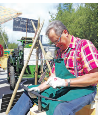
Auch dieses Jahr wurde wieder fleißig gedengelt und noch mehr darüber gefachsimpelt.