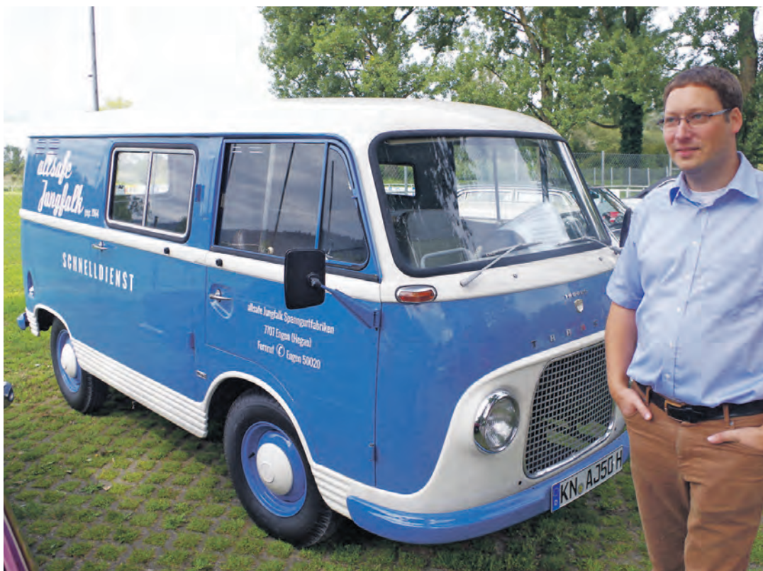
Einer der großen Stars des Oldtimertreffens war fast noch ein »Youngtimer«. Zum 50. Geburtstag von »Allsafe Jungfalk« in Engen wurde das erste Auto des Unternehmens liebevoll in einer Werkstatt in Bohlingen restauriert. Für das Unternehmen ist das jetzt der absolute Renner bei den Messeauftritten, denn der alte »Transit« zieht nicht nur an der Aach die Menschen magisch an. Insgesamt 128 Oldtimer waren am Samstag nach Bohlingen gekommen. Erstmals wurden die Autos an der Aach ausgestellt.

Mehr Bilder gibt es im Internet unter bilder.wochenblatt.net .