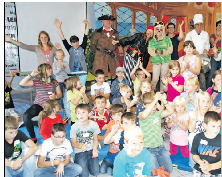
Matrosen, Kapitäne und Piraten beherbergte das zum Schiff umgebaute Gemeindehaus der Freien Evangelischen Gemeinde in Gottmadingen, wo rund 30 Kinder am Sommerferienpro- gramm unter dem Motto »Seefahrt« großen Spaß bei verschiede- nen Spielen hatten. Auch bei Musik und einer kindgerechten Andacht kam beste Seefahrerlaune auf.

nur Sprache und Literatur, son- dern auch arabische Flötenmu- sik studiert und wird zusam- men mit dem international be- kannten iranischen Percussio- nisten Hadi Alizadeh den Abend stimmungsvoll gestal- ten. Karten im Vorverkauf gibt es in der Stadtbibliothek Engen, eine telefonische Reservierung ist unter der Telefonnummer 07733/501839 möglich.