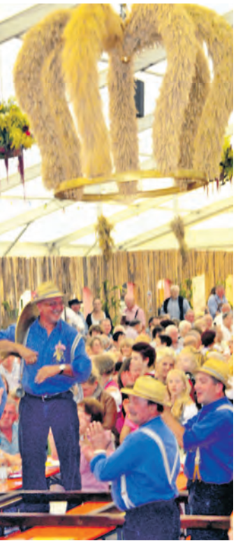
Die stärksten Bohlinger Burschen hängten die Erntekrone unter dem Giebel des Bohlinger Festzelts auf.