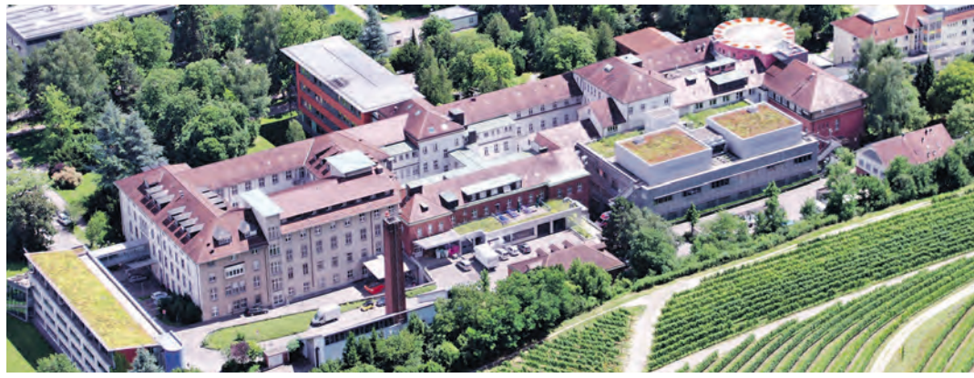
Im Singener Klinikum startet ab Oktober eine Kinder-Notfallpraxis.