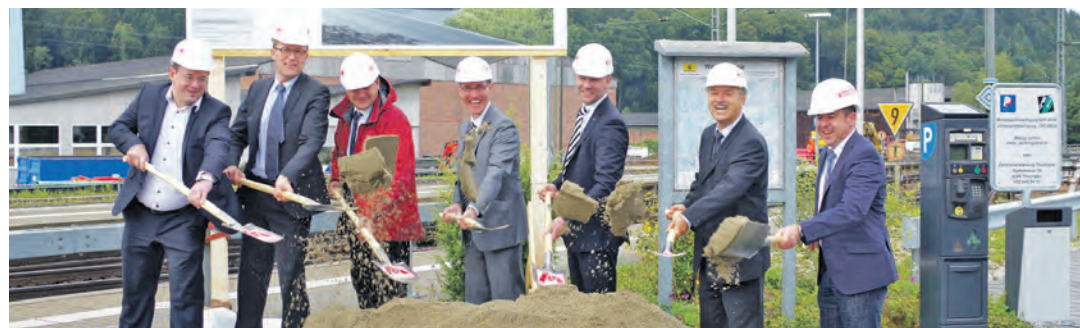
Am Dienstag wurde der Spatenstich für den Umbau des Bahnhofs Thayngen vollzogen. Bis Ende 2015 werden hier 23,5 Millionen Euro/ 29,3 Millionen Franken investiert.

das Haus am Mühlebach mit diesem Benefizkonzert unter- stützen und bittet um Spenden zugunsten der Kinder mit Be- hinderung vom Haus am Müh- lebach. Der Eintritt ist frei.