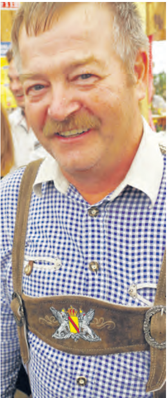
Auf gut badisch wurde diese krachlederne Tracht von seinem Besitzer patriotisch umdekoriert.