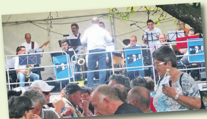
Auch in diesem Jahr werden wieder verschiedene Musikkapellen für die nötige Stimmung im Knechtgarten sorgen.