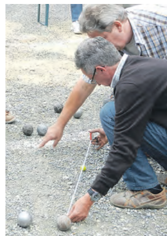
Allez-aux-boules heißt es wieder am Samstag, 13. September, wenn der Freundeskreis Nogent-sur-Seine in Rielasingen zu seinem traditionellen Bouleturnier einlädt.

wartet. So wundert es nicht, dass der Preis für den ersten Platz natürlich Champagner ist, gestiftet von den französischen Freunden. Ein Dutzend Mitglieder des Partnerschaftsfreundes-