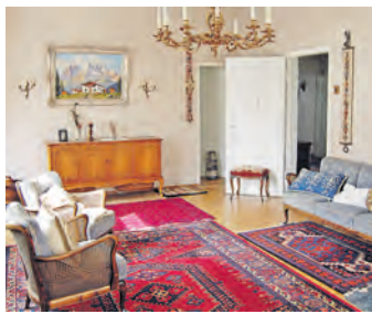
Eintauchen in ein Stück nostalgische Geschichte.

Der städtische Denkmalschützer Tilo Brügel wird anhand von Plänen, alten Ansichten und Fotos erste Eindrücke vermitteln. Nee Kiderlen von der Projektstelle Stadtgeschichte und Ralph Stephan, der Leiter des Hegau-Museums wird, werden die Gäste auf einer 50 Minuten dauernden Tour durch die Villa informieren. Aspekte der Führung sind die Entwicklung der Unternehmen in Sin-