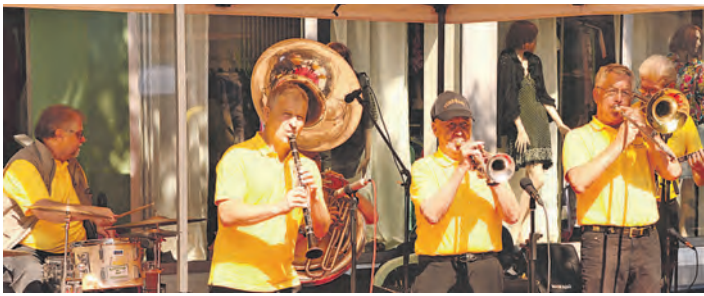
Für »Ice-cream« und mehr sorgte die »Feierware-Jazzband« beim Musiksommer.