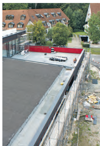
Das neue Feuerwehrgerätehaus liegt auf allen Ebenen im Soll.

der Gemeinde, das nach den Plänen des aus einem Architektenwettbewerb erfolgreich hervorgegangenen Architekturbüros Lanz und Schwager zu baue