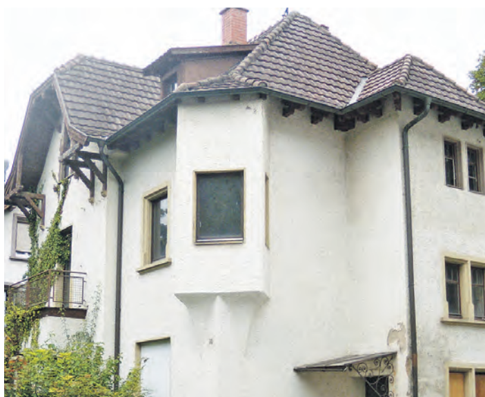
Seit vielen Jahren gibt es einen Leerstand der katholischen Kirche in der Hegastraße.

sich nicht um eine Nutzung dieses Gebäudes gekümmert oder es keiner weiteren Nutzung zugeführt hätten.