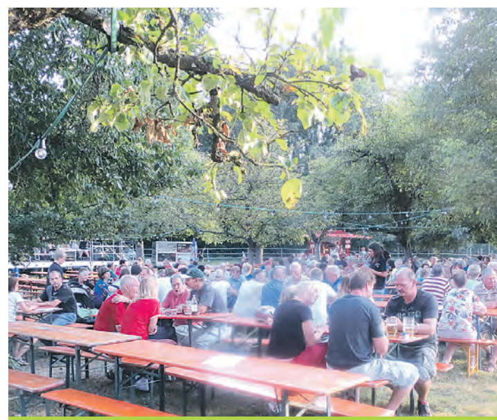
Beste Stimmung ist beim Gartenfest des Musikvereins Rielasingen-Arlen am 13. und 14. September wie in den Vorjahren garantiert.

Wie aus Vereinskreisen zu erfahren war, wird an beiden Tagen für das leibliche Wohl gesorgt. Des weiteren weisen die Verantwortlichen des Musikvereins Rielasingen-Arlen darauf hin, dass es in diesem Jahr wieder eine entsprechende Beschilderung geben wird, die die Besucher sicher zum Fest führen werden. Ein Besuch beim Gartenfest des Musikvereins Arlen lohnt sich also.