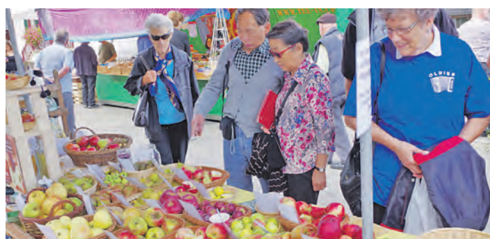
Nicht nur die »Schöne von Bibern« konnte man beim 5. Zwetschgenfest erleben. Der Verein Naturpark präsentierte dutzende historischer Obstsorten aus dem Kanton.

Bereits zum 5. Mal hat Bibern mit seinem Zwetschgenfest ganz groß auftrumpfen können. Bei fast idealen Wetterbedingungen strömten am Samstag und Sonntag tausende Besucher in den unteren Reiat, wo an die 400 Helfer und Mitmacher eine wahrhaft beeindruckende Schau rund um die »Schöne von Bibern« in der Dorfstraße geschaffen hatten. Der Verein »Naturpark Schaffhausen« präsentierte alte Obstsorten, deren Namen kaum noch jemand kennt und auch historische Getreide wie Emmer oder Dinkel, Ölfrüchte wie Leinsamen und Raps tauchen längst wieder als regionale Produkte auf. Die »Schöne von Bibern«, eine eigene Zwetschgensorte, die es nur hier im Reiat gibt, war in vielen Variationen zu erleben. Als frische Frucht vom Baum, als Kuchen, getrocknet, mit Alkohol verfeinert, als Konfitüre, als Schnaps, als Dünne, sogar als Zutat für eine spezielle Wurst, das Holz wurde zu Möbeln oder kleinen Kunstwerken verarbeitet, die Kerne konnte man gar vergoldet erstehten. Immer wieder gab es Lob dazu von den Besuchern,