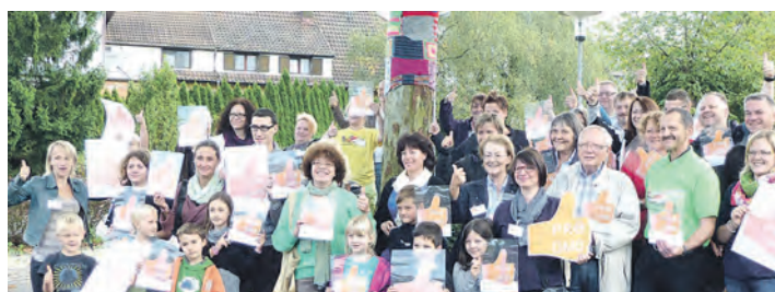
Die Elterninitiative Pro Gemeinschaftsschule hat ihre Mitmachaktion »Gemeinsam – Farbenfroh – ProGMS« gestartet.

Die Elterninitiative Pro Gemeinschaftsschule hat ihre Mitmachaktion »Gemeinsam – Farbenfroh – ProGMS« gestartet.