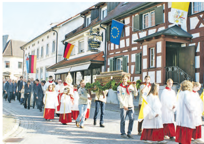
Festgottesdienst und Prozession bilden nach wie vor den Mittelpunkt der kirchlichen Feiern zum Klemenzenfest.

Dieses »schönste Dorf« feiert nun am kommenden Wochenende zu Ehren seines Ortspatrons und zur Freude seiner Bürger sein 273. Klemenzenfest. Das Fest hatte in früheren Zeiten natürlich einen etwas anderen Charakter. Zehn und mehr Musikanten brachten mit dem Sängerkorps ein »musikalisches Amt« zum Vortrag und zur »Belehrung und Erbauung« des Volkes wurde ein auswärtiger »Ehrenprediger« beigezogen, der für seine Bemühungen einen Gulden erhielt. Die anschließende