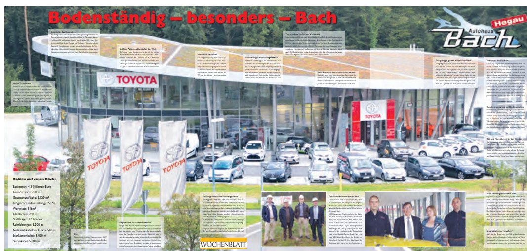
Das neue Autohaus Bach am Toyota-Kreisel. Ein erster Einblick in die umfassende Sonderbeilage, die in dieser Woche dem WOCHENBLATT beiliegt. Durch das neue Konzept enthält es alle notwendigen Informationen zu dem »nachhaltigen und architektonischen Highlight« am Tor der Singener Automeile auf einen Blick.

Ausgehend von der Toyota-Philosophie der Nachhaltigkeit ist die 77 Tonnen schwere Stahlkonstruktion mit Glasflächen von 700 Quadratmetern weit mehr als Verkaufsfläche der umweltverträglichsten Fahrzeugflotte. An einem Top-Standort in Singen ist das Autohaus viel mehr, indem es den modernsten Stand an Umweltverträglichkeit mit architektonischem Esprit vereint, gleichsam Sinnbild der Marke Bach, die zahlreiche Kunden in der