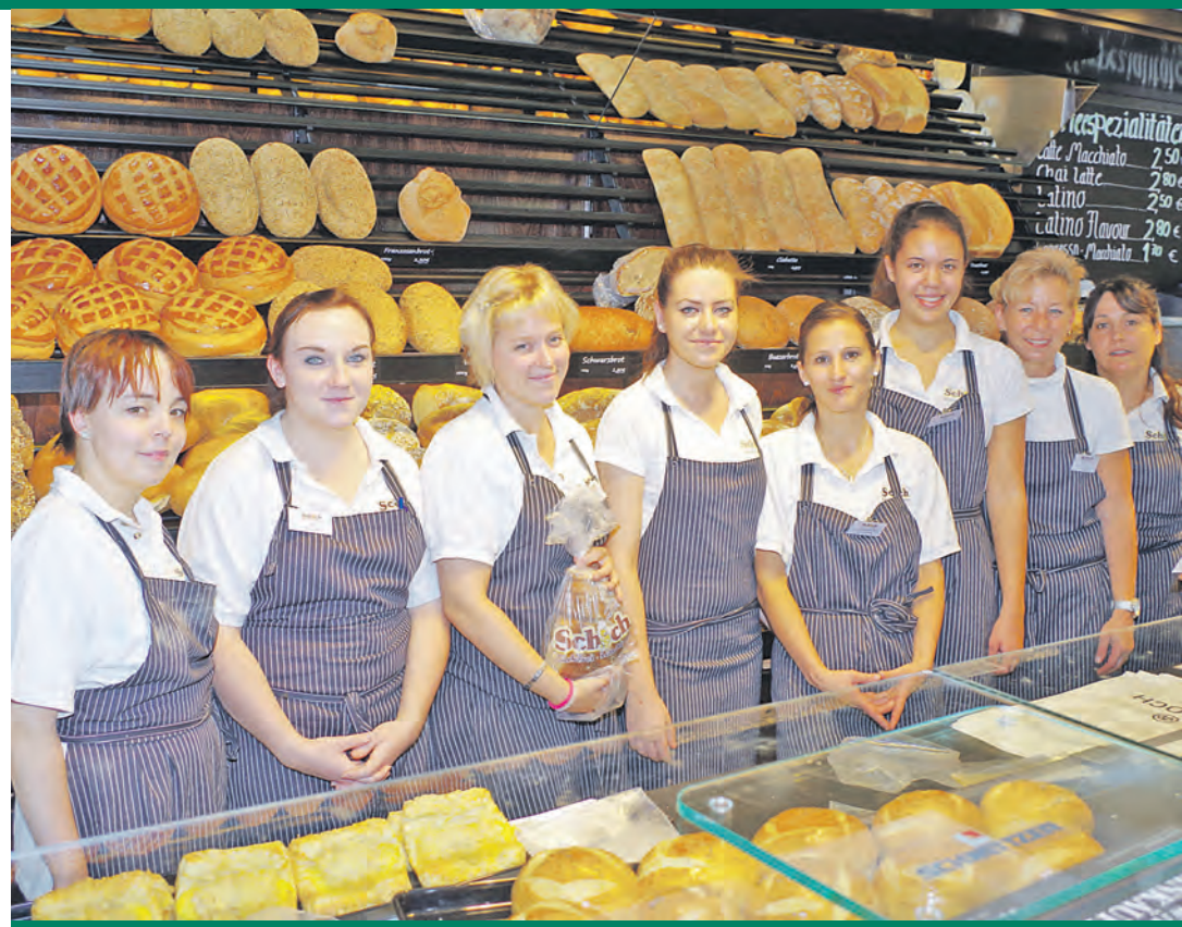
Das Team im Verkauf des Stammhauses der Bäckerei Schoch freut sich über den neuen Laden ganz besonders. In den letzten Wochen war der Verkauf in einen Container ausgezogen.