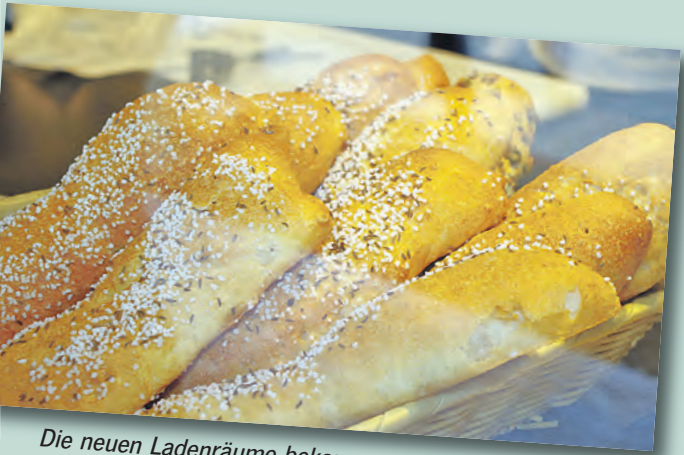
Die neuen Ladenräume bekamen zur Eröffnung viel Lob von den Kunden.

erweitert. Die Vorbereitung zur Auslieferung wie auch für das Café und Bistro haben nun den nötigen Platz und die Erschließung der Arbeitswege wurde verbessert. Optisch ist mit dem neuen Verkaufsraum und auch dem Café eine sehr schöne Lösung gefunden worden. Indischer Palisander an den Wänden, Augengnirss als Naturstein auf dem Boden und eine sehr moderne Thekenlandschaft ergeben ein sehr stimmiges Bild eines modernen Betriebs, der die Ergebnisse seiner Handwerkskunst hier im besten Licht präsentieren kann. Da lohnt sich auch der Blick an die Decke, denn die Lampen wurden eigens nur für dieses Geschäft gestaltet und machen das Gesamtbild aus Architektur und Ladenbau perfekt. Hier macht das Einkaufen nun richtig Spaß, wie viele Kunden am Samstag bestätigten. Für ihr Handwerk wie für