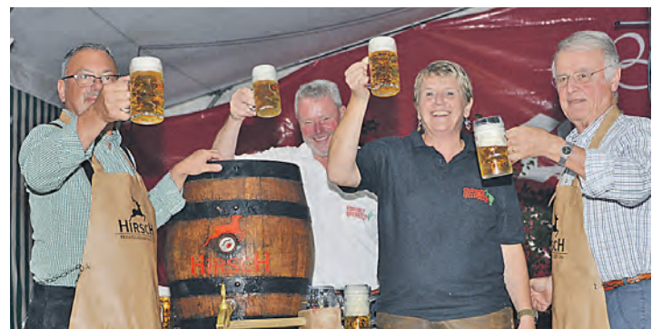
»A zapft ist« beim Ehinger Herbstfest. Stimmungsvoll geht es am nächsten Wochenende im Festzelt weiter.

Gottmadingen (swb). Die Ringer des KSV Gottmadingen konnten in Kandern die ersten Auswärtspunkte der neuen Saison erkämpfen. Dabei zeigten sie – wie schon in den ersten beiden Heimkämpfen – gute Leistungen, obwohl die Mannschaft verletzungsbedingt etwas umgestellt werden musste. Nach drei Kämpfen sind die Gottmadinger nun hinter Schiltigheim hervorragender Tabellenzweiter in der Verbandsliga. Die zweite Mannschaft kassierte in Hardt erneut eine Niederlage (22:12) und wartet weiter auf die ersten Punkte. Auch die Schüler unterlagen beim Saisonstart in Baienfurt, sowohl gegen die Gastgeber (20:16), als auch gegen die Nachbarn aus Singen mit 28:4. Am kommenden Samstag ringen alle drei Mannschaften zu Hause. Die Schüler empfangen die Staffel aus Winzeln, die wie Singen und Baienfurt zu den Favoriten in der Bezirksliga zählen (Beginn 17.45 Uhr). Die beiden aktiven Mannschaften empfangen jeweils die Teams aus Taisersdorf. Der Kampf der Zweiten beginnt um 18.30 Uhr, der Hauptkampf der ersten Mannschaft ist um 20 Uhr in der Gottmadinger Hebelhalle.