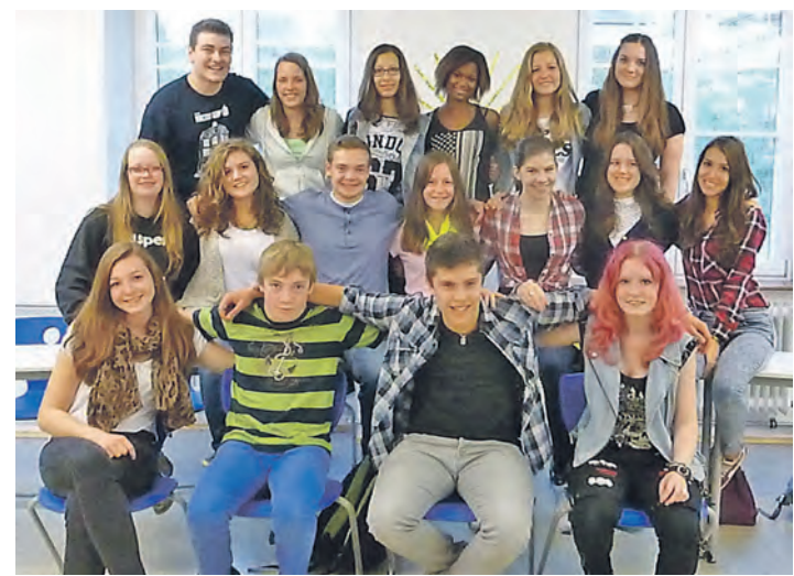
Die jugendlichen Teilnehmer aus dem Hegau beim Jugendchortreffen in Karlsruhe.