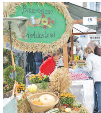
So bunt, spannend, vielfältig und abwechslungsreich wie unsere Natur sind auch die Angebote beim Engener Ökomarkt.