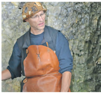
Spannendes gab es bei den Petersfelstagen zu sehen.