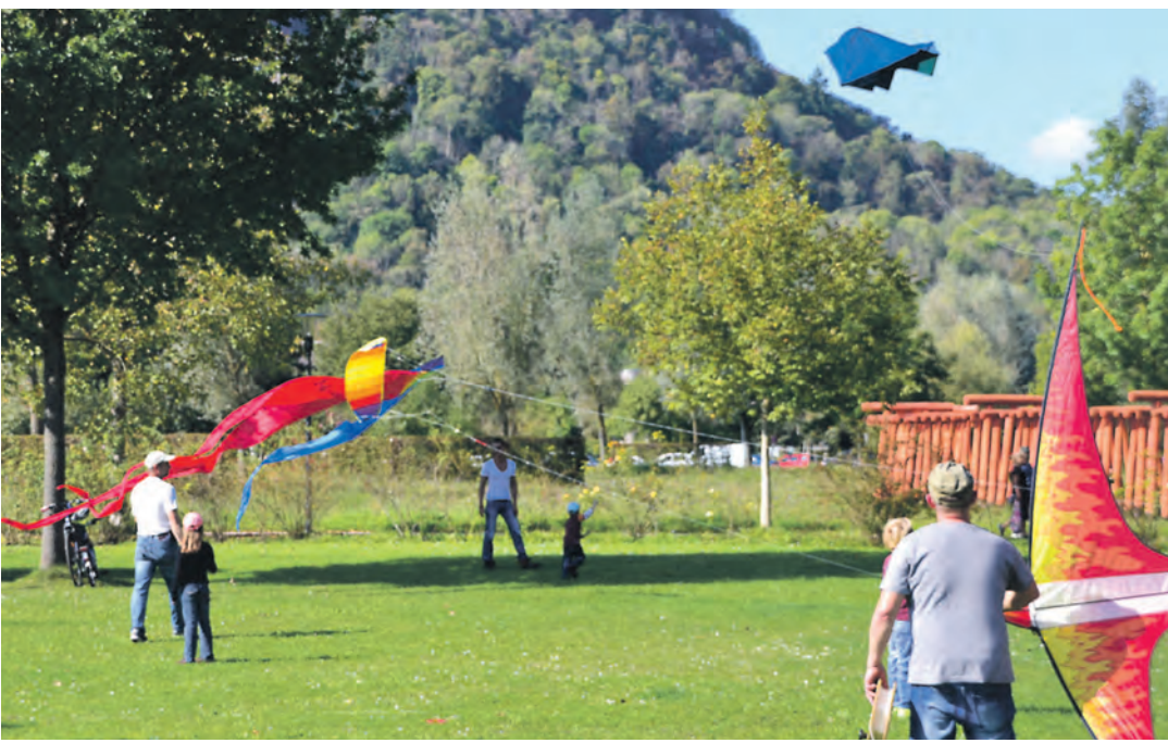
Viel Spaß hatten Groß und Klein beim 13. Drachenfest, auch wenn es aufgrund der Windverhältnisse gar nicht so einfach war, die Drachen steigen zu lassen.