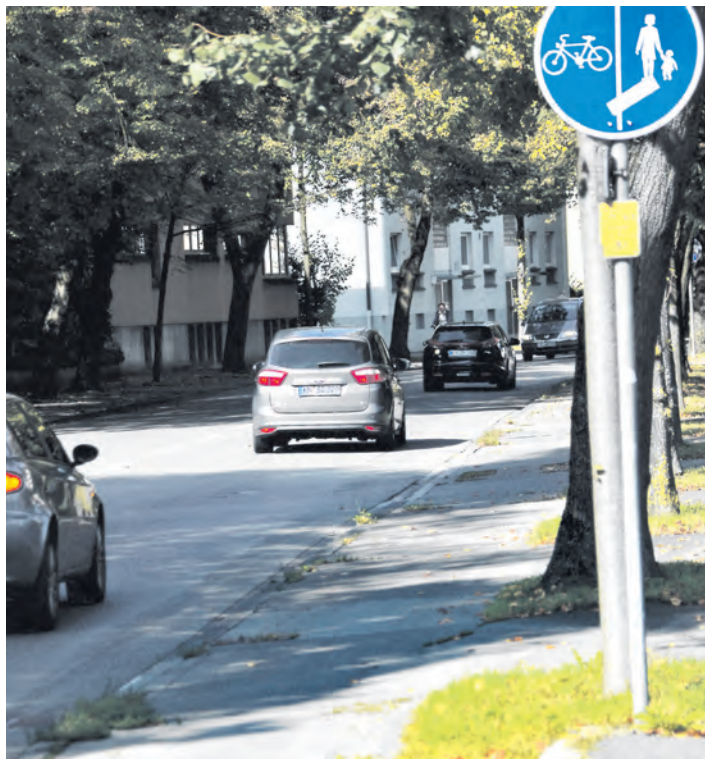
Im kommenden Jahr soll es endlich besser werden auf der Radweg- sub-Bild: stm

Diese beträgt für den 1,3 Kilometer langen Fahrradweg, den man in zwei Bauabschnitten (2015 vom Ortseingang bis Georg-Fischer-Straße) aufteilen könne, insgesamt etwa eine Millionen Euro, wovon rund 625.000 Euro auf den Radweg