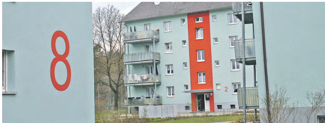
Singen sollte nicht nur günstigen Wohnraum schaffen sondern, auch höherwertige Angebote bieten können. Das stellt eine Studie vom »empirica« heraus.

Singen (of). Dass in Singen vor allem bezahlbarer Wohnraum fehlt, wird schon länger beklagt. Dass man darauf aber nicht unbedingt mit sozialem Wohnungsbau reagieren sollte, wurde am Dienstag im Gemeinderat vorgestellt. Denn eine Studie des Berliner Beratungs-Instituts »empirica«, die nicht nur von der Stadt Singen, sondern auch von der GVV und den Wohnbaugenossenschaften »Hegau« und »Oberzellerhau« mitfinanziert wurde und bereits im Mai letzten Jahres in Auftrag gegeben wurde, kommt aufgrund ihrer Prognose zur Entwicklung Singens zu der Erkenntnis, dass der Engpass nicht mehr sehr lange anhalten würde. Denn bereits in wenigen Jahren werde Singen wieder leicht schrumpfen, aufgrund der allgemeinen demographischen Entwicklungen. »Wenn sie da mit sozialem Wohnungsbau einsteigen, sind sie viele Jahre daran gebunden und haben wahrscheinlich einige Leerstände zu beklagen«, sagte in der Gemeinderatssitzung am