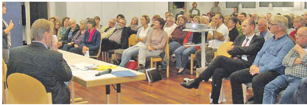
150 Interessierte kamen zu einem ersten Informationsabend für einen Flüchtlings-Helferkreis im Wichern-Saal zusammen.