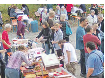
Zwanglos ging es beim ersten Willkommensfest für Flüchtlinge zu.

In Kooperation mit der Teestube, Wohlfahrtsverbänden und dem Kreisjugendamt stellten