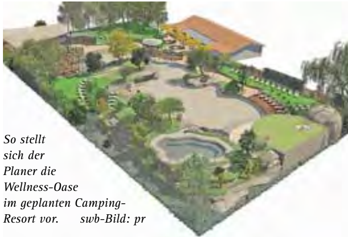
So stellt sich der Planer die Wellness-Oase im geplanten Camping-Resort vor.

Als Neuerung stellte er zusammen mit seinem Planer Martin Hoch eine Wellness-Oase vor, der auf der Fläche eines bislang als Biotop ausgewiesenen Bereichs entstehen solle. Dort sollen eine Saunalandschaft, Entspannungsbecken in einer Halle, ein Naturbecken unter freiem Himmel mit künstlichen Wasserfällen und Salzgrotte