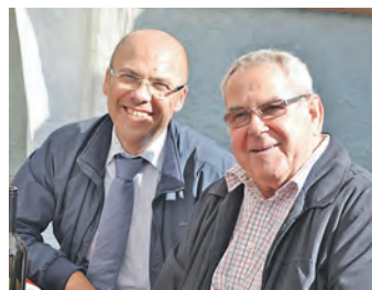
Der alte und der neue Bürgermeister freuen sich über die italienische Gastfreundschaft im alten Rathaus.

Schinken, der herzhaften Salsami und Mortadella gab es 27 Monate gereiften Parmesan und verschiedene Sorten Pecorino, aber auch leckere italienische Pasta mit Trüffeln und feine Weine.