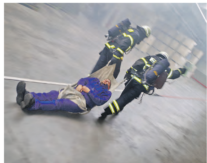
Ein verletzter Mitarbeiter musste bei der Hauptprobe der Werksfeuerwehren Georg Fischer und Maggi mit einem speziellen Bergungstuch aus der Halle geborgen werden.

Hallen ausbreiten würde. Mit leistungsstarken Ventilatoren wurde zudem der Rauch innerhalb weniger Minuten aus dem weitläufigen Hallenbereich herausgeblasen. Die Feuerwehrleute konnten sich dabei sogar aus einem Löschwasserteich bedienen, in dem die Dachwässer der Fabrikhallen gesammelt werden. Für die Zuschauer wurde im Anschluss noch eine Demonstration zur Löschung von Gasbränden wie auch die Explosion einer Spraydose demonstriert. Und als die Feuerwehrleute bereits ihre Geräte wieder eingepackt hatten, gab es vor dem gemütlichen Teil der Probe mit einem Brand in einem Gabelstapler noch einen realen Einsatz.