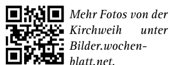
Mehr Fotos von der Kirchweih unter Bilder.wochenblatt.net.

sich über das tolle Wetter, denn die Schmuckstücke konnten gemütlich spazieren gefahren werden. Am Nachmittag zeigte die Jahreshauptübung der Freiwilligen Feuerwehr zusammen mit dem DRK-Ortsverein die Einsatzbereitschaft der Hilzinger Helfer. Bei ebenfalls schönstem Wetter lud der große Kirchweih- und Krämermarkt entlang der Hauptstraße am Sonntag und Montag zum Bummeln und Flanieren ein. Die örtlichen Vereine sorgten für das leibliche Wohl. Im großen Festzelt wurde vier Tage lang beste musikalische Unterhaltung zelebriert: vom stimmungsvollen Bierabend über Party mit der Band »Crash« bis hin zum »Tag der Blasmusik«. Der Vortrag von Dr. Roland Kessinger »Wir Schwaben im Hegau!« gab am Samstag einen Abriss der schwäbisch-alemanischen Geschichte von der Römerzeit bis in die Moderne. Am Sonntag lockte die Vernissage zur Kunstausstellung mit Bildern von Friedrich Mengele die Kunstliebhaber in den August-Dietrich-Saal. Das Leistungspflügen und der Segelflugbetrieb auf dem Flugplatz rundeten das randvolle Programm ab.