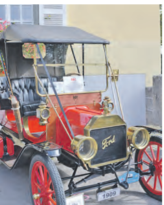
Neue Staatskarosse für den Bürgermeister? Nein - hier handelt es sich um ein Original Ford T-Modell.

schule zeigte die Patchworkausstellung der »Hohentwielstichler« die ganze Kreativität und das handwerkliche Geschick ihrer Damen. In der Remise des Museums gab es einen bestens sortierten Bücherflohmarkt und im Schulhof am Sonntag den beliebten Kinderflohmarkt. Drei Tage lang konnten die Besucher im Alten Rathaus kulinarische Köstlichkeiten aus der Umgebung der