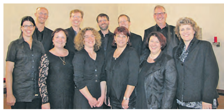
Das Hegau-Vokal-Ensemble tritt am Wochenende gleich zwei Mal für einen guten Zweck auf.