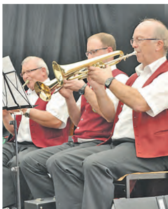
Der Musikverein spielte am Samstag im großen Festzelt auf.

Hilzinger Partnergemeinde Lizzano in Belvedere genießen. Zum hauchzarten Parma-