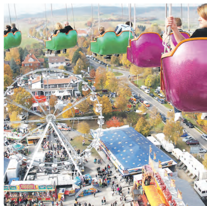
Absoluter Blickfang auf dem Schätzelemarkt ist das 32 Meter hohe Riesenrad.