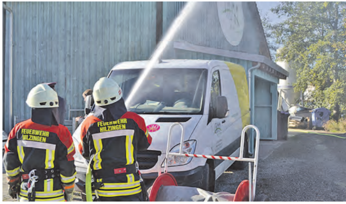
Bei der Jahreshauptprobe der Hilzinger Feuerwehr klappte am Samstag alles wie am Schnürchen.

Daher bot die diesjährige Einsatzsituation gleich zwei Vorkommnisse: Ein Auto war in die Wand einer Gärtnerei gefahren, wodurch drinnen ein großes Regal mit brennbaren Betriebsstoffen umfiel, die zu einem Feuer in der Lagerhalle führten. Im Inneren der Halle wurde eine Person vermisst und der Fahrer des PKW war in seinem Fahrzeug eingeklemmt. Nach der Hilzinger Feuerwehr wurden dann auch die Nachbar-Wehren aus Gottmadingen