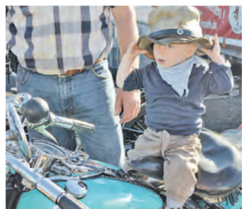
Wenn ich groß bin, werde ich Rocker ...!