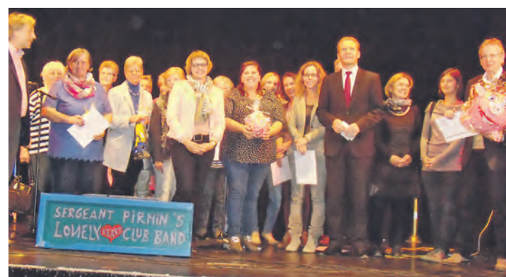
Zusammen mit der »Sgt. Pirmins lonely Heart Club Band« kamen Preisträger und Stifter des Agendapreis 2014 zum Gruppenbild auf die Bühne.

woch im Michael-Herler-Heim treffen, um den Bewohnern des Heimes den Aufenthalt angenehmer zu gestalten. Zudem arrangierten sie mehrere Flohmärkte, deren Erlös der Kinderkrebeklinik Katharinenhöhe zu Gute kam.