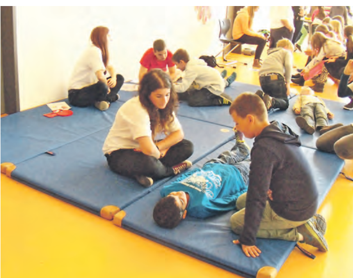
Jede Menge »Verletzte« galt es beim Helfertag der Beethovenschule Singen zu behandeln.

Somit macht Helfen Schule und die SchülerInnen können sich in Notsituationen besser zurecht finden. Ein hilfreiches Projekt zu dem jede helfende Hand gebraucht wird.