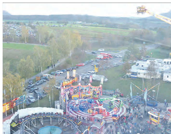
Eine tolle Kulisse mit großem Krämermarkt, spannendem Vergnügungspark, gemütlichem Festzelt und interessanter Gewerbeschau bot der diesjährige Schätzelemarkt in Tengen seinen Besuchern. Vor allem am Sonntag war die 724.

Gottmadingen (swb). Seit kurzem weisen Hinweistafeln an den Ortseingängen auf den nahenden Brettlermarkt (Skibörse) hin. Dieser findet statt am Samstag, 8. November, in der Eichendorffhalle. Der Veranstalter ist die Ski-MaXi-Carvingschule e. V. Die Skilehrer und Helfer nehmen die im sauberen und einwandfreien Zustand befindlichen Winter-sportartikel von 10 bis 12 Uhr an. Der Verkauf der angenommenen Artikel ist dann von 14 bis 15 Uhr. Die Abholung der nicht verkauften bzw. verkauften Artikel ist an gleicher Stätte von 16 bis 16.30 Uhr. Das MaXi-Cafe ist zu den genannten Zeiten geöffnet.