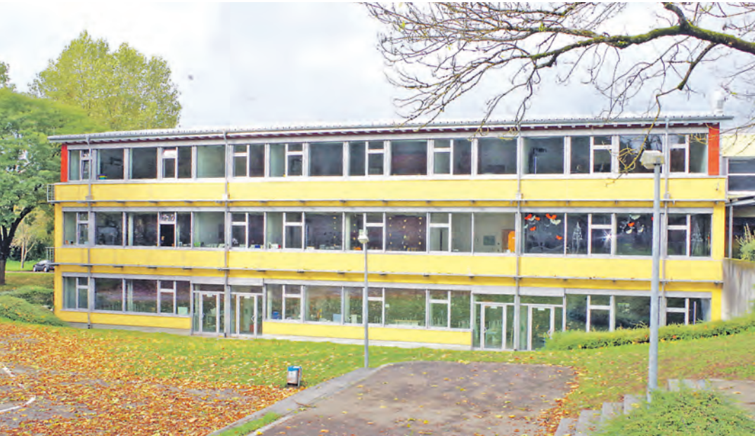
Der erst vor einigen Jahren geschaffene Anbau an der Ten-Brink-Schule Rielasingen wurde in rund einjähriger Bauzeit um ein weiteres Stockwerk erweitert.