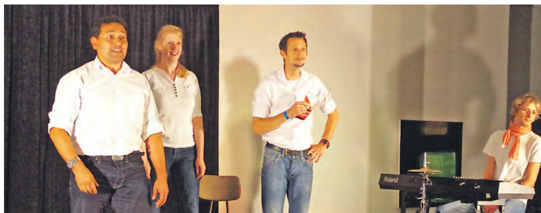
Lange Schlangen gab es in der Theaternacht vor dem Kunst-Museum Singen. Unter anderem wegen den bewegten Aufführungen des Impro-Theater Konstanz.