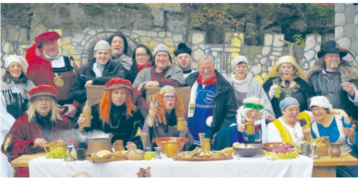
Die Schauspieler des diesjährigen Martinispiels boten zur Eröffnung der 5. Jahreszeit in der Ruine Rosenegg wieder ein trefflich garstiges Spiel um Feste, die ohne Geld gefeiert werden sollten.