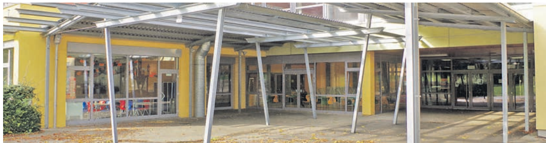
Viel Geld hat die Gemeinde Rielasingen-Worblingen in den letzten Jahren in ihre Ten-Brink-Schule investiert. Die inhaltliche Zukunft muss der Gemeinderat nun nochmals entscheiden.

Von den 3.020 gültigen Stimmen entfielen dabei 1.829 Stimmen auf die Forderung, den Gemeinderatsbeschluss vom April zur Beantragung einer Gemeinschaftsschule aufzuheben. Das sind 18,74 Prozent. Damit wurde das in der Gemeindeordnung vorgeschriebene Quorum von 25 Prozent bei weitem nicht erreicht. Für die Beibehaltung des Gemeinderatsbeschlusses stimmten allerdings noch weniger ab, nämlich 1.191 Stimmbürger, oder 12,20 Prozent. Das Ergebnis sorgte gleich nach der Bekanntgabe für sehr intensive Diskussionen aller Seiten. Bürgermeister Ralf Baumert verwies darauf, dass der Gemeinderat das Thema am 19. November in seiner Sitzung