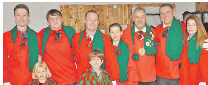
Die Hohentwiel-Hansele haben zum Start in die Fastnacht Zuwachs bekommen.