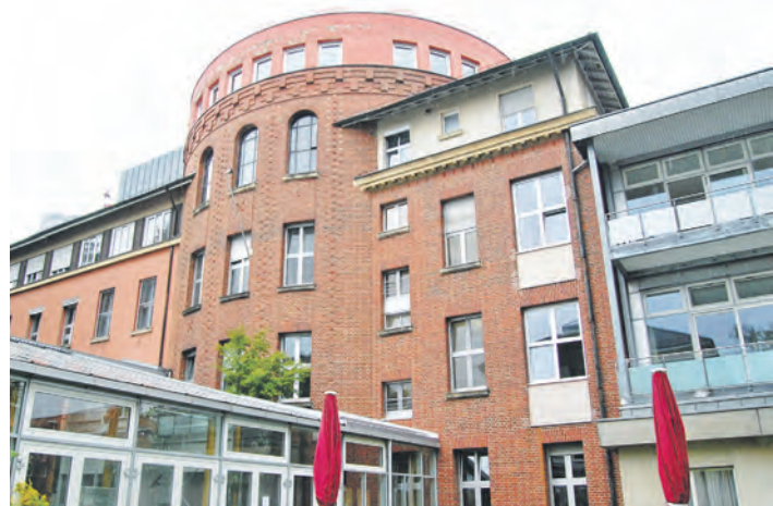
Der Unternehmenswert des Hegau-Bodensee-Hochrhein-Klimikums war zur Kreisfusion viel zu hoch angesetzt worden. Daraus könnten Singen und den weiteren Partnern in der Betriebsgesellschaft HBK wie den Konstanzer Kliniken Nachzahlungspflichten in Millionenhöhe entstehen.

Singen (of). Wie viel sind die Unternehmen des Gesundheitsverbands im Landkreis wert? Der Wert, der jedenfalls definiert wurde, als die HBH-Kliniken nach der drohenden Insolvenz in den Gesundheitsverband im Landkreis Konstanz vor zwei Jahren eingebracht wurde, war jedenfalls zu hoch. 43,1 Millionen Euro hatten damals die Wirtschaftsprüfer der globalen Kanzlei »Pricewaterhouse Cooper« (PwC) errechnet. Der Wert hielt vor den Bilanzprüfern nicht stand und wurde für die ehemaligen Hegau-Bodensee-Hochrheinkliniken auf 19,5 Millionen Euro, für die Konstanzer Kliniken von 38,6 auf 24 Millionen Euro reduziert. Diese Wertreduzierung kann freilich drastische Folgen für die Städte und Gemeinden des Gesundheitsverbands haben. Denn der aus heutiger Sicht überhöhte Wert ist im Handelsregister festgeschrieben und könnte unter bestimmten Bedingungen in Form einer Nachzahlung als sogenannte »Differenzhaftung« eingefor-