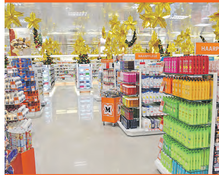
Die neue Filiale führt ein umfangreiches Sortiment aus Kosmetik, Süßwaren, Schreib-, Haushalts- und Spielwaren.