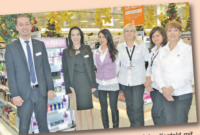
Die freundlichen Mitarbeiter freuen sich auf den Kontakt mit vielen Kunden.