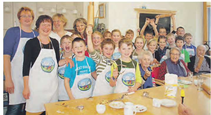
Die fleißigen Gänsebäcker nach getaner Arbeit im Pflegeheim St. Verena in Arlen.

anlässlich des Martinstags – Gänse zu backen. Eifrig wurde Teig geknetet und ausgerollt und viele, viele Gänse ausgestochen. Schließlich sollten jede Bewohnerin und jeder Bewohner eine Martinsgans bekommen – das war der Vorsatz der Schülerinnen und Schüler – steht doch St. Martin sinnbildlich dafür, dass man mit anderen Menschen teilen soll.