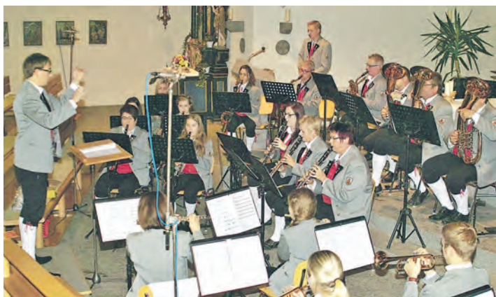
Ein stimmungsvolles Herbstkonzert veranstaltete der Musikverein Schlatt unter Krähen.