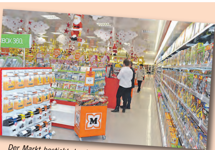
Der Markt besticht durch eine große Auswahl an Multimedia-Artikeln und Spielwaren.

Die neue Müller-Filiale im FMZ Stegleacker hat Montag bis Freitag von 08.00 bis 20.00 Uhr und am Samstag von 8.00 bis 18.00 Uhr für Sie geöffnet.