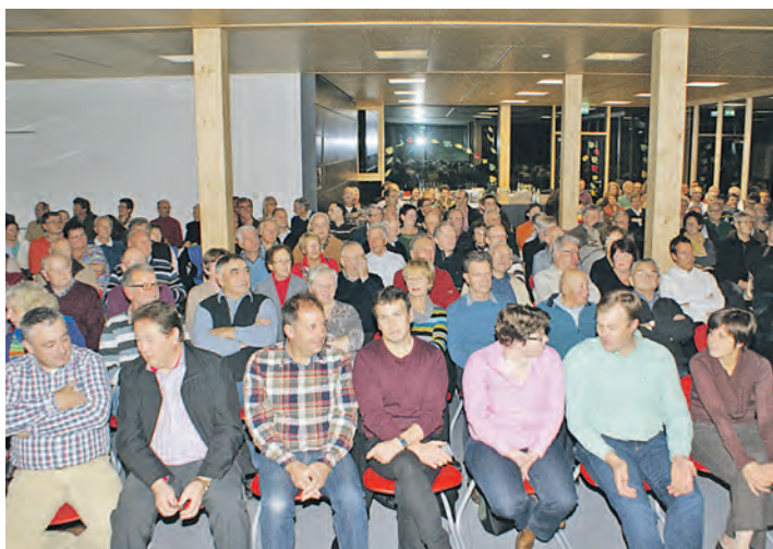
Bis auf den letzten Platz war die Mensa der Gemeinschaftsschule bei der Bürgerversammlung gefüllt.

Steißlingen (le). Ein richtiges Gedränge herrschte bei der Steißlinger Bürgerversammlung am vergangenen Mittwoch. Der Andrang war so groß, dass im großen Saal der Mensa in der neuen Gemeinschaftsschule immer wieder weitere Stühle herbeigeschafft werden mussten. Das freute natürlich Bürgermeister Artur Ostermaier, der seine Meinung, dass Versammlungen dieser Art durchaus ihre Bedeutung haben, bestätigt sah. Nicht so groß war leider der Andrang, als der Bürgermeister nach einem eindrucksvollen Plädoyer für eine würdige und angemessene Empfangskultur von Flüchtlingen und Asylbewerbern unvermittelt fragte, wer sich daran beteiligen wolle. Zunächst gab es keine Wortmeldung, bis man sich darauf einigte, mit Unterstützung des Landratsamtes eine Art »runden Tisch« ins Leben zu rufen, von dem aus alles Notwendige und Wünschenswerte gesteuert werden soll. In diesem Jahr sollen Steißlingen nach den bisherigen Verteilerquoten 11 und im Jahr 2015 voraussichtlich 26 Flüchtlinge zugewiesen werden. Diese Zahlen können sich, wenn die Flüchtlingsströme im