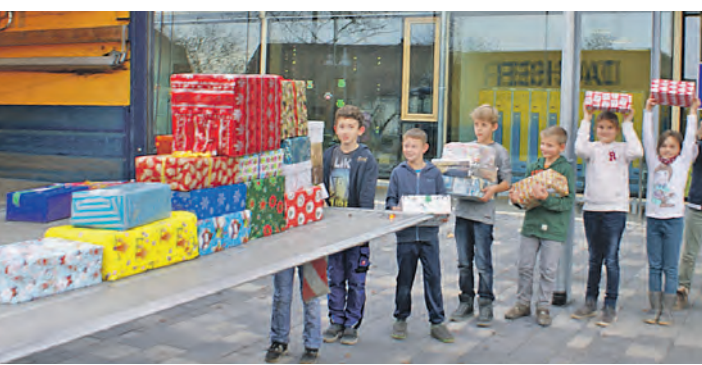
Die Kinder der Steiblinger Gemeinschaftsschule starten ihren Weihnachtspäckchenkonvoi.