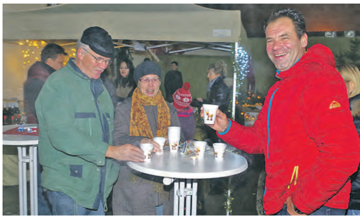
Beste Stimmung herrschte auf dem Arlener Adventsmarkt am neuen Standort.