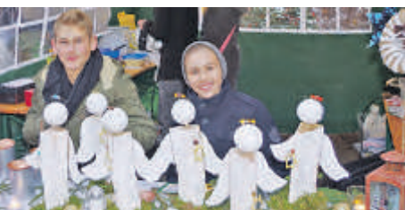
MI., 10. DEZEMBER 2014

Das Museumsbahnfest soll am 9. Mai stattfinden. Im Herbst heißt es »Pack den Rucksack«.