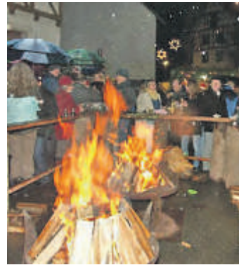
So stimmungsvoll ist es auf dem Steißlinger Weihnachtsmarkt. sub-Bild: le

Am Samstag, 13. Dezember, findet der Weihnachtsmarkt bereits zum 26. Mal statt. Mit seinem großen Angebot an allem, was kleine und große Herzen in der Vorweihnachtszeit höher schlagen lässt. Vor allem aber mit seiner urgemütlichen vorweihnachtlichen Stimmung hat er sich weit über die Gemeindegrenzen hinaus einen sehr guten Ruf erworben und lädt nicht nur zum Kaufen, sondern vor allem zum Gespräch miteinander ein. Eröffnet wird der Weihnachtsmarkt in diesem Jahr um 13 Uhr in der Mensa der Gemeinschaftsschule mit dem ersten gemeinsamen Musik-Theaterprojekt der Gemeindegemeinschaftsschule und der Gemeinschaftsschule »Roter König – weißer Stern«. Das Stück erzählt die Geschichte vom Vierten König. Der Indianerhäuptling Silbermond beschließt ebenfalls, wie die drei Könige, dem Stern zu folgen. Nach Jahren der Suche erkennt er, dass es der Sinn seines langen Weges war, Menschen zu begegnen, die für ihn wichtig wurden und ihn am Ende zu Jesus führten. Weiter wirken wie immer das Chöre des Kindergartens »Storchennest«, die Alphornbläser aus Beuren, das Jugendblasorchester der Gemeindegemeinschaftsschule und der Gesangsverein »Liederkrantz« mit.