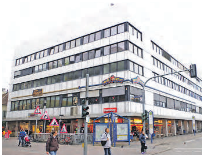
Die Stadt Singen steigt jetzt mit ECE in die weitere Planung auf ein Shopping-Center auf dem Areal des Holzer Baus ein. Basis dafür ist ein am Dienstag beschlossener Rahmenvertrag.

Singen (of). Seit dem Grundsatbschluss zum Planungsstart für ein ECE-Shopping-Center vor der Sommerpause wurde hinter den Kulissen schon heftig gearbeitet. Am gestrigen Dienstag konnten deshalb der Ausschuss für Stadtplanung und Bauen (ASB) und der Verwaltungs- und Finanzausschuss (VFA) des Gemeinderats schon einstimmig einem Rahmenvertrag mit dem Investor ECE zustimmen, der letztlich vom Gemeinderat aber am kommenden Dienstag in der Haushaltssitzung noch bestätigt werden muss. Dieser Rahmenvertrag ist eine verbindliche Vorstufe für einen sogenannten »Vorhabenbezogenen Bebauungsplan«, der in Form eines städtebaulichen Durchführungsvertrags die spätere Gestalt, wie auch die Angebote für ein Shopping-Center regelt und im günstigsten Fall nach einer Vielzahl von Verhandlungsterminen in etwa einem Jahr unterschreibbar sein könnte. Die Stadt Singen werde die