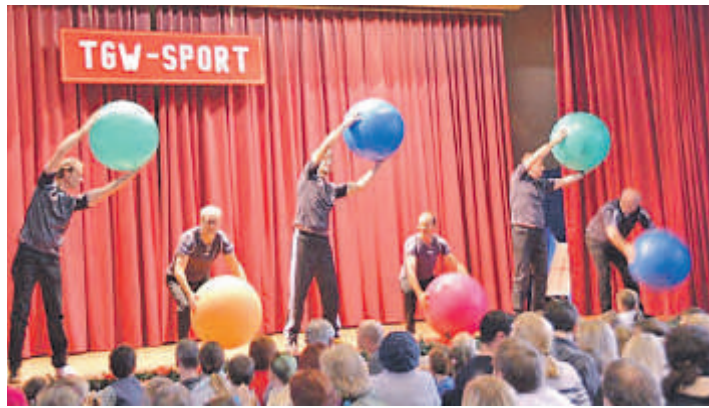
Kreativ und kunterbunt waren die Auftritte bei der Turnshow der TG Welschingen.