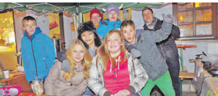
Viele Schulklassen und Initiativen werden sich auf dem Rielasinger Weihnachtsmarkt am Donnerstag diesmal rund ums Rathaus präsentieren.