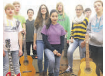
Spanische Gitarrenmusik bietet der Nachwuchs der JMS Singen.

Singen (swb). Heiße Sonne, stolze Tänzerinnen, Don Quichote, Goya, Gaudi und feuriger Flamenco finden ihren Ausdruck in der Musik Spaniens und Lateinamerikas. Schülerinnen und Schüler des Fachbereichs Gitarre der Ju-