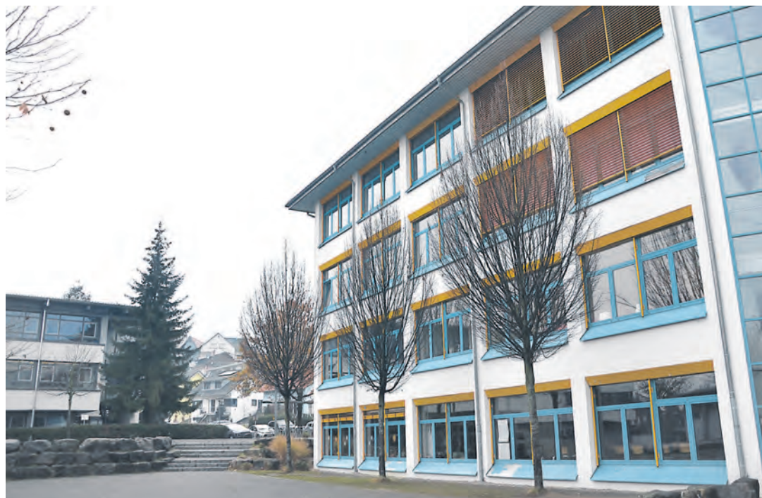
Zwischen Realschule und »Nellenburg-Gymnasium« soll ein neues Schulzentrum entstehen, und in der Mensa des Gymnasiums soll künftig an fünf Tagen eine Mahlzeit angeboten werden. sub-Bild: sw

In der Mensa des Stockacher »Nellenburg-Gymnasiums« soll künftig auch freitags eine Mahlzeit angeboten werden – bisher war nur an vier Tagen montags bis donnerstags eine Essensausgabe an Schüler erfolgt. Auf eine entsprechende Nachfrage von Stadtrat Walter Knoll (CDU), im Rahmen der Haushaltsberatungen im Gemeinderat, kündigte Hauptamtsleiter Hubert Walk an, dass eine Aufstockung des Essensangebots wohl im Laufe des Jahres möglich sein werde. Die Abstimmung mit dem Personal, das zu einem großen Teil aus Teilzeitkräften besteht, müsse noch erfolgen, doch die Maßnahme sei auf dem Weg. In Vorgesprächen wäre die Schule für eine Essensausgabe an nur vier Tagen eingetreten, nach dem Start der Mensa sei aber der Wunsch nach einer Ausdehnung auf fünf Tage erfolgt.