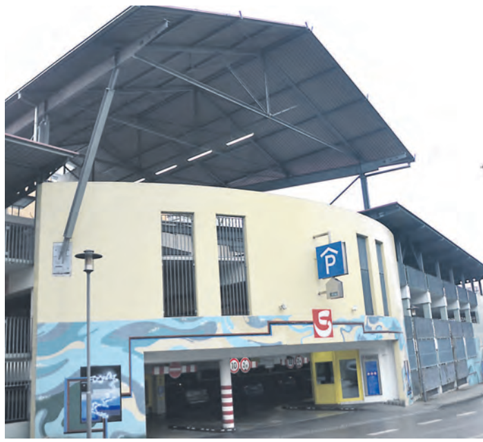
Im Parkhaus wird eine Parkraumbewirtschaftung eingeführt.

Stockach (sw). Die Änderung des Parkkonzepts und die vorgesehene Parkraumbewirtschaftung im Parkhaus am Hägerweg in Stockach sorgen für Unmut im Gemeinderat. Zwar hatte das Gremium die Maßnahmen bereits mehrheitlich beschlossen, doch im Rahmen der Haushaltsberatungen wurden sie erneut in Frage gestellt. Harald Karge (SPD) prangerte die dafür eingestellten 120.000 Euro, von denen 75.000 Euro auf Parkautomaten entfallen würden, an. Er halte das Parkkonzept zudem für nicht durchsetzbar, ergänzte der Genosse auf Nachfrage: Das Straßenverkehrsrecht würde eine unklare Rechtslage nicht zulassen. Es müsse klar erkennbar sein, wo man wie lange und nach welchen Modalitäten parken dürfe. Das sei aber durch die Neuerungen in Stockach nicht gewährleistet: »Wie soll ein normaler Mensch da noch durchblicken?« Straftzettel, die in diesem rechtlichen Wirrwarr ausgestellt würden, würden bei Klagen vor