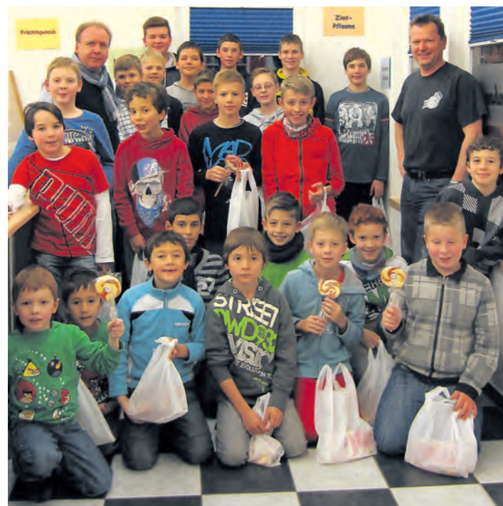
Schmackhafter Ausflug: Die »Jung-Hänsele« erlebten zum Jahresabschluss eine »süße« Überraschung.

Stockach (swb). Die aktiven und passiven Mitglieder des Männergesangsvereins Mahlspreu im Hegau kommen am Samstag, 25. Januar, um 20 Uhr im »Adler« in dem Stockacher Ortsteil zu ihrer Jahreshauptversammlung zusammen.