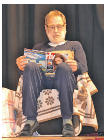
Wenn der Landfunk aus Gallmannsweil dazwischenfunk, wird der geneigte TV-Zuschauer gut unterhalten, meinten die Zimmerer.