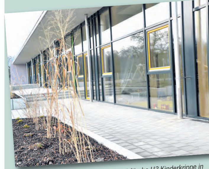
Nicht nur von Außen macht die erste städtische U3-Kinderkrippe in der Radolfzeller Nordstadt einiges her. Auch das Innere kann sich sehen lassen. Alle Räumlichkeiten wurden nach dem Reggio-Konzept entworfen.