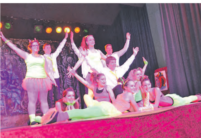
Sie setzten einen grellen Glanzpunkt beim »Fasneteröffnen«: Die jungen Marketenderinnen wurden bei ihrem Neon-Tanz von mutigen Jung-Hänsele unterstützt.