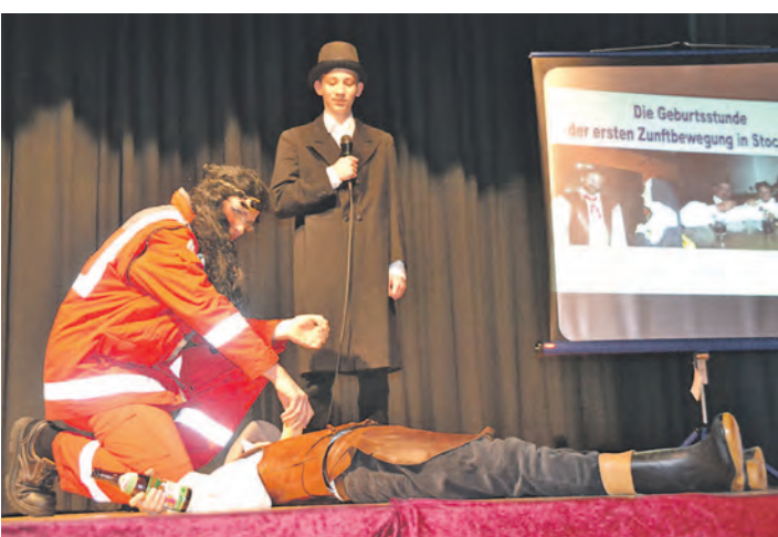
Gehaltvoll war der Sketch der jungen Laufnarren.