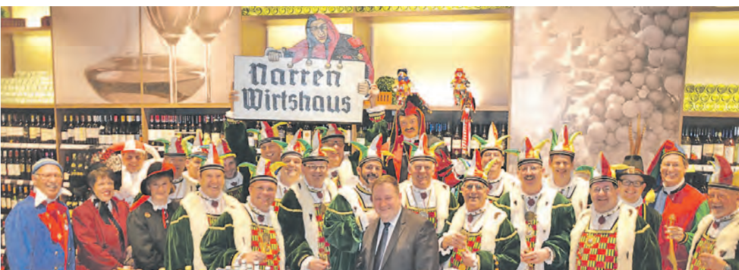
Prickelnde Premiere: Im »Aach-Center« und bei »Nah und gut - Sulger« in Stockach wird künftig der Hans-Kuony-Sekt, die Hausmarke des Narrengerichts, zum Verkauf angeboten.