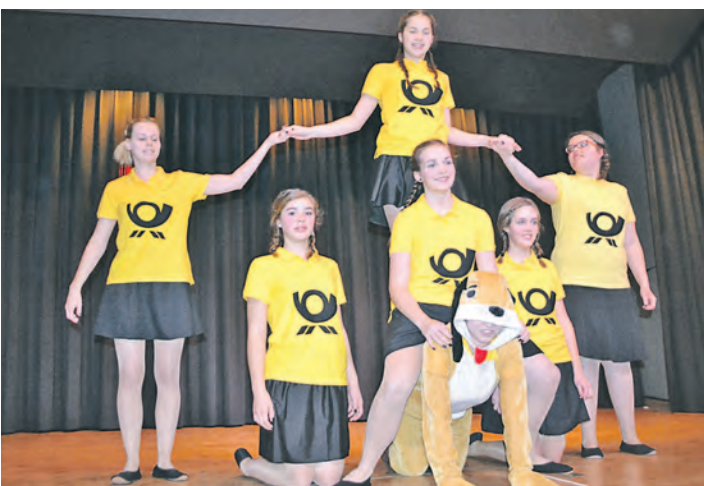
Mitreibend wie der »Zalando«-Schrei: Beim Tanz der jungen Alt-Stockacherinnen ging die Post ab.