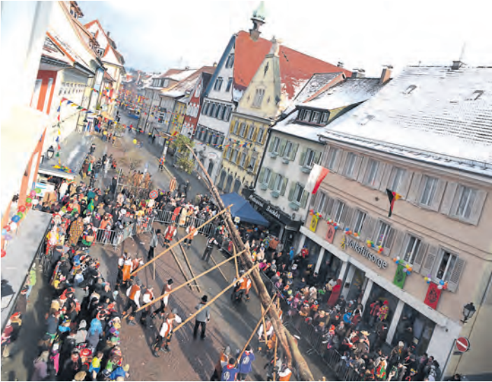
Fasnettermine sind gefragt! Auch in der heißen Phase der Fasnet möchten Narren und Fans der Narretei einen kühlen Kopf bewahren. Dabei wird ihnen der Fasnachtsterminkalender helfen, den das WOCHENBLATT in seiner Ausgabe am Mittwoch, 19. Februar, veröffentlicht. Daher bitten wir alle Narrenzünfte, ihre Termine bis spätestens Freitag, 7. Februar, an s.weiss@wochenblatt.net zu schicken. Spätere Einsendungen können wir leider nicht mehr berücksichtigen.

Die Bootstour am Samstag ist bereits ausverkauft, doch für Donnerstag und Freitag gab es bei Redaktionsschluss noch Tickets. Die Karten sind im Kulturzentrum »Altes Forstamt« in der Salmannswilerstraße erhältlich.