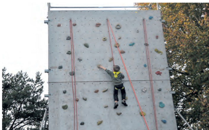
Auch für die Betreuung der Kletterwand ist die Stadtjugendpflege zuständig. Die Wand kam auf verschiedenen Festen wie der Gewerbeschau und dem Mostfest in Orsingen oder dem »Schweizer Feiertag« in Stockach zum Einsatz.