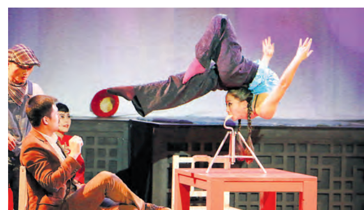
Mit akrobatischen Glatzleistungen faszinierte der Chinesische Nationalcircus das Publikum im Milchwerk.

Radolfzell (pud). Seit 25 Jahren begeistert der Chinesische Nationalcircus das Publikum in ganz Europa mit einer einzigartigen Tanz- und Akrobatikshow, die gleichzeitig eine Präsentation einer fremden, faszinierenden Kultur ist. Am vergangenen Dienstag gastierten rund 20 Ausnahmeartisten aus dem Land des Lächelns mit ihrer neuen Show »Shanghai Nights« im Milchwerk und zogen die Zuschauer in ihren Bann. Mit scheinbar spielerischer Leichtigkeit boten sie eine perfekte Verbindung aus Kraft und Körperbeherrschung, anmutiger Eleganz und tänzerischem Können, Poesie und Spaß. Unterstrichen wurden die jeweiligen Auftritte mit passender Musik - mal ertönte Glenn Millers »In the Mood«, dann »Nothing else matters« der Metal-Band »Metallica«. Der Ort des Geschehens war gut gewählt. Man fand sich in ein Teehaus der Hafenstadt in den 1930er und 1940er Jahre zurückerückversetzt. Hier, im Schmelztiegel verschiedener Kulturen und Nationalitäten, entwickelte sich ein neues China. Im Tee-