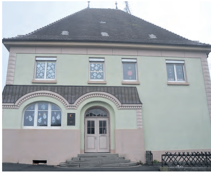
In Hohenfels wird ein neues Schulhaus gebaut, doch über die Zukunft der bisherigen Korbinian-Brodmann-Schule (unser Foto) wurde noch nicht entschieden.