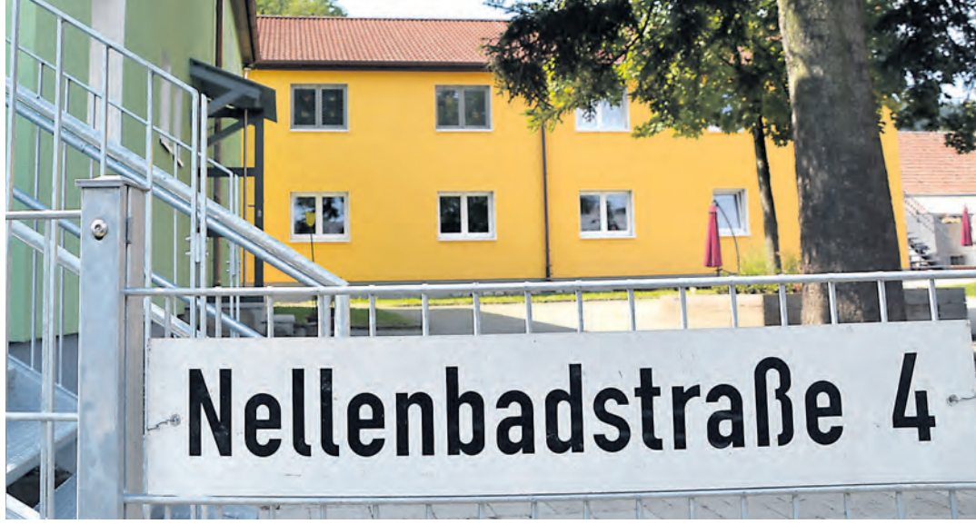
In den Kindergärten und Kinderkrippen der Stadt Stockach sind Erzieherinnen gefragt.