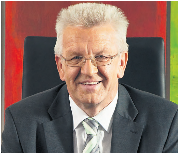
Ministerpräsident Winfried Kretschmann freut sich als Beklagter 2014 vor dem Stockacher Narrengericht auch auf »christdemokratische Spabvögel«.

Winfried Kretschmann: Am »Schmotzigen Dunschdig« 2011 haben mich die Nasenschleifer in Meßkirch angeklagt, wegen »unverzeihlicher närrischer Vergehen«. Damals wäre ich fast mit einem Freispruch davon gekommen... WOCHENBLATT: Als Schwabe stehen Sie vor einem badi-schen Gericht. Werden Sie die Richter wegen Befangenheit ablehnen oder wählen Sie eine