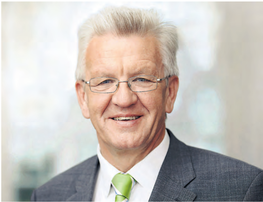
Der baden-württembergische Ministerpräsident Winfried Kretschmann (»Die Grünen«) stand dem WOCHENBLATT-Interview Rede und Antwort.

Winfried Kretschmann: Unser Ziel ist ein Zwei-Säulen-Modell mit dem Gymnasium einerseits und einem integrativen Bildungsweg andererseits, der sich