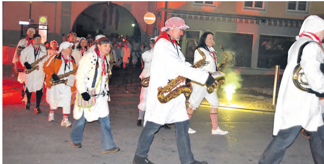
Der Dresscode ist beim »Hemedglonkerball« klar: Weiße Hemden sind Pflicht.

Zu einem Maskenball lädt der Musikverein Wahlwies am Sonntag, 2. März, um 20 Uhr in den »Blauen Affen«, im Winkel, ein.