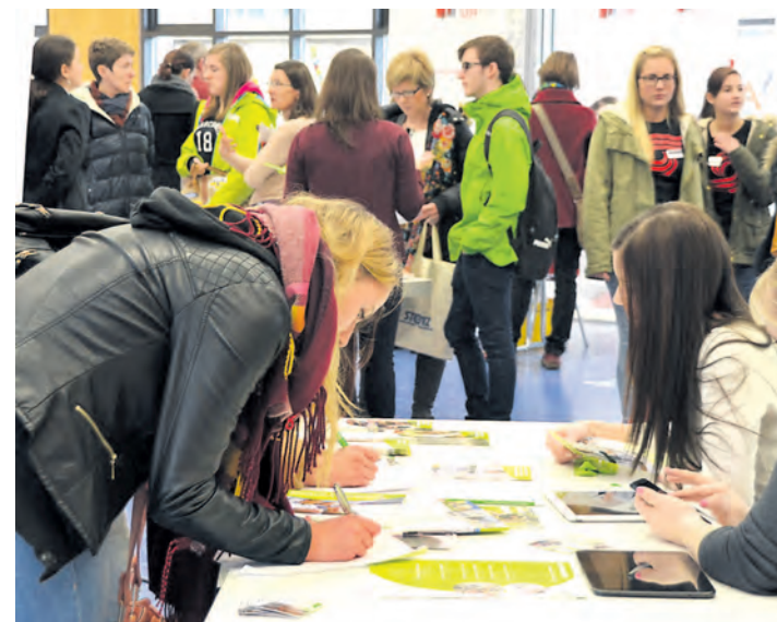
Erstmals wurde auch die Mensa der Grund- und Werkrealschule Stockach zum Veranstaltungsort des »Karrieretages« in Stockach.

Auf diesen Bausteinen, die eine Karriere ermöglichen können, baut der »Karrieretag« auf. Neben dem BSZ-Schulgebäude und der Kreissportturnhalle war der Veranstaltungsradius erstmals auf die Mensa der Grund- und Werkrealschule (GuW) in der Tuttlinger Straße ausgedehnt worden, wo die Hoch-