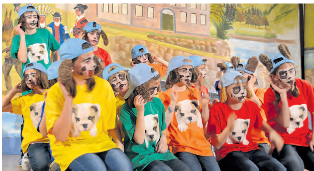
Viel Unterhaltung war bei den »Bunten Abenden« der »Seehasen« aus Ludwigshafen geboten.

mütliche Ambiente über 1.500 Besucher angelockt. Seit sechs Jahren wird ein Großteil des Erlöses an wohltätige Zwecke gespendet - insgesamt konnten sich soziale Einrichtungen, Gruppen und Vereine über 15.000 Euro aus den Einnahmen des Oktoberfestes freuen. Und eine Riesengaudi ist es zudem immer gewesen.