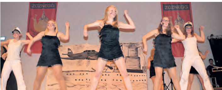
Gelungene Performance beim Brauchtumsabend - mit der Showtanzgruppe aus Zizenhausen.

Mehr Fotos und Berichte im Internet unter www.wochenblatt.net .