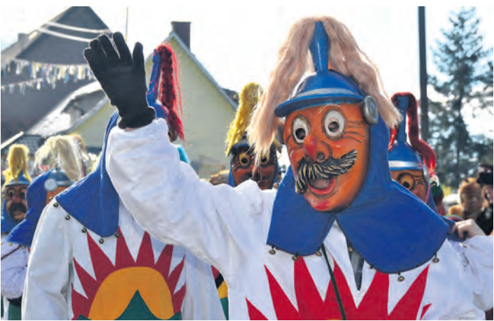
Die Nachbarn waren beim großen Umzug am Sonntag, 23. Februar, mit dabei - auch die »Sunnelöcher« aus Mühlingen.