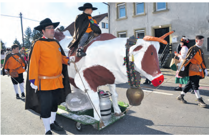
Da flog die Kuh, da stepte der Bär: Die Hohenfelfer »Kuksattler« gaben sich die Ehre.