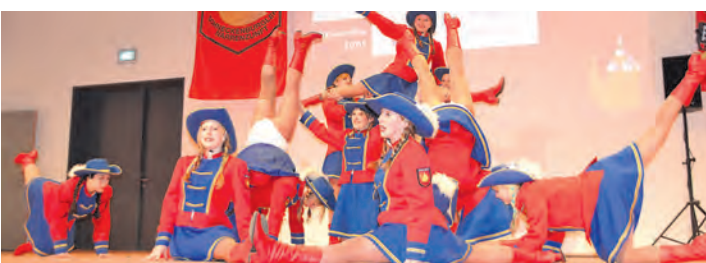
Die Burggarde aus Zoznegg zeigte graziöse Eleganz.