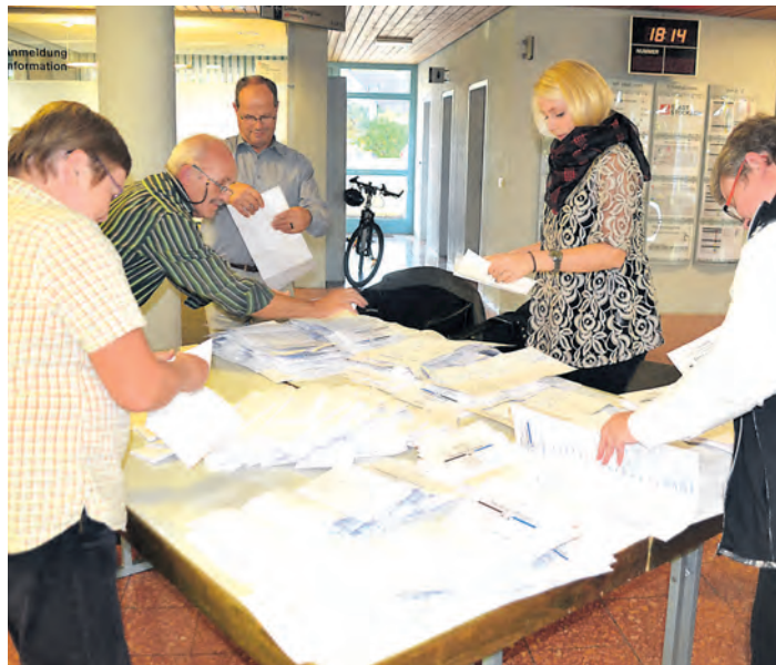
Am Sonntag, 25. Mai, werden nach der Kommunalwahl wieder Stimmen ausgezählt, wie am 27. März 2011 bei der Landtagswahl (unser Foto). Doch viele Parteien hatten im Vorfeld Probleme bei der Kandidatenfindung für ihre Listen. An der Streitkultur im Stockacher Gemeinderat kann es nicht liegen, meinen Mitglieder des Gremiums.

Stimmen zur Streitkultur im Stockacher Gemeinderat