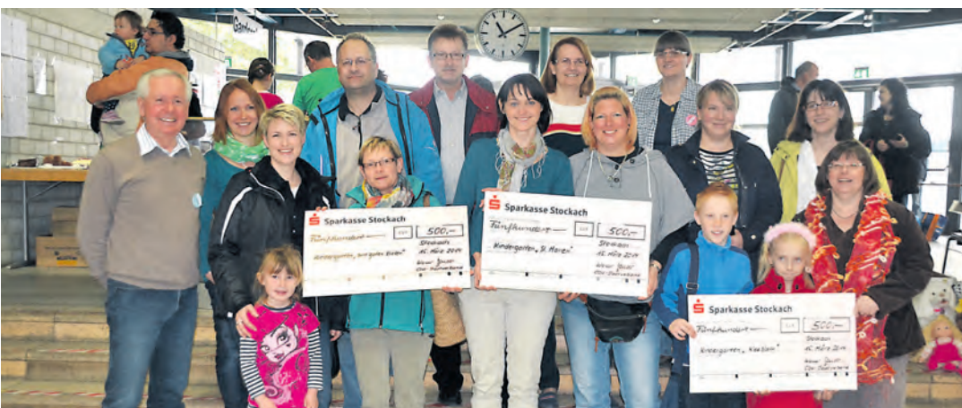
Mitglieder der »Krabbel-Babbel-Gruppe« und des CDU-Stadtverbands spendeten den Erlös aus der Kinderkleiderbörse an den Kindergarten »Kleeblatt« sowie dem evangelischen und katholischen Kindergarten.