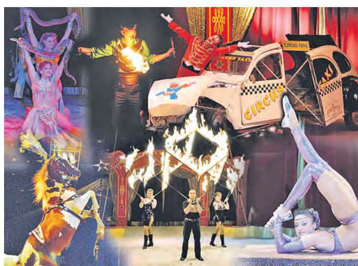
Ein buntes Programm-Feuerwerk möchte der »Circus Montana« bieten, der von Freitag, 15., bis Sonntag, 17. August, in Stockach gastiert.