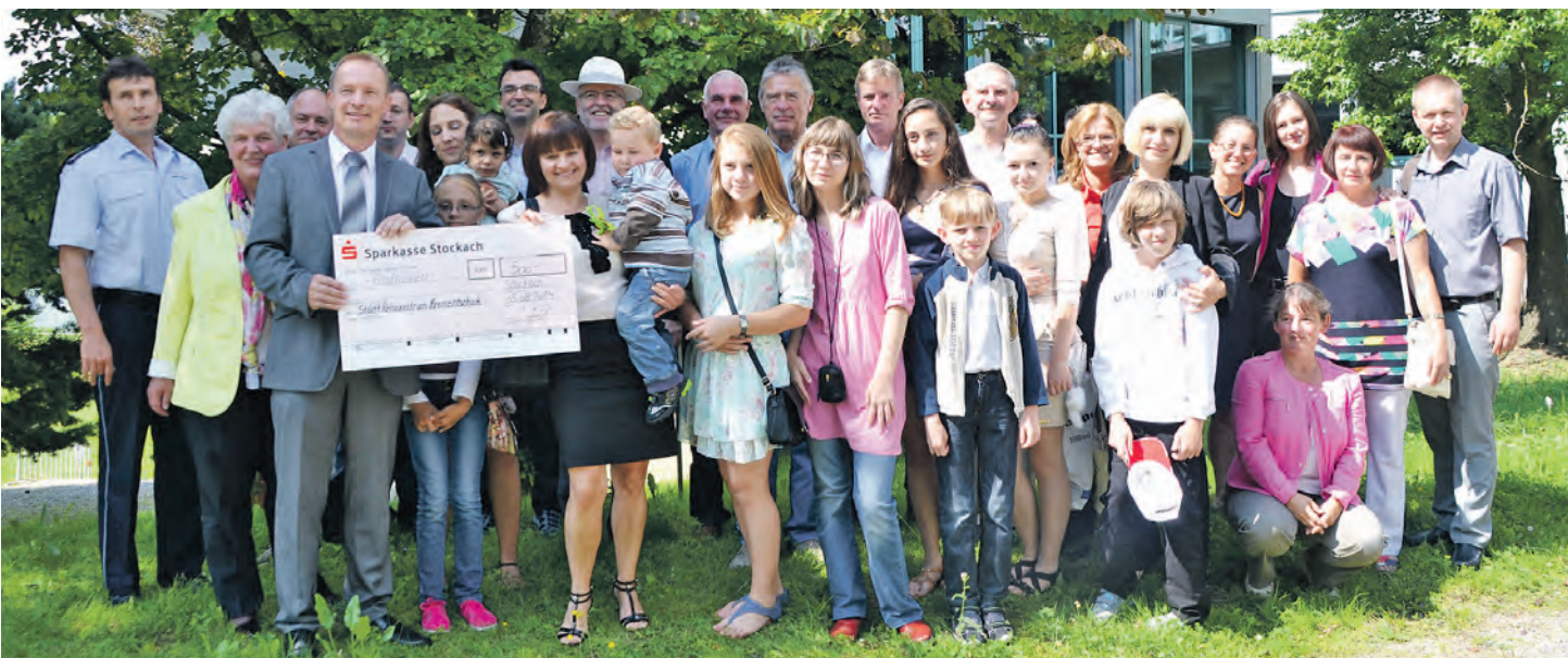
Sieben Kinder, zwei Betreuerinnen und ein Dolmetscher aus dem ukrainischen Kremenchuk halten sich zur Erholung in Stockach auf. Der Besuch wird von vielen Sponsoren und Spendern finanziert.