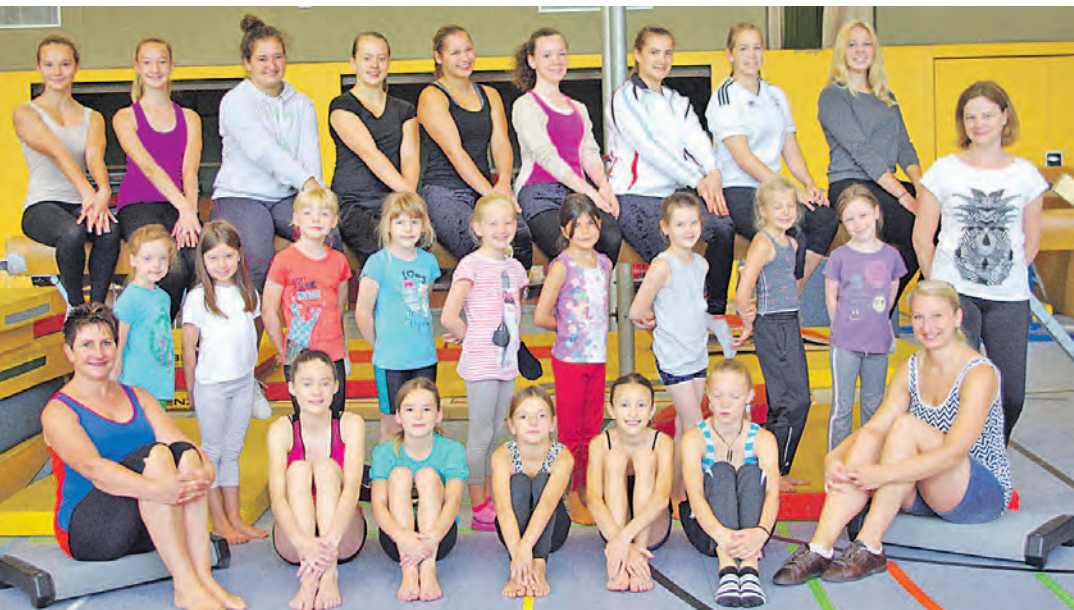
Das war ein richtig gelungenes Wochenende. Sport, Spannung, Spaß und Spiel standen auf dem Programmzettel, und diese Ansprüche wurden laut einer Pressemitteilung des TV Jahn voll erfüllt. Etwa 30 Sportlerinnen des Vereins im Alter zwischen sechs und 18 Jahren erlebten ein Turn-Camp in der Heidenfelshalle in Zizenhausen, die zu diesem Zweck mit Turngeräten gefüllt und mit Matratzen als Schlafplatz ausgelegt war. Im Rahmen der Veranstaltung arbeiteten die Sportlerinnen auch an einer Darbietung zu »Ich war noch niemals in New York«, die bei der Turnschau des Vereins im Dezember gezeigt werden soll.

che in Sipplingen zu Gast. Er wird in alemannischer Mundart Geschichten aus dem Leben erzählen. »Obwohl die Mundart noch vor einigen Jahrzehnten zum sprachlichen Alltag gehörte, wandelte sie sich schnell und kontinuierlich oder verschwand sogar gänzlich aus der Sprachwelt der Bevölkerung«, meint der Presstext fast schon bedauernd.