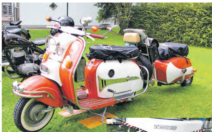
Jedes Detail hatte seinen Reiz.

Eines der auffälligsten Zweiradfahrzeuge beim Oldtimertreffen des MSC Sernatingen in Ludwigshafen war die Diana T5 von Dürkopp, ein Motorroller mit einachsiger Campinganhänger. sub-Bilder: wh