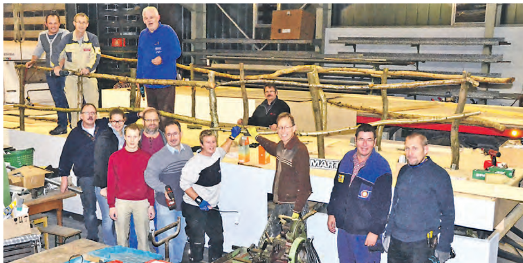
Für den großen Festumzug anlässlich 700 Jahre Schlacht am Morgarten sind die Wagenbauer aktiv. Denn am Sonntag, 1. Februar, sollen fünf Motivwagen mitfahren.

Stockach (stm). Wenn sich anlässlich des Jubiläums »700 Jahre Schlacht am Morgarten« am Sonntag, 1. Februar, wohl mehr als 3.000 Teilnehmer beim großen Festumzug durch Stockachs Straßen schlängeln, werden die Besucher aus nah und fern auch fünf Festwagen bestaunen können. Die Motivwagen werden einen Streifzug durch die Geschichte des Narrengerichts darstellen, wie der für den Wagenbau mit zuständige Helmut Lempp erklärte. In den Hallen der Firma Lempp sind deshalb seit vier Wochen jeden Mittwochabend gut ein Dutzend freiwillige Helfer am Sägen, Hämmern und Pinseln. Vor allem Styropor und Holz werden verarbeitet, glücklicherweise seien auch noch Überbleibsel früherer Umzüge gerettet worden, erklärt Lempp. Denn die Vorbereitungen für den großen Festumzug sind angelaufen und müssen, so die Planung, wohl weiter intensiviert werden, damit die Festwagen noch in diesem Jahr fertig werden. Nachdem die Wagen-