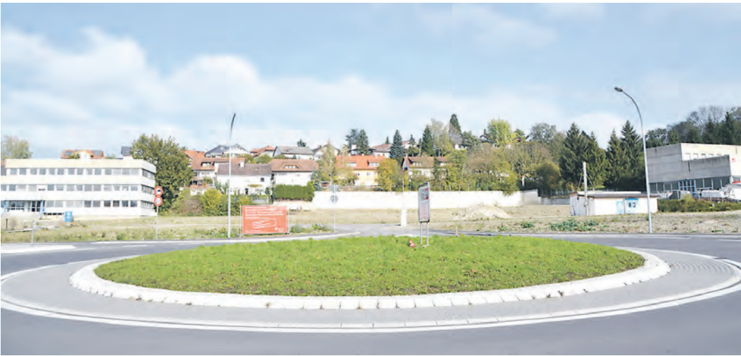
Ein Kreisverkehr wurde bereits errichtet. Nun soll das ehemalige »Contraves-Areal« an der Winterspürer Straße weiter ausgebaut werden - etwa durch den Neubau eines Pflegeheims.