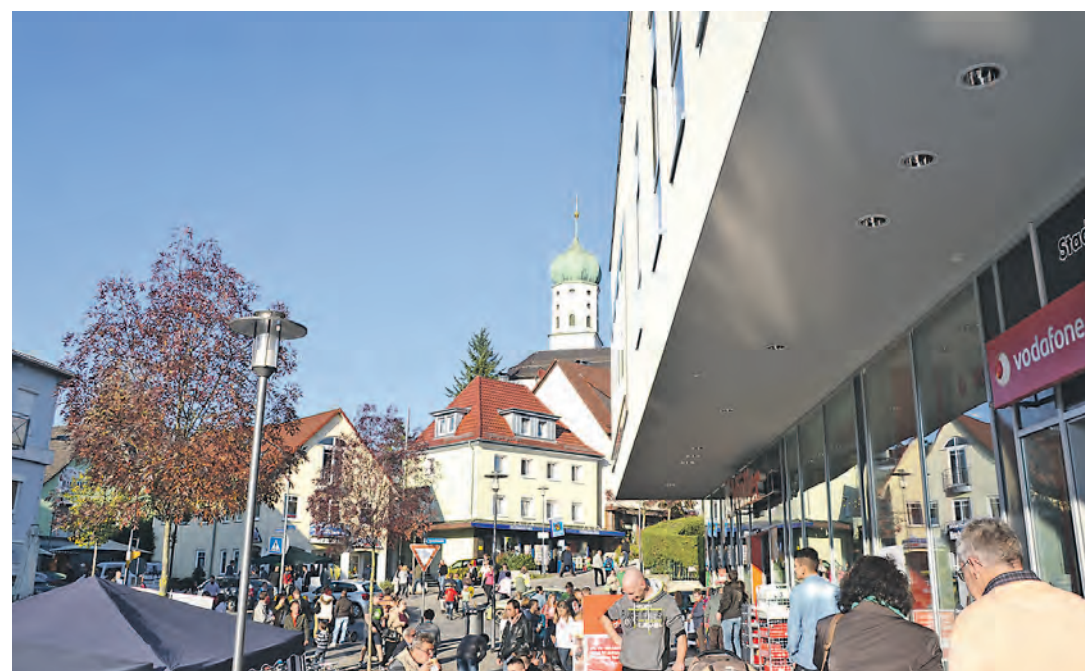
Strahlender Sonnenschein sorgte für strahlende Besucher beim verkaufsoffenen Sonntag mit Apfeltag in Stockach. Durch Ober- und Unterstadt drängten sich die Gäste. sub-Bilder: sw