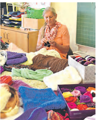
Viel gab es beim Kreativmarkt in Stockach zu sehen.

Stockach (sw). Hobbykunstausstellung war gestern. Heute gibt es den Kreativmarkt. Unter diesem neuen, griffigen Titel stellten Maler, Bastler, Kunst-