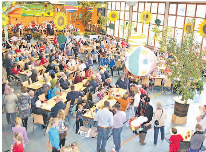
Die sechste Jahreszeit nach der Fasnet – das Mostfest in der Kirnberghalle in Orsingen.

Diese Szenerie bildete die ideale Kulisse, den idealen Hintergrund, die ideale Umgebung für ein absolut gelungenes Fest. Dünnele verschiedenster Geschmacksrichtungen wurden schmackhaft serviert, zur Ergänzung gab es Wurstsalat –