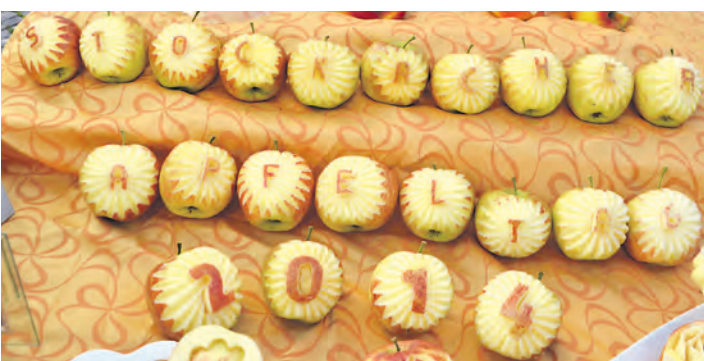
Schon die Begrüßung war fruchtig: Der Apfeltag mit verkaufsoffenem Sonntag in Stockach wurde in Äpfeln verewigt.