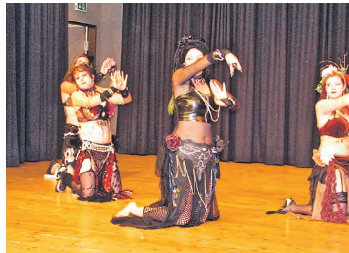
Farbenfroh, anmutig, graziös, eben »kulturbunt«, war der Interkulturelle Tag in Stockach.