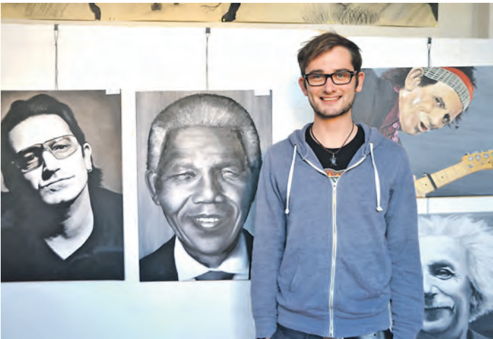
Fotos? Nein. Das waren messerscharf gemalte Kunstwerke von Jan Bechler.