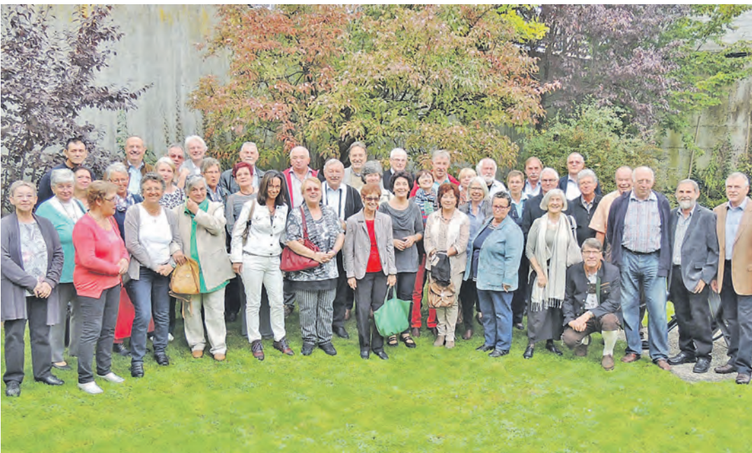
Der Einschulungsjahrgang 1956 der Volksschule Stockach kam zum Klassentreffen zusammen und beim Zusammenkommen wurde auch in Erinnerungen geschwelgt.

Stimmung, ehe der Kabarett-Winter am 27. März mit Markus Barths »Mitte 30 und noch nicht mal auferstanden« in den Endspurt geht. Im Kabarettwinter 2015 finden acht Veranstaltungen statt, davon sieben im Kleinen Saal und der TopAct »Ingo Appelt« am Donnerstag, 19. März im Großen Saal des Milchwerks Radolfzell. Für alle Vorstellungen werden Platzkarten ausgegeben. Beginn ist jeweils um 20 Uhr (Einlass um 19.15 Uhr). Tickets sind erhältlich in der Tourismus- und Stadtmarketing Radolfzell GmbH, Tel.: 07732/81 500 sowie über alle Reservix-Vorverkaufsstellen oder über www.reservix.de . Programmflyer erhalten Sie auch in der Tourismus- und Stadtmarketing Radolfzell GmbH sowie im Rathaus oder unter www.radolfzell.de/kabarett-winter .