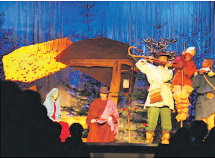
Das Oberuferer Christgeburtsspiel wird zweimal in Wahlwies gezeigt.