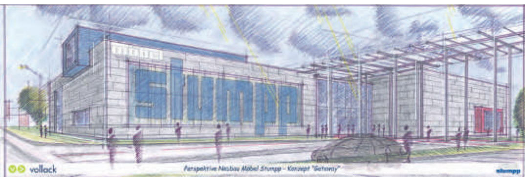
So soll es aussehen, wenn im Herbst alles fertig gestellt ist: »Gateway« nennt Möbel Stumpp in Stockach sein ehrgeiziges Bauvorhaben.