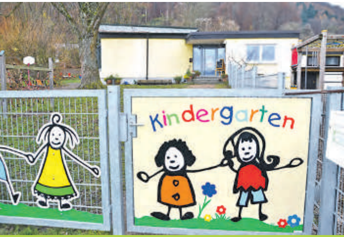
Der Kindergarten »Casa dei Bambini« in Bodman hat einen Anbau erhalten und wurde im Altbestand saniert.