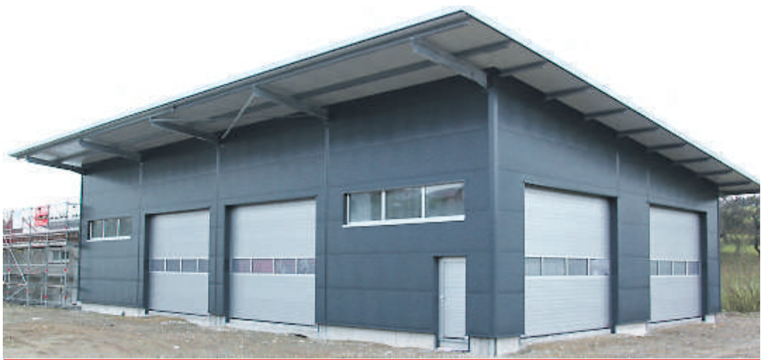
In dem Neubau an der Hauptstraße 1 in Mühlingen werden der örtliche Bauhof mit seinen großen Fahrzeugen, der Musikverein Mühlingen sowie die Musikschule Mühlingen-Zoznegg untergebracht.

gleichsstock hat Mühlingen Unterstützung in Höhe von 200.000 Euro erhalten. Mit dem neuen etwa 40