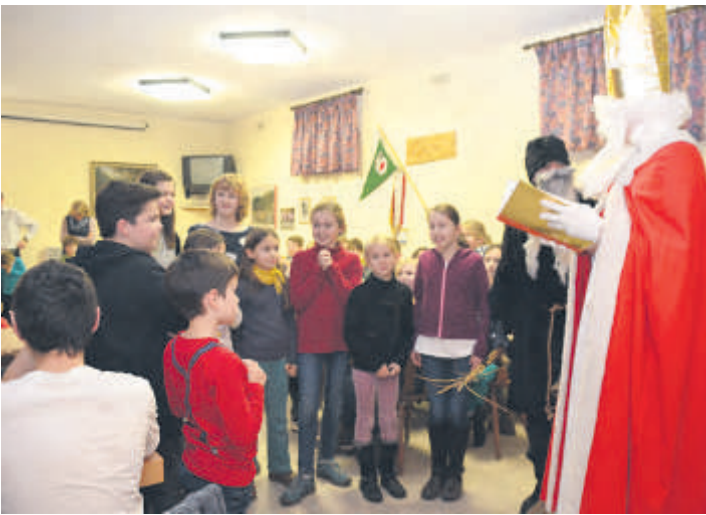
Nach dem Vorspielnachmittag im Bürgerhaus »Adler Post« erhielten die Kinder und Jugendlichen der Musikschule Besuch vom Nikolaus und seinem Gehilfen.