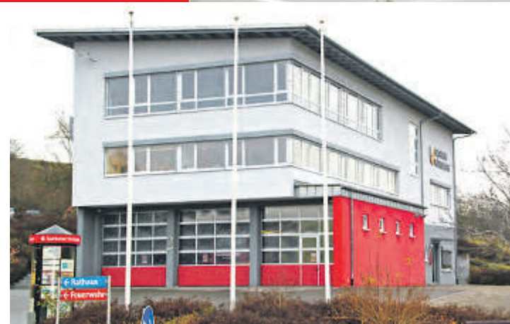
Das neue Bauhofgebäude in Mühlingen besticht auch durch seine zentrale Lage in unmittelbarer Nähe von Rathaus (unser Foto) und Feuerwehr. Im Frühjahr 2014 war mit den Bauarbeiten begonnen worden.