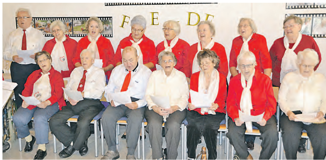
Schwungvolles Jubiläum: Der AWO-Sponti-Seniorenchor aus Radolfzell sang angesichts des 30-jährigen Jubiläums des Mobilien Sozialen Dienstes.

Karten für die Jubiläumsveranstaltungen gibt es unter www.tickets.wochenblatt.net . Mehr Infos zur Bauernkapelle unter www.bauernkapelle.de .