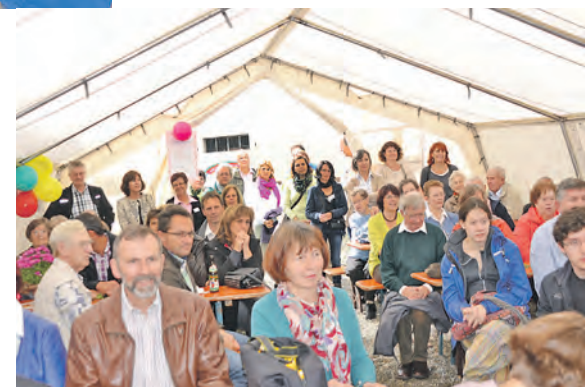
Einjähriges Bestehen gefeiert: Das Kinderhaus Bodensee in Mindersdorf kümmert sich um Kinder aus schwierigsten Familienverhältnissen.