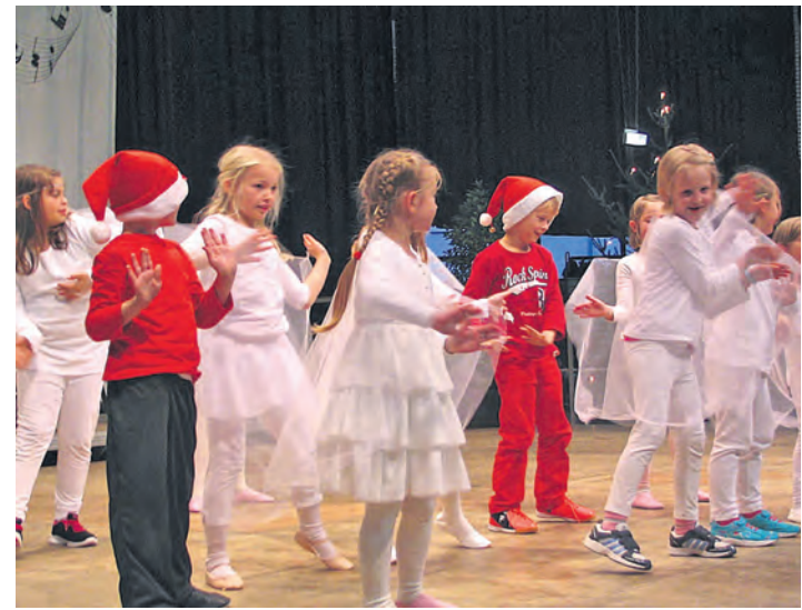
Ein unterhaltsames Programm gab es beim Seniorenachmittag der Stadt Stockach in der Jahnhalle.