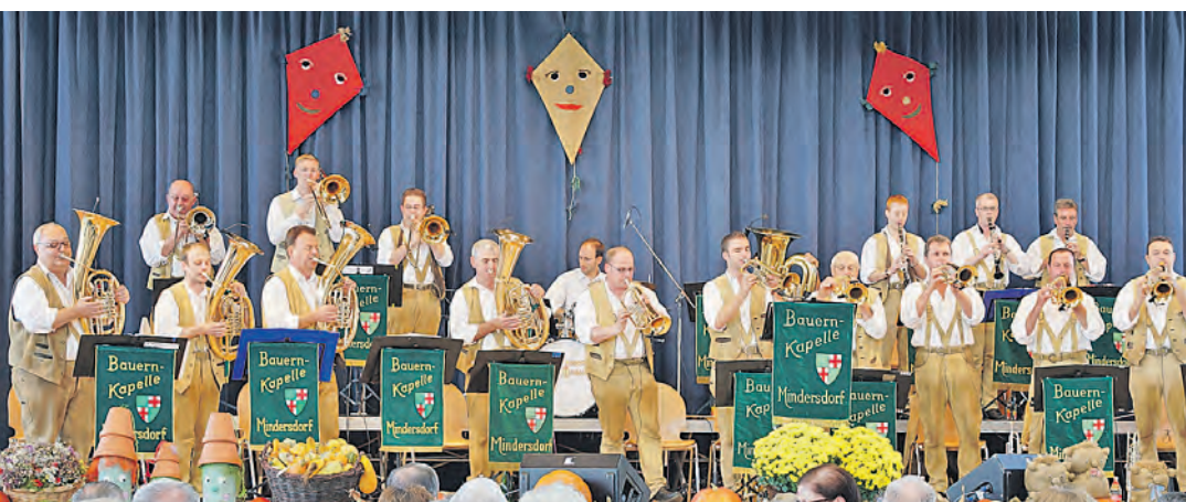
Seit 50 Jahren ein Renner - die Bauernkapelle Mindersdorf.

Ob mit dem Handstandüberschlag, dem Salto auf der Bodenmatte, den Schwüngen und Grätschen an Pferd und Pilz, dem Spagat oder der Laufkippe am Reck, dem Salto auf dem Trampolin oder den gewagten Überschlägen auf dem Schwebelbalken oder den gymnastisch-sportlich-künstlerisch anspruchsvollen Darbietungen der Aerobic- oder Tanzgruppen - die Turnschau war abwechslungsreich und anspruchsvoll. Und die »Nellis« vom »Nellenburg-Gymnasium« gehören einfach dazu, schon personell und ortsverbunden, und sie sind gut. Und dass sich der Nikolaus mit seinem Ruprecht und den rotbemühten Wichteln mit Süßigkeiten und manch mahndem Wort viel Zeit für die Jüngsten nahm, wen wundert's. Und so glänzend, feurig, farbenfroh und fröhlich tritt James Bond nur in der Heidenfelshalle auf. Mein Name ist Jahn – TV Jahn 08 Zizenhausen.