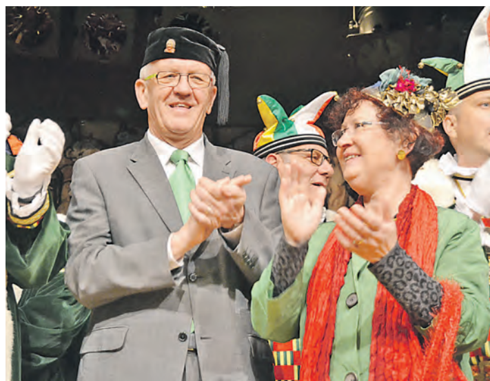
Gleich zweimal kam der Landesvater 2014 nach Stockach: Ministerpräsident Winfried Kretschmann von den »Grünen« war am »Schmutzigen Dunschdig« (unser Foto mit Ehefrau Gerlinde) der Beklagte vor dem Stockacher Narrengericht gewesen. Seine Weinstrafe hatte er dann im Juni beim »Schweizer Feiertag« eingelöst.