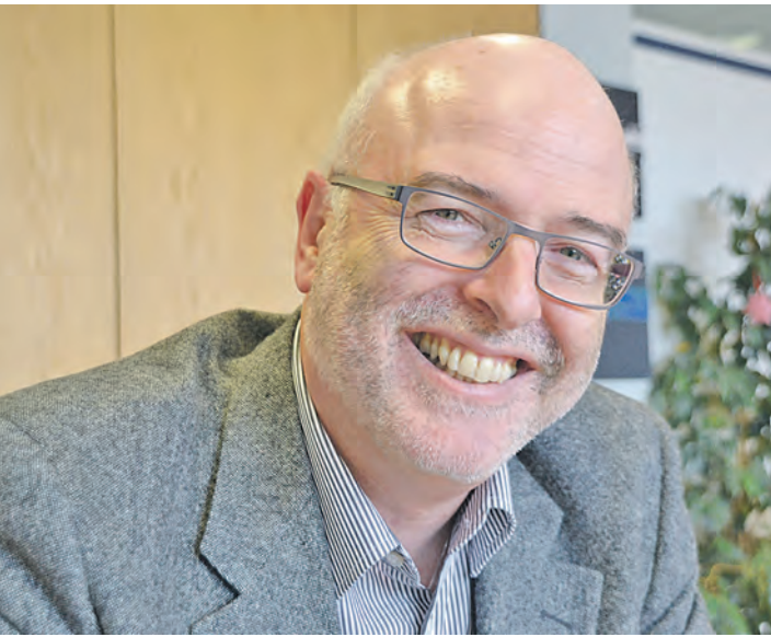
Stockachs Bürgermeister Rainer Stolz äußerte sich im WOCHENBLATT-Interview zu aktuellen kommunalpolitischen Fragen.