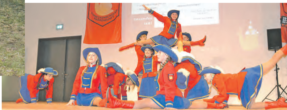
Brauchtum traf auf Moderne: Die »Schneckenbürgler« aus Zoznegg begingen ihren 50. Geburtstag mit einer rundum gelungenen Feier.