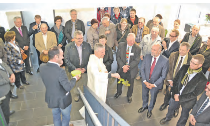
Er beackert ein weites Feld - der Badische Landwirtschaftliche Hauptverband (BLHV). Diese Aufgaben erfüllen die Mitarbeiter nun am neuen Standort: Anfang November wurde die Einweihung der neuen Bezirksgeschäftsstelle im Gewerbegebiet »Blumhof« zwischen Stockach und Ludwigshafen gefeiert.