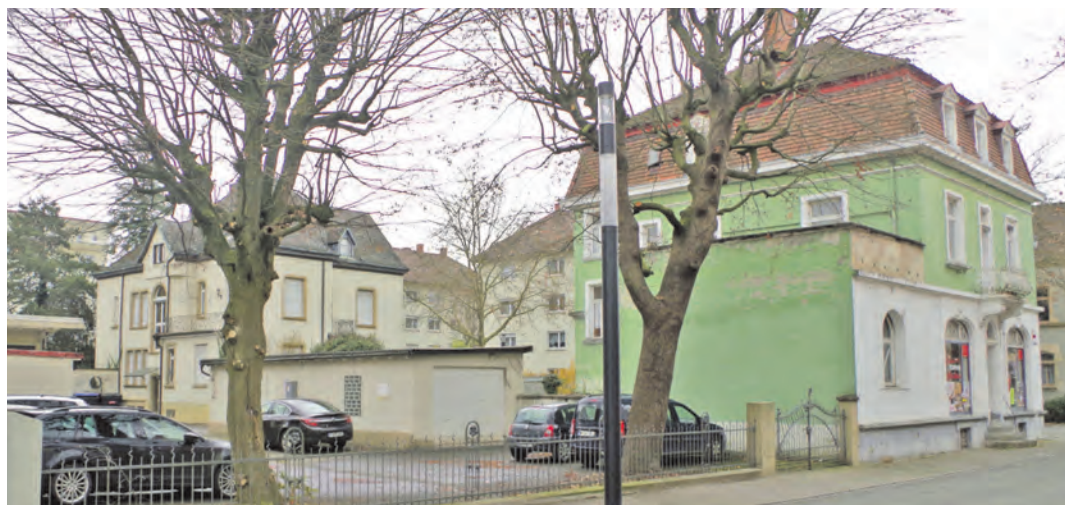
So wechselvoll kann ein Jahr sein. Das an die Stadt Singen vererbte Areal der Wetzstein-Villa in der Singener Innenstadt sollte eigentlich zur Öko-Siedlung für junge Familien umgestaltet werden. Der Plan scheiterte nach dem Realisierungswettbewerb mangels Bauträger. Zwischenzeitlich sollte dort das Projekt »Time out School« des Vereins »Menschen helfen« unterkommen, was durch einen Wasserschaden verhindert wurde. Jetzt bietet die Stadt Singen das Areal einer ökumenischen Interessengemeinschaft zum Bau eines stationären Hospiz an. Ganz am Anfang der Planungen sollte die Villa (links hinten) übrigens mal Quartier-, Senioren- oder Familienzentrums werden. Das »Grüne Haus«