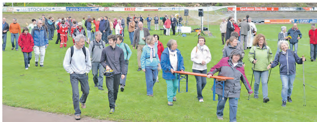
Das Lächeln der Solidarität gegen die schreckliche Fratze des Hungers: Im Mai bekundeten zahlreiche Teilnehmer beim ersten Stockacher Hungermarsch ihre Solidarität mit den leidenden Menschen der Welt. Über 5.000 Euro kamen dabei für Hilfsprojekte zusammen.