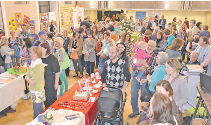
Stockach wurde zur Messestadt: Am Freitag, 21. März, ging die erste Sozialmesse im Bürgerhaus »Adler Post« über die Bühne.