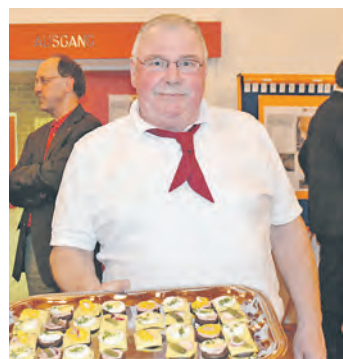
Eine gelungene Premiere: Die Kolpingsfamilie Stockach organisierte einen Neujahrsempfang - auch mit Kulinarischem.