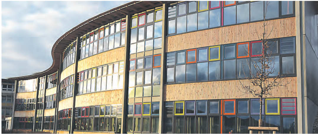
Für neue PCs und eine Theater-Licht- und -Bühnentechnik wollte das Gymnasium einen Budgetvorgriff.