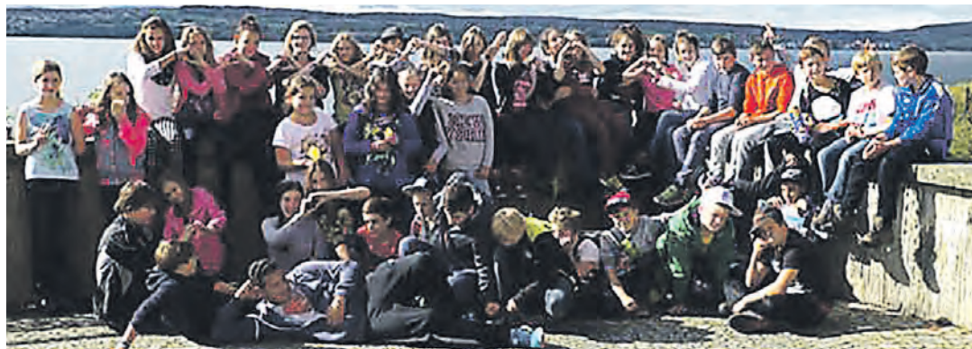
Ein Herz für Sierra Leone bewiesen die Schüler der Jahrgangsstufe 6 der Gemeinschaftsschule Eigeltingen durch ihren Einsatz.

sowohl als Klavier wie auch als Orgel spielbar«, verrät der Presetext. Die Klangmöglichkeiten des Instruments können durch zusätzliche Einstellungen noch erweitert werden. Das E-Piano wird bei den regelmäßigen Gottesdiensten im Seniorenheim und bei Veranstaltungen für die Bewohner zum Einsatz kommen. Zudem dient es der Förderung der Gemeinschaft.