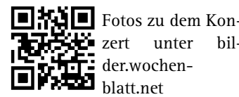
Fotos zu dem Konzert unter bilder.wochenblatt.net

haben dabei einen gewaltigen Nachklang: Der Erlös aus dem Konzert kommt den vier Jugendlichen im Alter zwischen 13 und 15 Jahren, die bei dem Brandwagen-Unglück von Mühlingen-Gallmannsweil verletzt wurden, und ihren Angehörigen zu Gute.