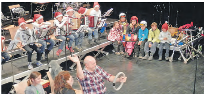
Richtig sportlich ging es beim Adventskonzert des Akkordeonspielrings Rielasingen zur.

Finanziell verfüge das Gymnasium über eine hervorragende Ausstattung. Konkret stehen ihm aus den Vorjahren noch Restmittel in Höhe von gut 53.000 Euro zur Verfügung, die zusammen mit dem Budget 2014 von 86.350 Euro insgesamt knapp 140.000 Euro betragen. Damit stünden dem Gymnasium aus Sicht der Verwaltung für 2014 mehr als ausreichend Finanzmittel zur Verfügung. Aus diesen Gründen beschloss der Gemeinderat einstimmig, den Antrag des Gymnasiums Engen auf einen Budgetvorgriff abzulehnen.