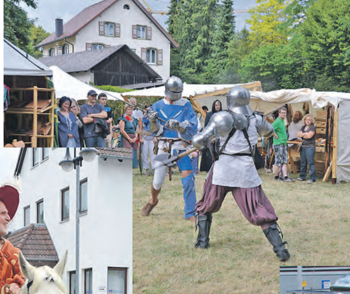
Eigeltingen ist eine Gemeinde mit Zukunft, aber auch mit einer großen Vergangenheit: Während des ganzen Jahres wurde das 1.250-jährige Ortsjubiläum begangen. Höhepunkt dabei war das Festwochenende mit Mittelaltermarkt am 28. und 29. Juni.