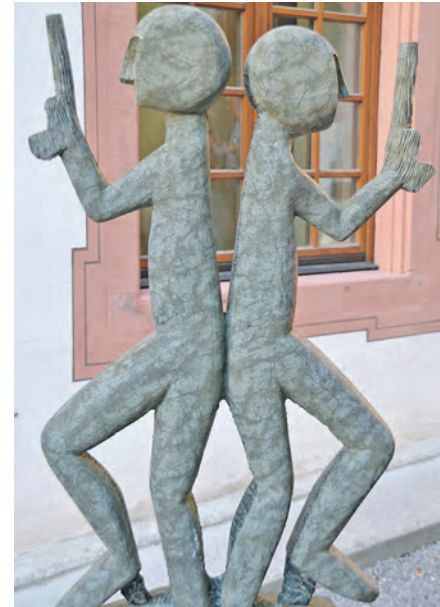
Künstlerisches Teamwork: Sieben Künstler aus Hohenfels zeigten im Vorhof des Schlosses Hohenfels in einer Gemeinschaftsausstellung ihr Können.