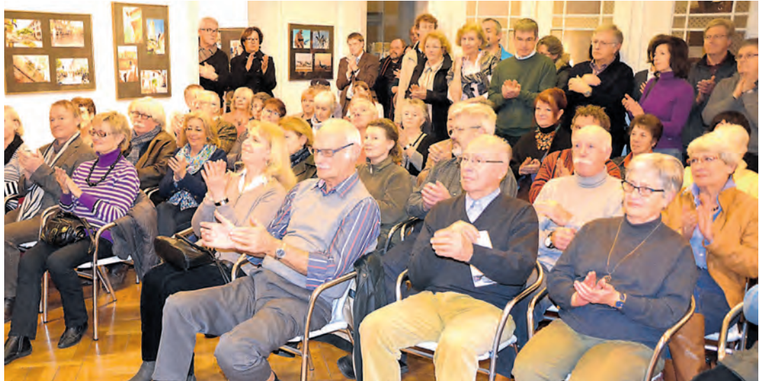
Zu Recht auf großes Interesse stieß die Vernissage zur Fotoausstellung »Blickpunkt auf 40 Jahre Freundschaft«, die am vergangenen Freitag in der »Villa Bosch« eröffnet wurde. Zu sehen sind rund 300 Bilder, die die Partnerschaft zwischen Istres und Radolfzell belegen.