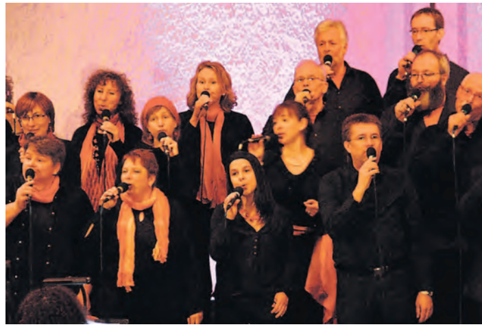
Der Gospelchor Voices-of-Joy gibt am Samstag, 15. Februar ein Konzert in der Engener Stadtkirche.

Die Gospelmesse »Gloria« umfasst elf Stücke und ist dem traditionellen Ablauf einer Messe nachempfunden. Die Texte werden weitestgehend in deutsch, teilweise auch in lateinisch und englisch gesungen und haben einen engen Bezug zu Stellen in der Bibel. Neben der musikalischen Darbietung durch die 35 Sängerinnen und Sänger sowie der fünfköpfigen Band, werden verschiedene Szenen auch darstellerisch auf-