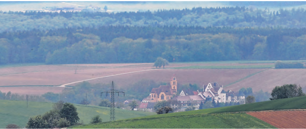
Kleinere Ortschaften wie Blumenfeld möchten die Vorteile der unechten Teilortswahl beibehalten.