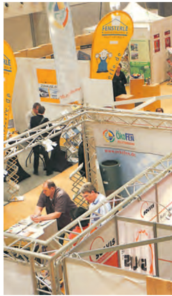
Zahlreiche Aussteller präsentierten sich über drei Tage bei der Bau-Messe im Radolfzeller Milchwerk.