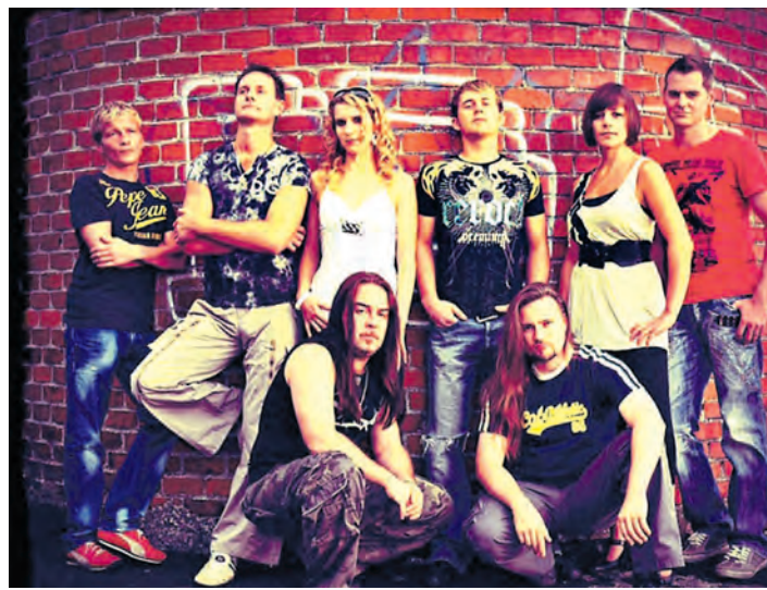
»Crash« heizen beim »Holzhauerball« in Hindelwangen ein.