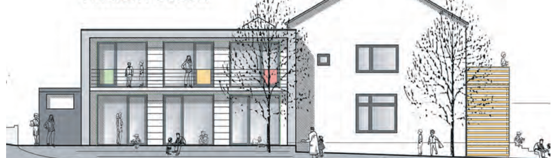
Die südliche Frontansicht der geplanten Kita in Tengen. Der moderne Anbau soll sich klar von dem bestehenden Gebäude abheben, ist die Intention von Architekt Rainer Wezstein.