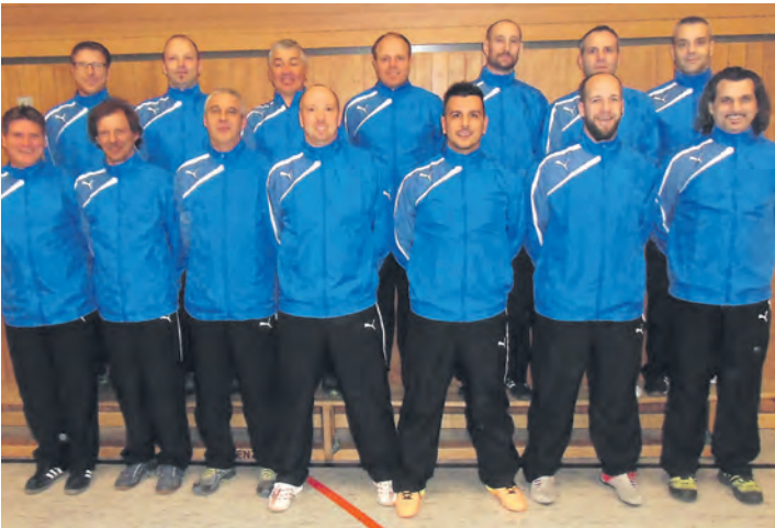
Die »Old Boys« des VfB Randegg mit ihrem neuen, einheitlichen Outfit.