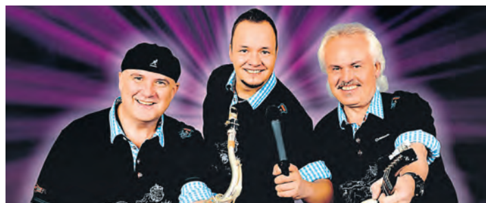
Die Partyband »Hautnah« wird am Freitag zum Jubiläumsabend der Hausener Reblauszunft die Tanzfläche in der Eichenhalle füllen.

Nähere Informationen unter 07731/822809-0.