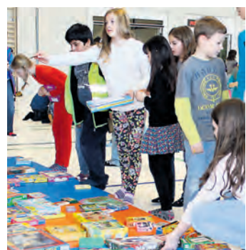
Ganz viele Spielsachen blieben bei der Börse der Diessenhofer Schulgemeinde für Kinder in Osteuropa übrig.

In der Aula des Schulhauses Zentrum boten rund 80 Kindergärtler und Erstklässler und in der Lettenhalle etwa 150 Zweit- bis Sechstklässler Spielsachen an. Sie breiteten ihre Schätze auf dem Boden aus, geordnet nach Themen wie Spiele, Plüschtiere oder Bücher. Die VSGDH hatte die Kinder eingeladen, für die Tauschbörse je zwei bis sechs Spielzeuge in die Schule zu bringen. Dort gaben die Lehrpersonen für je zwei gut erhaltene Tauschobjekte einen Bon ab, maximal deren drei pro Kind. Das Bonsystem, 1 Spielzeug für zwei, ergab, dass die Hälfte der etwa tau-