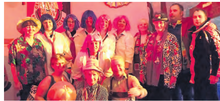
Bei der Fasnet in Ebringen gab es einen »Närrischen Kaffee«.

Riedheim (swb). Am Samstag, 15. März, findet von 9 bis 11 Uhr die nächste Börse für Kinderbekleidung und Zubehör in der Burghalle Riedheim statt. Verkauft werden nur saubere, modische und gut erhaltene Frühjahrs- und Sommerbekleidung Größe 50 bis 176, sowie Kinderwagen, Autositze, Umstandsmode und Spielzeuge. Die Annahme der Ware findet am Freitag, 14. März, von 15 bis 16 Uhr statt. Auszahlung und Rückgabe der nicht verkauften Artikel ist am Samstag von 16.30 bis 17 Uhr. Für Selbstanbieter findet der Aufbau am 15. März ab 8 Uhr statt. Zehn Prozent des Umsatzes fließen einem gemeinnützigen Zweck zu. Die Nummernvergabe ist unter Telefon 07739/ 926233 sowie Tischvergabe unter 07739/1552 möglich.