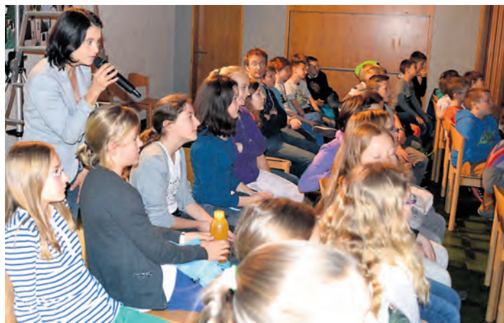
Über 100 Kinder hatten Spaß beim informativen Mitmachtheater »Q-Rage«.