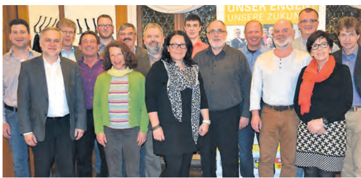
Die Kandidaten der UWV Engen freuen sich auf den vor ihnen liegenden Wahlkampf.

Seit 20 Jahren stellt die UWV die größte Fraktion im Engener Gemeinderat und hat so die positive Entwicklung der Stadt mitgestaltet. »Die vergangenen fünf Jahre waren für unsere Stadt sehr gut. Auf der Grundlage einer guten allgemeinen wirtschaftlichen Entwicklung