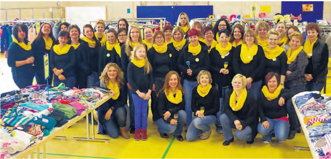
In Gelb und Schwarz, wie die Bienen, präsentierten sich die Helferinnen des Kinderkleidermarkts der Frauengemeinschaft St. Stephan zu ihrem Jubiläum am Samstag in der Worblinger Hardberghalle.