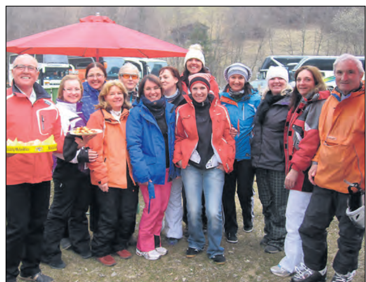
Der erste Lady-Day des Skiclubs Eigeltingen war ein voller Erfolg. Bereits um sechs Uhr startete der vollbepackte Bus in Richtung Silvretta Nova und versprach ein Skierlebnis allerersten Güte.

Anmeldungen für das Wildkräutermenü bitte direkt beim Hotel »Zum Goldenen Ochsen« unter Telefon 07771/91840. Informationen zum vielfältigen Programm des Umweltzentrums Stockach wie beispielsweise die Kräuterwanderungen in der Region gibt es unter www.uz-stockach.de .