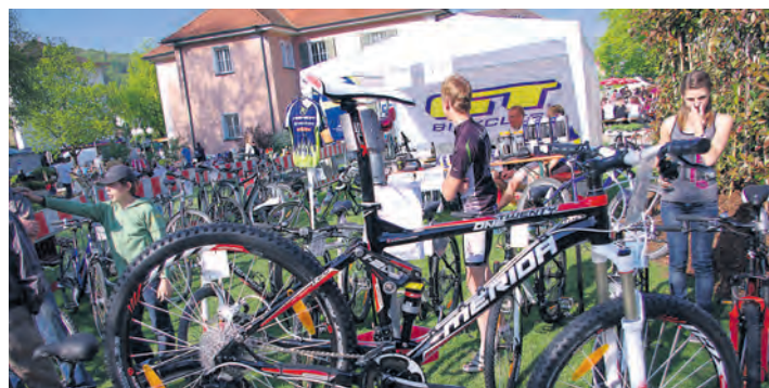
Auf zum Frühjahrsmarkt mit seinen bunten Angeboten heißt es am Wochenende in Gottmadingen.

Am Sonntag findet um 10.30 Uhr auf dem Parkplatz bei der Sparkasse ein Open-Air-Gottesdienst der Freien Evangeli-