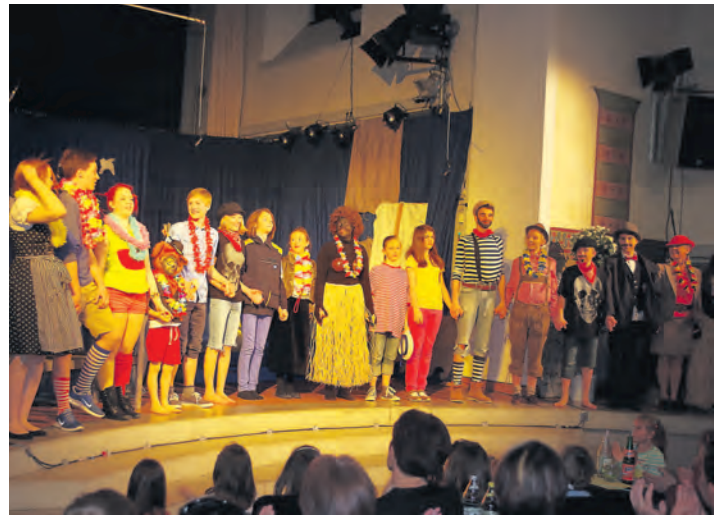
Langer Applaus war der Lohn für die mitreißende Aufführung von »Pippi im Taka-Tuka-Land« der Theatergruppe »Weltverdrehers« in Volkertshausen.