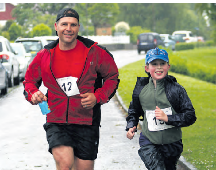
Am 24. Mai ist es wieder soweit: Der Gailinger Staffellauf geht in seine nächste Runde. Schon jetzt kann man sich für das Lauf-Event online unter www.staffeldwaldlauf.de anmelden.

dieser Strecke eine spezielle Wertung der einzelnen Klassen der Hochrheinschule statt. Für den diesjährigen Jubiläumslauf am Samstag, 24. Mai, haben die Verantwortlichen einen zusätzlichen Minisprint über 650 m erarbeitet. Hier soll auch für die Jüngsten ein sanfter Einstieg in den Laufsport ermöglicht werden. Was vor zehn Jahren aus dem Fitnessprogramm der Feuerwehren heraus entstand, ist inzwischen ein fester Bestandteil des Gailinger Veranstaltungsjahres geworden. Die Eingliederung des Staffeldwaldlaufs