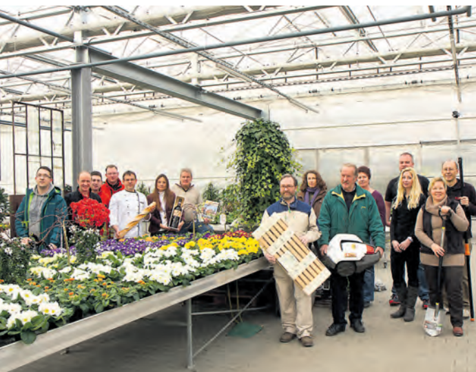
Die Inhaber der Altdorf-Geschäfte freuen sich auf ihre Gäste am Altdorf-Erlebnissonntag am 27. April und haben viel zu bieten.