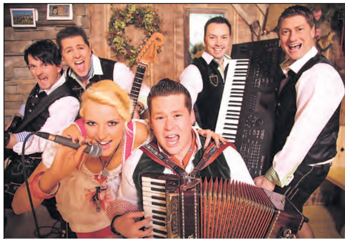
Am Mittwoch, 30. April, ab 19.00 Uhr, findet auch in diesem Jahr wieder die Maiparty der Heilsberghehexen in der Gottmadinger Fahrkantine statt. Die Partyband »Freibier« wird für eine Riesensparty sorgen. Der Vorverkauf findet beim Weinhaus Fahr in Gottmadingen statt. Infos unter www.Heilsberghehexen.de .

»Klein aber fein«, so lautet das Motto des Organisationskomitees und diesen Grundsatz soll man auch beim anstehenden Jubiläum erleben. »Ob neu gestalteter »runners heaven« im Zielbereich, in dem sich alle Teilnehmer/-innen nach dem Lauf kostenlos verpflegen können oder der neu entwickelte Minisprint – wir möchten den