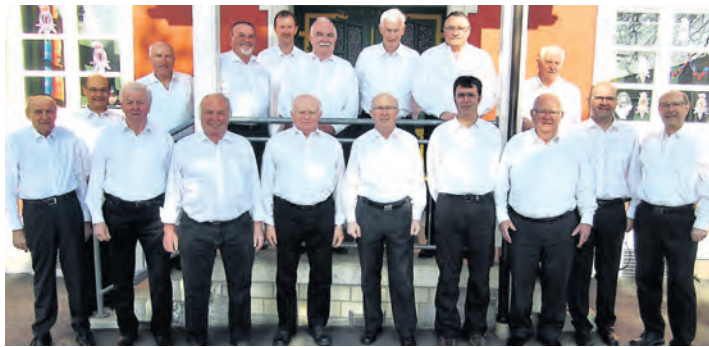
Der MGW Liederkranz Weiterdingen 1864 e.V. im 150. Jubiläumswort

Weiterdingen (swb). Der Männergesangsverein Liederkranz Weiterdingen 1864 e.V. feiert im Wonnemonat Mai, genauer am Wochenende des 24. und 25. Mai, sein 150-jähriges Jubiläum. Dazu wird am Samstagabend, 24. Mai, ein Festbankett stattfinden, an dem mit den befreundeten Gastchören MGW Riedheim, Männerchor Singen, Chorgemeinschaft Duchtlingen-Weiterdingen und mit Bläser-Ensembles des Musikvereins Weiterdingen die Festreden und Ehrungen musikalisch und gesanglich feierlich umrahmt werden. Der Sonntag steht ganz im Zeichen des Chorgesangs, beginnend mit einem Festgottesdienst in der Kirche St. Mauritius und dem Kirchenchor Hilzingen, anschließend ein Früh-