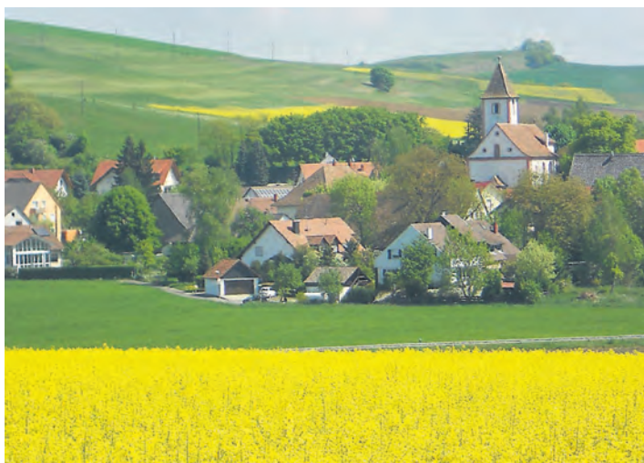
Duchtlingen ist bereits seit der Steinzeit besiedelt und hat eine ganz besondere Geschichte.

Duchtlingen (eg). Am ersten Maiwochenende ist es soweit: Als einer der ältesten Orte im Landkreis Konstanz überhaupt begeht vom 3. bis zum 4. Mai das 764 erstmals urkundlich erwähnte Duchtlingen seine 1250-Jahr-Feier. In der frühlinghaft dekorierten Turnhalle und einem Festzelt vor dem Feuerwehrgebäude werden Jung und Alt, alt eingesessene und neu hinzugezogene Duchtlinger ein Geburtstagsfest der besonderen Art feiern. Aber nicht nur dafür haben die Vereine und Einrichtungen vor Ort die Ärmel hoch gekrempelt, sondern auch eine Festschrift über den Hilzinger Ortsteil, der sich im achten Jahrhundert in Besitz des Klosters Sankt Gallen befand, erstellt. Viel später, nämlich 1806, kam Duchtlingen an Württemberg und 1810 an Baden. Bis 1857 dem Amt Blumenfeld unterstellt - der dortige Amtsphysicus attestierte den Duchtlingen übrigens, »häuslich, fleißig und schön« zu sein, gehörte der Ort bis 1936 zum Bezirksamt Engen und kam dann zum Bezirksamt beziehungsweise zum