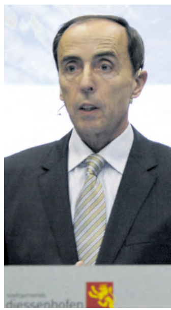
Stadtmann Sommer konnte bei der Rechnungsversammlung ein starkes Ergebnis präsentieren.

Die Erträge im Rechnungsjahr waren rund 700.000 Franken höher als im Vorjahr und eine Million höher als budgetiert. Dies ist auf den Verkauf einer Parzelle und einen höheren Anteil an kantonalen Grundstücksgewinnsteuern zurückzuführen. Die Mehreinnahmen ermöglichten Abschreibungen von 1,4 Millionen Franken bei Investitionen von netto rund 400.000 Franken. Daraus resultierte ein Finanzierungsüber-