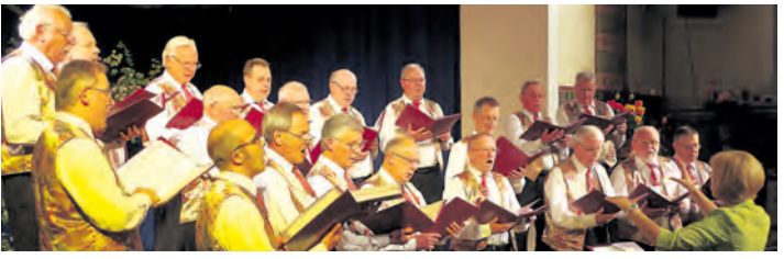
Mit viel Leidenschaft waren die Sänger des MGV Eintracht Volkertshausen bei ihrem Osterkonzert dabei.