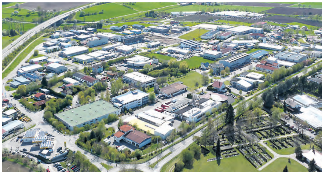
Das Gewerbegebiet Hilzingen ist am Sonntag, 11. Mai, eine informative Plattform für Gewerbe, Handel, Handwerk, Industrie und Dienstleistung.