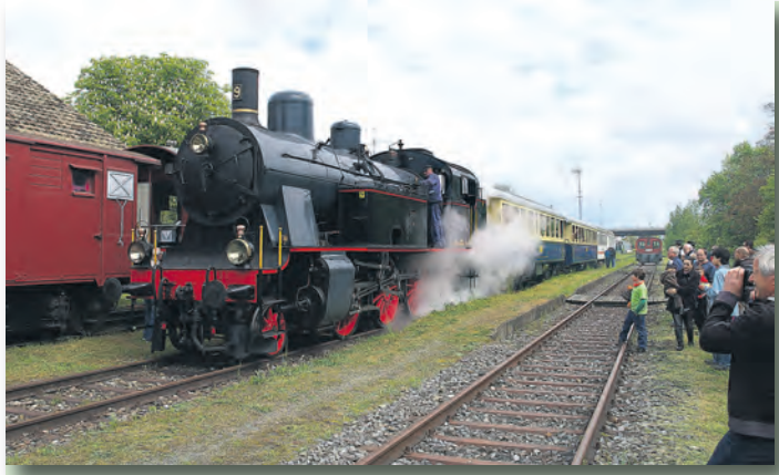
Eines der Highlights im Mai in Rielasingen-Worblingen ist das Museumsbahnfest am Samstag, 10. Mai, von 10 bis 19 Uhr mit drei Dampfaharten nach Stein am Rhein.

dafür im Vorverkauf in der Bücherei Rielasingen. Am Abend des selben 10. Mai lädt zudem der Instrumentalverein um 20 Uhr zu seinem großen Sinfoniekonzert in die Kirche St. Bartholomäus in Rielasingen ein. In der Hardberghalle Worblingen lädt dann der Handels- und Gewerbeverein Rielasingen-Worblingen am Samstag, 17. Mai, und Sonntag, 18. Mai, jeweils von 11 bis 17 Uhr zu seiner Gewerbechau »Industriefenster« in die Hardberghalle ein. Rund 50 Unternehmen aus dem Ort werden sich in und vor der Halle präsentieren und damit gemeinsam den höchst leistungsfähigen