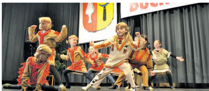
Die fetzigen Indianer vom TV Duchtlingen bekamen viel Beifall.