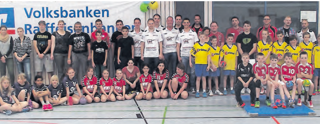
Einen ganzen Tag mit Sport und Spaß gab es in der Goldbühl-Halle bei der ersten Handball-Talentiade.