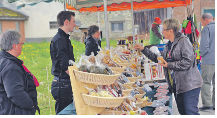
Sehr guten Anklang fand das diesjährige Spargelfest auf dem Hof Sätteli bei Ramsen. Viele Aktionen begleiteten den Anlass.