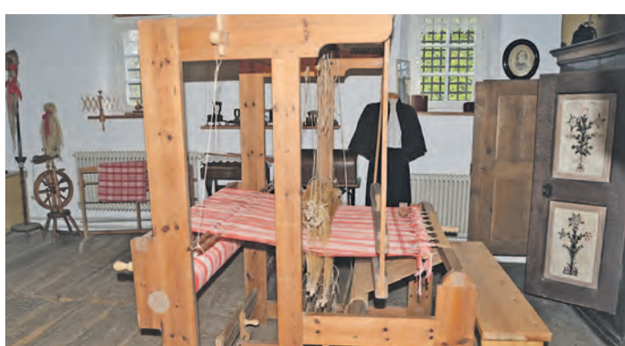
Der Webstuhl im Hilzinger Bauern- und Bürgermuseum ist wieder voll funktionstüchtig.

Jahr 764. Er war schon früh einer der wichtigsten Höfe der Gegend und wurde bereits vor über 1.000 Jahren als Kirchplatz erwähnt. Unter der Herrschaft der Herren von Krähen