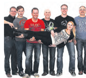
Mit der Band »Crossage« startet der Gottmadinger Kultursommer im Höhenfreibad am 27. Juni.

Gottmadingen (swb). Der Auftakt des Kultursommers im Gottmadinger Höhenfreibad startet nun am Freitag, 27. Juni, mit dem vom Förderverein des Höhenfreibades organisierten Konzert der Band »Crossage«. Fest gebucht sind auch die Filmbeiträge für die beiden Open-Air-Kinoabende im Höhenfreibad. Am Freitag, 4. Juli, erwartet das Publikum die Verfilmung des Romanbestsellers »Der Hundertjährige der aus dem Fenster stieg und verschwand«. Zum Auftakt der Sommerferien folgt am 31. Juli die Komödie »Fack Ju Göthe«. Doch zuerst wird am Freitag ab 20 Uhr im noch leeren 50-Meter-Becken des Höhenfreibades die siebenköpfige Band »Crossage« einheizen. Die Band vereint Vollblutmusiker unterschiedlichen Alters aus verschiedenen Jahrzehnten. Und dieses Thema zieht sich auch durch die Musik: Von den Beatles über U2 und Pink Floyd