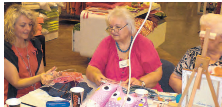
Häkeln, Stricken und Nähen für Kinder.

bevoll gefertigten Handarbeiten entstehen und anschließend wieder regional an die Tafeln übergeben werden.