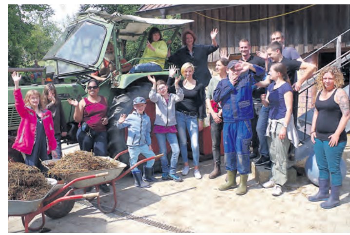
Stolz auf das vollbrachte Tagwerk: Schülerinnen und Schüler der Heimsonderschule Haus am Mühlbach zusammen mit Mitarbeitern von »Ernst & König« auf dem Hof »Heimatli« in Eckhardsbrunn im Rahmen des Projekts »Herzessache«.

Im Laufe dieses Jahres sind noch mehrere weitere Einsätze für die Heimsonderschule Haus am Mühlbach und das Projekt »Ene mene muh...« geplant.