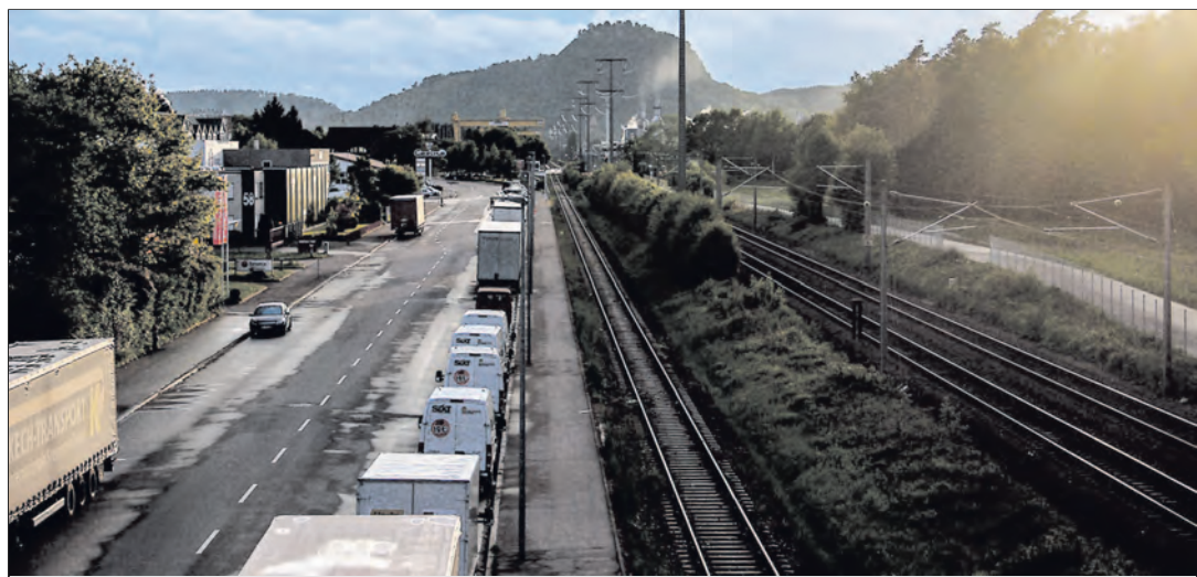
Die neue Brücke der Mittelspanne über die Bahn (im Bild die Aussicht von dort auf den Hohentwiel) soll »Südbrücke« heißen. Dafür entschied sich der Singener Gemeinderat per Wahl am Dienstag mit einer Mehrheit von 18 Stimmen. 8 Räte meinten, die Brücke bräuchte keinen Namen, eine Stimme bekamen Hontes- beziehungsweise Hohentwielbrücke. Die Namensfindung wurde vom WOCHENBLATT mit der IG Süd und der Stadtverwaltung initiiert. Insgesamt waren weit über 100 verschiedene Namen vorgeschlagen worden.

Das ganz große Programm mit den bewährten Bands und Akteuren läuft auf der Sparkassen-Bühne in der August-Ruf-Straße.