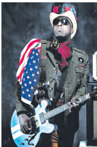
Lord Bishop dürfte am Freitag auf der Exil-Bühne im Rahmen des Singener Stadtfestes ordentlich abräumen.

Ein umfangreiches und eingespiltes Sicherheitskonzept sorgt ebenfalls für ein gutes Gefühl der Besucher. Die Tage sind gespickt mit At-