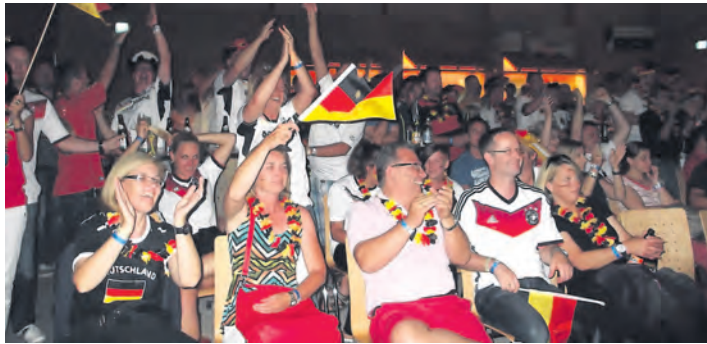
Gemeinsam jubeln macht Spaß: Fußball-Fans beim Public Viewing in der neuen Engener Stadthalle.

Ab 18.30 Uhr spielte die Reggae-Band Jahcoustix fetzige Rhythmen und hatte sogar einen Sänger aus Ghana mit dabei. Kurz vor Spielbeginn wur-