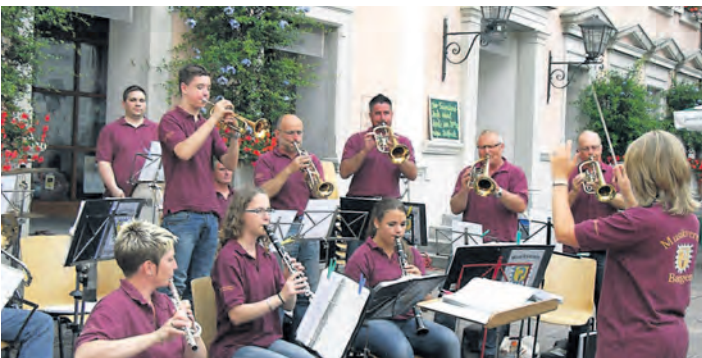
Am 3. Juli beginnen die beliebten Feierabendkonzerte auf dem idyllischen Marktplatz in Engen.

Im Saftladen von b.free gab es wieder leckere alkoholfreie Cocktails, die von der Anne-Frank-Realschule Engen serviert wurden. Die Bewirtung führte der Hegauer FV durch.