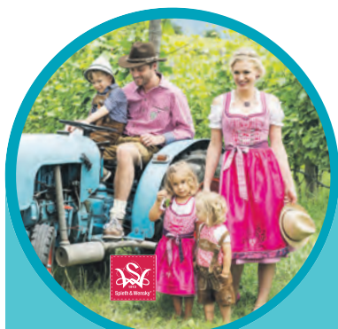
Trachtenmoden natürlich bei heikorn