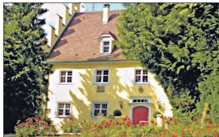
Sommerkonzert im Schlossgarten: Der Musikverein Bietingen lädt am Samstag, 12. Juli, zum Schlossgartenkonzert in den Garten des Bietinger Schlosses ein. Ein besonderer musikalischer Genuss für alle, die schon immer hinter die hohen Schlossmauern schauen wollten. Beginn ist ab 18 Uhr mit einem Apéro.

Bietingen (swb). Auch in diesem Jahr erwartet die Besucher des Sommerfestes des TV Bietingen ein buntes Programm. Am Sonntag, 13. Juli, um 9.30 Uhr treffen sich die Wanderer und Radfahrer an der Turnhalle. Ab 10.30 Uhr startet auf dem Sportplatz das Freizeit-Volleyball-Turnier unter Beteiligung der örtlichen und befreundeten Vereine. Über Mittag werden alle Beteiligten kulinarisch verwöhnt. Spiel und Spaß für Kinder stehen von 11 bis 16 Uhr auf dem Programm. Die Tanzgruppen »Honeymoons« und »Crazy Steppers« präsentieren sich um die Mittagszeit. Mit der Siegerehrung des Volleyball-Turniers geht das Sommerfest rechtzeitig zu Ende, damit jeder das WM-Endspiel ansehen kann. Bei Regen findet ein eingeschränktes Programm statt. Infos: www.tv-bietingen.de.