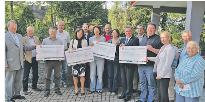
Die vier Vertreter der örtlichen Schulen mit ihren Fördervereinen konnten in Rielasingen durch die Bürgerstiftung im Rahmen ihrer Jahresausschüttung bedacht werden.

Singen/Rielasingen-Worblingen (ly). Nun kann der Bohlinger Aussichtsturm »Blattform« auch von den Bürgern aus Rielasingen-Worblingen bequem auf einem neu ausgebauten Verbindungsweg erreicht werden. Dies war wohl unter anderem auch ein Wunsch aus der Doppelgemeinde, die in ihrer Agenda verstärkt auf Tourismus setzt. Zur gemeinsamen Einweihungsfeier direkt an der Gemarkungsgrenze Bohlingen-Rielasingen-Worblingen trafen sich Singens OB Bernd Häusler, Bohlingens Ortsvorsteher Stefan Dunaiski sowie Ralf Baumert, Bürgermeister von Rielasingen-Worblingen, mit einigen Bürgern der zwei Gemeinden. Idyllisch verläuft dieser Weg inmitten satter Natur nebst grandiosen Ausblicken und der doch leider inzwischen selten zu hörenden Feldlerche. »Wir möchten die Wanderwege im Hegau stärken und somit auch die Region unterstützen. Jedoch statt Massentourismus setzen wir auf Qualität«, so OB Bernd Häusler. 25.000 Euro kostete der Verbindungsweg die Stadt Singen, 900 Tonnen Material wurden insgesamt für die 600 Meter lange Strecke verbaut, um den Verbindungsweg in zwei Wochen Bauzeit zu schließen.