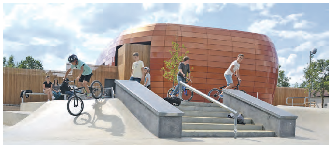
Die neue Skateranlage bei der Stadthalle wird von den Jugendlichen in Engen gerne und oft genutzt.

Auch die Platzprobleme im Jugendtreff »Milchhäusle« beschäftigen den Gemeinderat die letzten Jahre. Mehrere Alternativen wurden diskutiert und verworfen. Nun scheint das ideale Projekt gefunden: In den Räumen des katholischen Gemeindezentrums nahe dem Stadtgarten wird der Jugend-