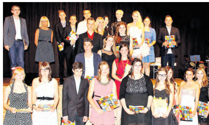
Ein starker Jahrgang mit 104 Schülern verließ die Anne-Frank-Realschule Engen.