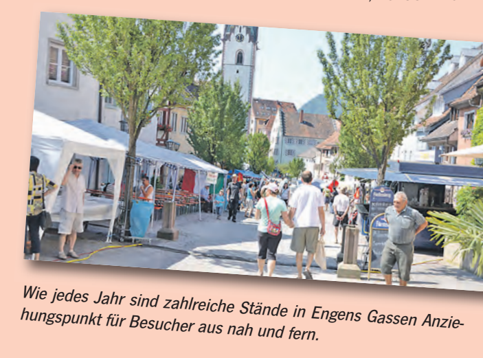
Wie jedes Jahr sind zahlreiche Stände in Engens Gassen Anziehungspunkt für Besucher aus nah und fern.