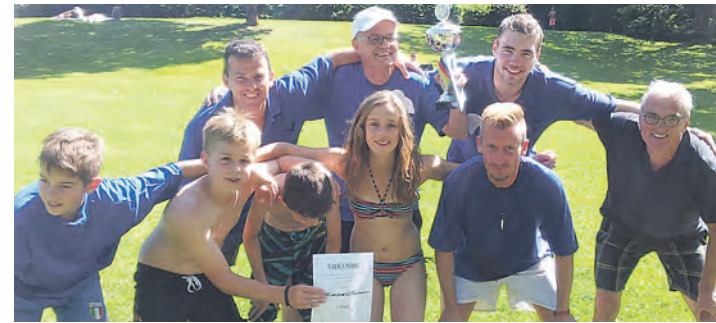
Beim Riesenkickerturnier im Höhenfreibad siegten die »Himmelstürmer« von der Freien Evangelischen Kirche Gottmadingen.

Der Randegger Ottilien Cup wird von Fr., 25.7., - Mo., 28.7., auf dem Sportplatz in Randegg ausgetragen.