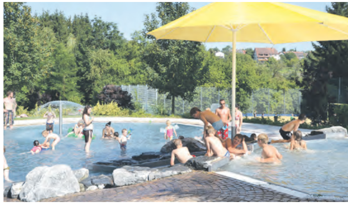
Die Sanierung des Engener Erlebnisbads im Eingangs- und Sanitätsbereich ist ab Herbst 2015 geplant.