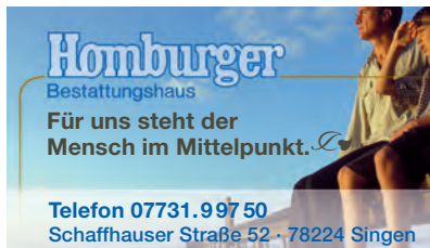
Telefon 07731.997 50 Schaffhauser Straße 52 - 78224 Singen