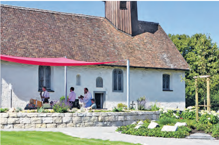
Eine gelungene Verbindung: Grabfeld vorne rechts, Sonnensegel und Friedhofskirche in Aach.