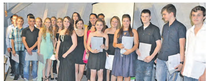
Alle 23 Neuntklässler können sich an der Werkrealschule Hilzingen über den bestandenen Hauptschulabschluss freuen.

Hilzingen (sam). Vergangene Woche wurden an der Werkrealschule Hilzingen 23 junge Menschen auf ihren weiteren Lebensweg »entlassen«. 19 von ihnen besuchen eine weiterführende Schule, zwei beginnen eine Berufsausbildung und zwei sind noch nicht sicher, wie es für sie weitergehen soll.