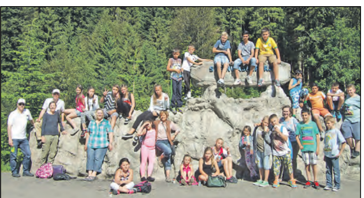
Viel Spaß bei traumhaftem Wetter hatten 24 Kinder aus dem Kinderhaus Langenrain, einer Einrichtung des Deutschen Kinderschutzbundes Singen-Hegau e.V., bei ihrem Ausflug in den Steinwasenpark. Der Ausflug wurde finanziert und begleitet vom Kiwanis Club Hegau und hat schon eine lange Tradition. Alle Betreuerinnen und Kinder sagen ein herzliches Dankeschön an den Kiwanis Club Hegau.