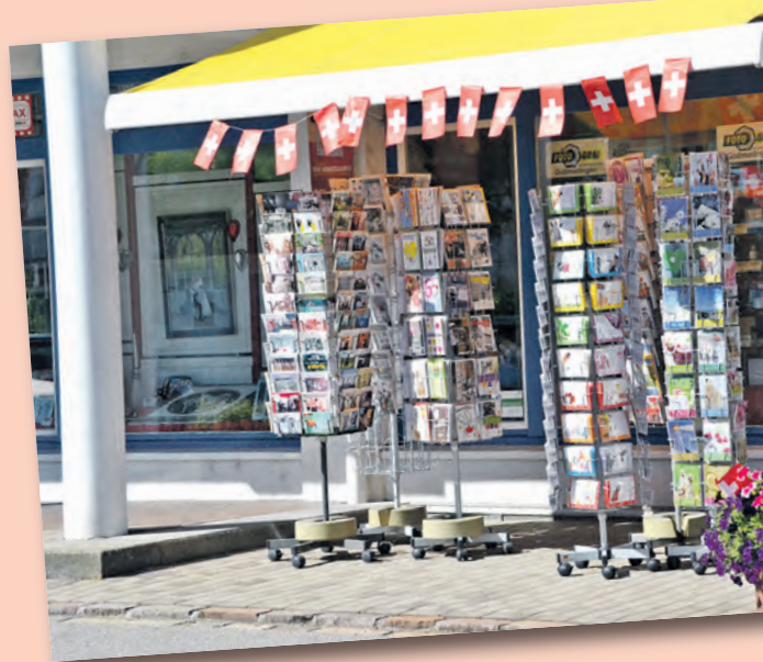
Die Gottmadinger Geschäfte heißen ihre Gäste mit passender Dekoration willkommen.