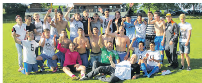
Ein stürmische Meisterfeier beging die A-Jugend der SG DJK/Margicos nach dem Aufstieg in die Landesliga.