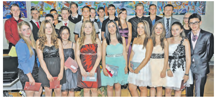
Die Preisträger des Jahrgangs 2014 der Zeppelin-Realschule stellen sich zum Abschluss ihrer Feier zum Gruppenbild auf.

am 24. Juni auch darüber beschwert, dass die Mitgesellschafter nicht über die Verkaufspläne informiert worden seien. Allerdings sei es in diesem Monat immer noch nicht möglich gewesen, Rücksprache mit einem Vertreter der auch als Gesellschafter vertretenen Metzger zu halten. Nun wurde der Beschluss gefasst, dass die GVV Singen zu einer Gesellschafterversammlung einladen soll, um ihre Anteile an der Kommanditgesellschaft von 77.500 Euro und dem Eigenkapital von 57.500 Euro allen Mitgesellschaftern anzubieten.