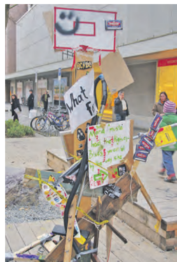
Geteilte Meinungen über die Hegastraße gab es schon immer. Die erste provisorische Umgestaltung wurde damals mit Müll-Kunst kommentiert.