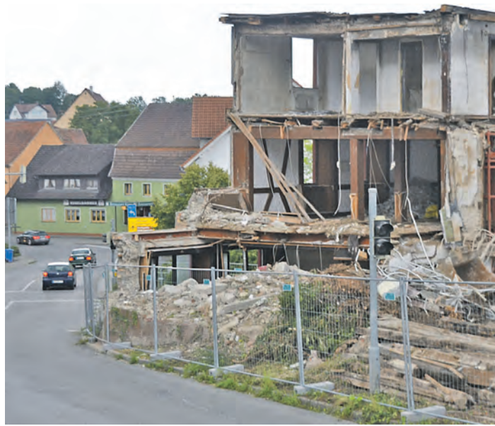
Das »Krone-Eck« soll entschärft werden.

Aach (mu). Zwei schwergewichtige Themen bekam der frisch konstituierte Aacher Gemeinderat bei seiner ersten Arbeitssitzung auf den Tisch: Vor vollen Zuhörerrängen wurde zum einen die Straßenplanung um das »Krone-Eck« und zum anderen der Entwurf für eine Seniorenwohnanlage und eine Pflegeeinrichtung an der E-Werk-Straße vorgestellt. »Jetzt geht's mit der Arbeit richtig los«, kündigte Bürgermeister Severin Graf an und versprach nicht zu viel. Nachdem das ehrwürdige Traditionsgasthaus »Krone« im November 2012 einem Brand zum Opfer fiel, erwarb die Stadt die Brandruine Ende vergangenen Jahres und entschied den Abriss des markanten Gebäudes, das lange Zeit das Ortsbild der Hegaustadt mitprägte. Durch eine Verbreiterung der Straße am »Krone-Eck« sollte das Nadelöhr am Ortseingang auf der Hauptstraße entschärft werden. Gleichzeitig soll dort aber keine Rennstrecke für Raser entste-