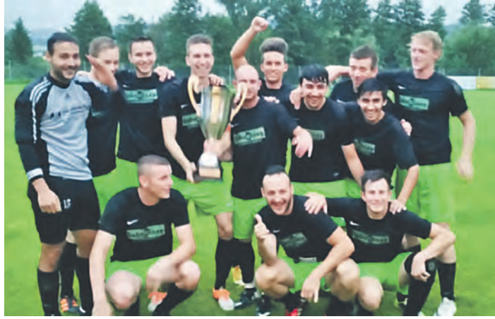
Die Siegermannschaft des BC Konstanz Egg jubelte in Randegg.

»Randegg«: Sa., 18.30 Uhr Eucharistiefeier am Vorabend.