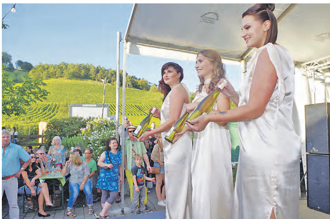
Direkt vor den Weinbergen des Weinguts Vollmayer präsentierten Models das aktuelle Weinsortiment vom Elisabethenberg mit gewagten Frisuren und Make-Ups - zur Freude des Publikums.

Am Ende belegten die Turnerinnen der TG Hegau-Bodensee (145,75) mit nur 0,55 Punkten Abstand den 2. Platz in der Gesamtwertung dieses Wettkampfs hinter der KuSG Leimen (146,30) und vor dem drittplatzierten TV Freiburgerherdern (144,55), die im kommenden Jahr ebenfalls in der Landesliga starten werden.