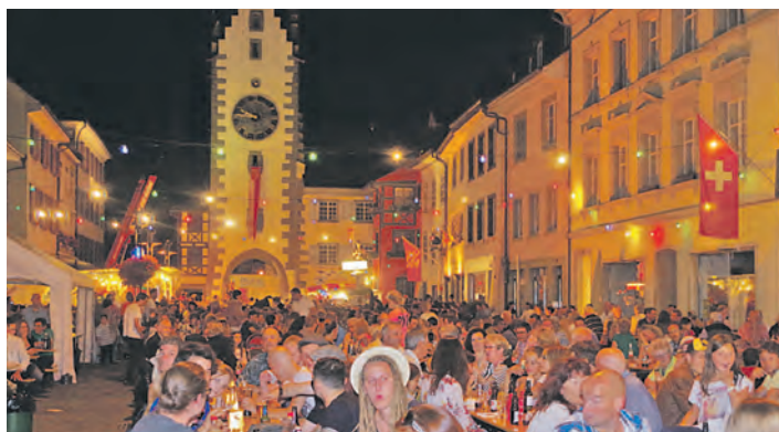
Zwei Tage feierte die Stadtmusik Diessenhofen ihr Altstadtfest und hatte mächtiges Wetterglück. Der Regen kam immer erst zum Feierabend. Mit »Koa Limit« aus dem Raum München gelang ein guter Coup, denn die Band sorgte vor über 1.000 Gästen für eine Riesenstimmung. Fotos unter bilder.wochenblatt.net

aus der Gruppe eine Weinflasche gegen die Heckscheibe des Pkw, wodurch diese zu Bruch ging. Der 21-Jährige stellte sein Fahrzeug ab und rannte mit seinen beiden Mitfahrern dem Flaschenwerfer hinterher. Vor einem Maisfeld kam es schließlich zu einer tätlichen Auseinandersetzung, bei der der 21-Jährige und der 31-Jährige sowie ein Unbeteiligter diverse Blessuren davontrugen.