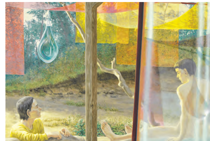
Simon Pasieka, Dritte Hand, Öl auf Leinwand, 2014