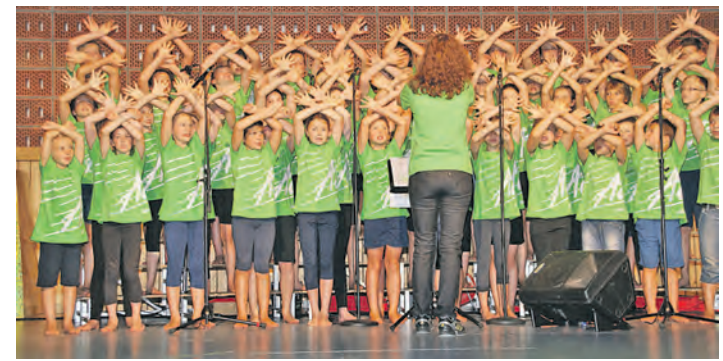
Der Adonia-Chor in Aktion.