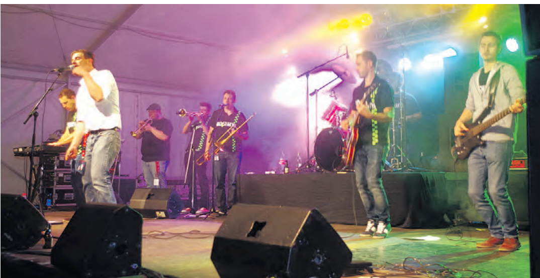
Die Nacht auf dem Arlener Oberholz-Sportplatz gehörte der Ska-Band »Bad Shakyn«, bei der kein Tanzbein ruhig bleiben konnte.