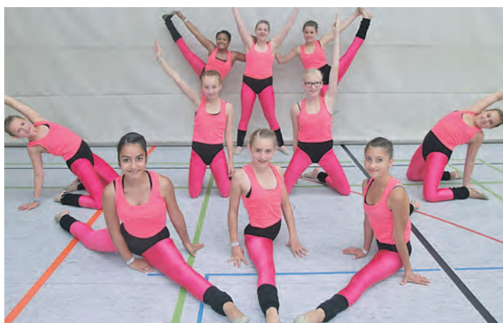
Die erfolgreichen Bambini-Girls des VfB Randegg.