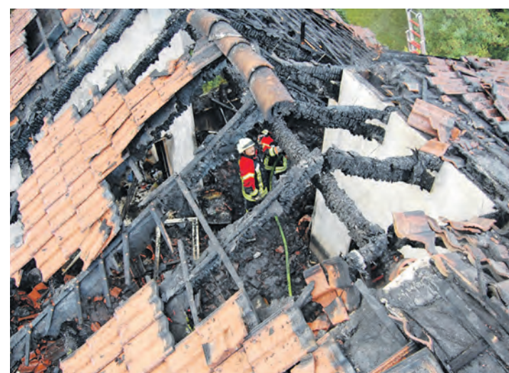
Der ausgebrannte Dachstuhl in Hilzingen.

Alle von der DLG ausgezeichneten Produkte werden auch im Internet unter www.DLG-Verbraucher.info aufgezeigt und veröffentlicht.