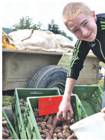
Kartoffeln in vielen Sorten und Größen gab es zu probieren und zu kaufen.