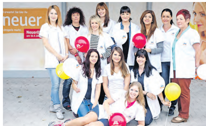
Die Mitarbeiter des neuen dm-Marktes in der Werner-von-Siemens-Straße 3 in Rielasingen-Worblingen freuen sich ab der Eröffnung am Donnerstag auf zahlreiche Kunden.

Zusätzlich zur Kassierstunde mit dem Rielasinger Stadtoberen haben die dm-Mitarbeiter viele weitere Aktionen in der