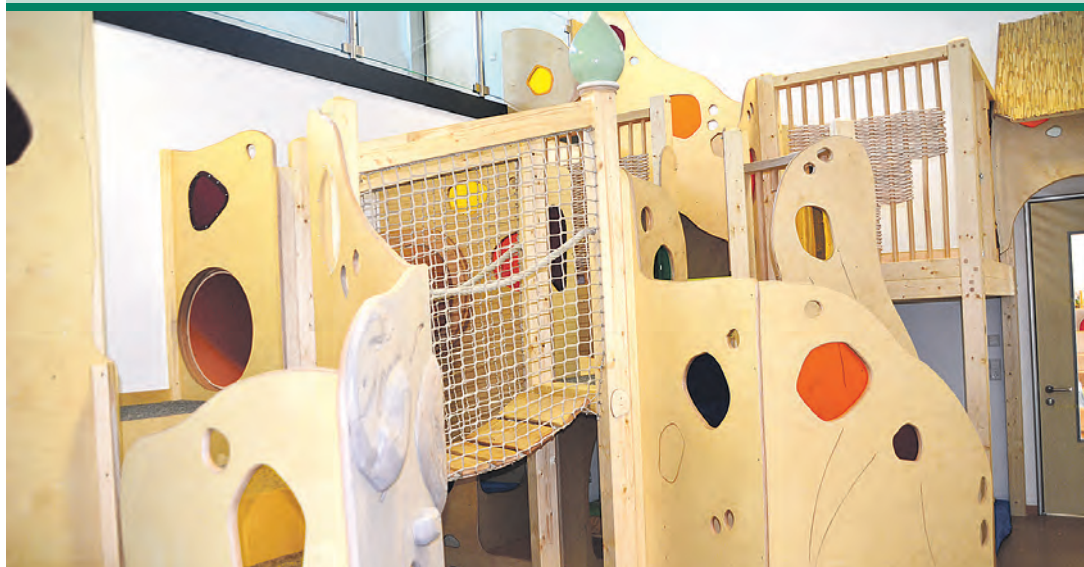
Die Konzeption der Kinderkrippe ist wohldurchdacht, beispielsweise bietet die Spiel- und Schlaflandschaft die optimale Mischung an Möglichkeiten für Rückzug und Spieldrang der Kleinsten.