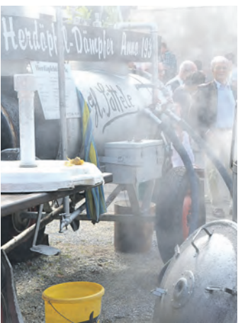
Lecker: Es gab Kartoffelgerichte in riesiger Vielfalt, wie hier gedämpft mit Fisch oder Dip.