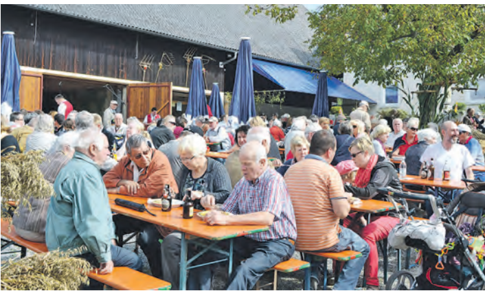
Die zahlreichen Besucher aus Nah und Fern hatten ihren Spaß und genossen die »tolle Knolle« beim Duchtlinger Hördöpfelfäscht. Schon gegen Mittag drängten sie sich dicht auf den Straßen. Mehr Bilder gibt es unter bilder.wochenblatt.net