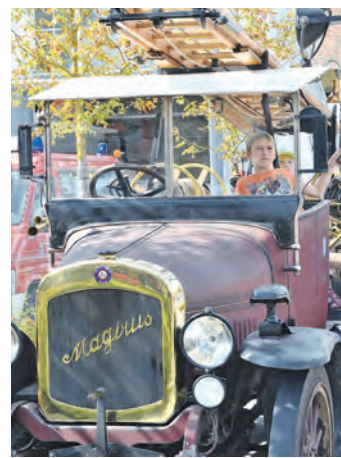
Jung und Alt hatten ihren Spaß mit den historischen Feuerwehrfahrzeugen.