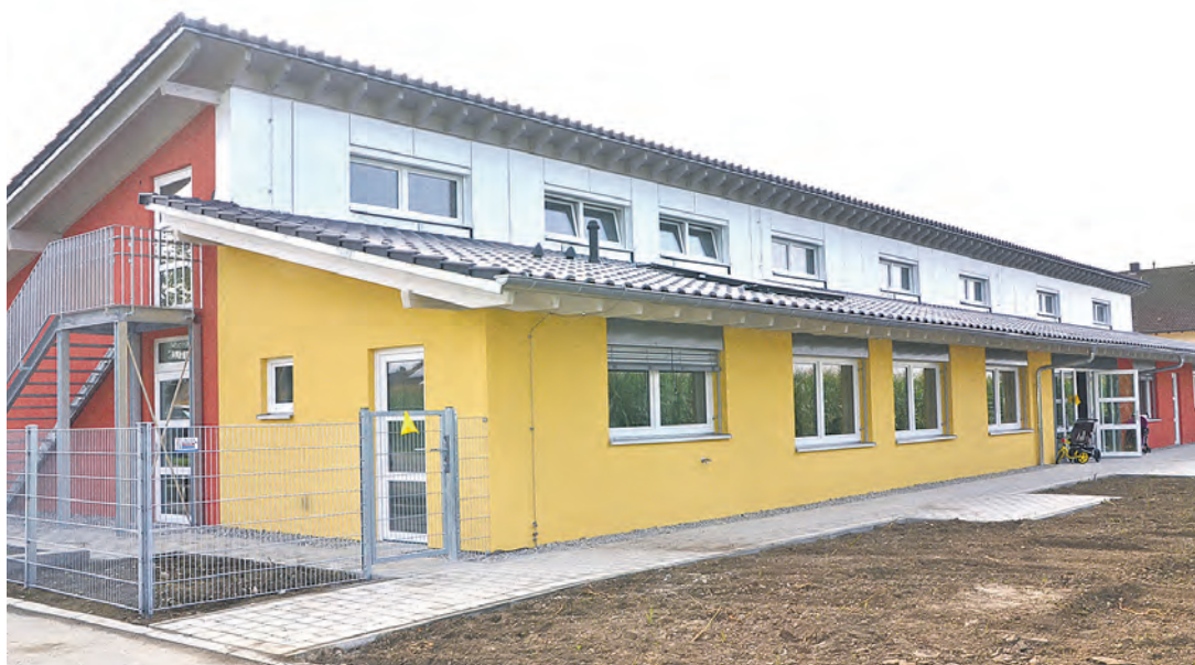
Die neu gebaute Kinderkrippe Rosenegg in unmittelbarer Nachbarschaft zum Kindergarten ist seit 1. September in Betrieb.