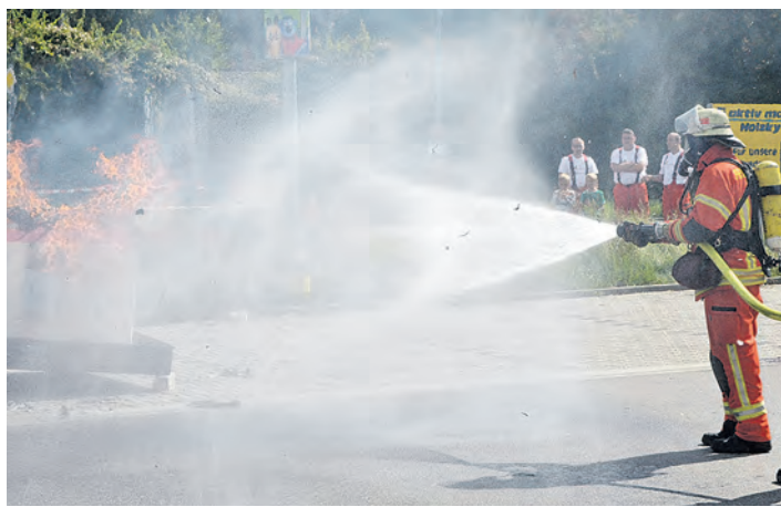
Löschen will gelernt sein: mit vielen Vorführungen zeigte die Engener Wehr beim Aktionstag, dass sie für nahezu alle Fälle bestens gerüstet ist.

Mädchen und zehn Knaben Mitglied in der Jugendfeuerwehr Engen. Das Eintrittsalter beträgt zehn Jahre. Begeisterte Jugendliche aus der Stadt und den Ortsteilen sind jederzeit willkommen. Mehr Bilder gibt es unter bilder.wochenblatt.net