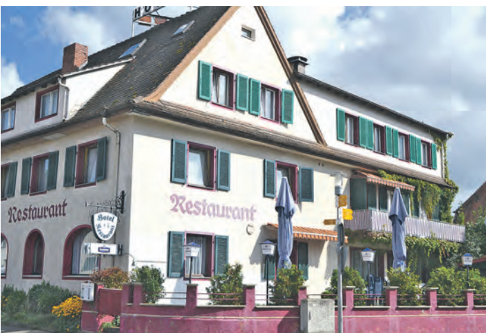
Im »Badischen Hof« werden wohl noch in diesem Jahr die Flüchtlinge eine neue temporäre Heimat finden.

In Bezug auf die Ankunft der Menschen in Engen setzt die Behörde auf einen Dialog mit den Nachbarn und eine offene Kommunikationspolitik. Genau die wurde aber von den Zuhörern kritisiert, denn die Stadt Engen wurde relativ spät von den Absichten des Landratsamtes in Kenntnis gesetzt. Abgesehen davon herrschte aber eine offene Stimmung und ein positiver Grundton gegenüber den baldigen Neuankömmlingen.