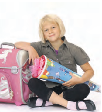
Eine Aktion für ABC-Schützen und ihre Eltern bietet das Singener Modehaus K&L Ruppert in der Singener August-Ruf-Straße noch bis 27. September an.