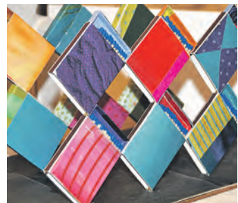
Kunst auf Streichholzschachteln für den guten Zweck.

Vom 20. September bis 2. November können Bilder und Videoinstallationen von Daniela Benz im Thaynger Kulturzentrum »Sternen« bewundert werden. Die Exposition ist jeweils Samstag/Sonntag von 13 bis 17 Uhr geöffnet. Danach stehen dringende Sanierungsarbeiten an. Die Vernissage findet am Samstag, 20. September, um 11 Uhr statt.