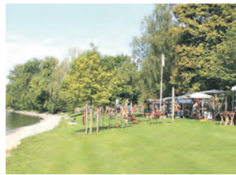
Der Gailingener Töpfer- und Keramikmarkt lockt die Besucher mit Handwerkskunst ans Rheinufer.

Gailingen (swb). Nach Saisonende lädt das wunderschöne Gelände am Rheinufer in Gailingen auch in diesem Jahr wieder zu einem Besuch des Töpfer- und Keramikmarktes ein. Rund 40 Aussteller aus dem gesamten Bundesgebiet präsentieren mittlerweile zum neunten Mal traditionelle und moderne Handwerkskunst vom Feinsten. Der feste Stamm langjähriger Aussteller wird auch heute wieder um einige neue Handwerker erweitert. In einer Zeit der Beliebigkeit und Massenproduktion findet der Besucher hier noch echte Qualität und Handarbeit aus kleinen Werkstätten und Familienbetrieben sowie freundliche und fachkundige Beratung in entspannter Atmosphäre. Das Angebot reicht von Gebrauchskeramik für den täglichen Einsatz über moderne Arbeiten, Schmuck aus Ton, feinem Porzellan oder die aus dem mittelalterlichen Japan stammende Raku-Brenntechnik bis hin zu