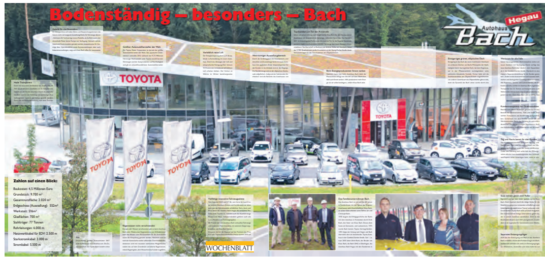
Das neue Autohaus Bach am Toyota-Kreisel. Ein erster Einblick in die umfassende Sonderbeilage, die in dieser Woche dem WOCHENBLATT beiliegt. Durch das neue Konzept enthält es alle notwendigen Informationen zu dem »nachhaltigen und architektonischen Highlight« am Tor der Singener Automeile auf einen Blick.

Ausgehend von der Toyota-Philosophie der Nachhaltigkeit ist die 77 Tonnen schwere Stahlkonstruktion mit Glasflächen von 700 Quadratmetern weit mehr als Verkaufsfläche der umweltverträglichsten Fahrzeugflotte. An einem Top-Standort in Singen ist das Autohaus viel mehr, indem es den modernsten Stand an Umweltverträglichkeit mit architektonischem Esprit vereint, gleichsam Sinnbild der Marke Bach, die zahlreiche Kunden in der