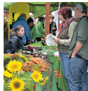
Eine bunte Palette an Herbstfreuden erwartete die Besucher des 22. Ökomarktes in Engen.

Anbietern von Naturprodukten waren auch zahlreiche Initiativen und Firmen aus dem Bereich Ökologie mit Beratungen und Produkten rund um Solarenergie, Wasseraufbereitung, Umweltschutz oder Heizung vertreten. Und natürlich kamen auch die Kinder nicht zu kurz: Einige Händler boten Bastel- oder Mitmachaktionen an. Die Zaubertöpferscheibe lud zum Mitmachen ein, beim Kinderschminken gab es tolle Ergebnisse und eine Luftballonkünstlerin verteilte kleine geknotete Kunstwerke. Auch Puppenspiel und Bastelaktionen wurden angeboten. Im Rathaus wartete eine große Obstausstellung mit Gewinnspiel. Beliebt, da freundlich, waren auch das Lama und das Alpaka aus Bittelbrunn, die zum ersten Mal dabei waren.