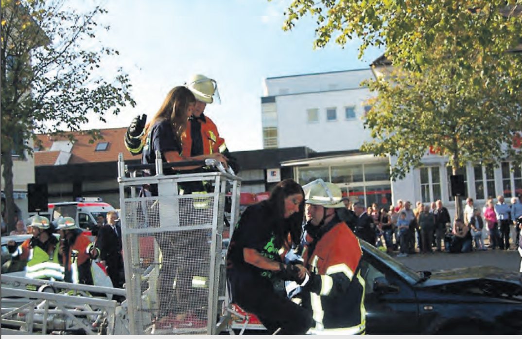
Ein LKW gerät vor einem Haus in Brand, eine Person im Fahrzeug eingeklemmt. Durch die Rauchentwicklung und das drohende Übergreifen der Flammen, flüchten die Bewohner auf die Balkone. Jetzt ist Eile geboten. Zum Glück ist dies nur eine Übung anlässlich der Hauptprobe bei der Freiwilligen Feuerwehr Gottmadingen am Samstag gewesen. Der Brand war bald gelöscht, die Menschenrettung mittels Drehleitern an der Gebäuderückseite erfolgt und auch die eingeklemmten Personen mittels hydraulischem Rettungsgerät befreit.