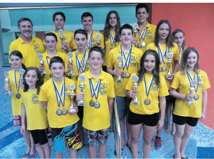
Einen fulminanten Saisonanstieg verzeichneten die Schwimm-Sport-Freunde (SSF) Singen in Ravensburg.