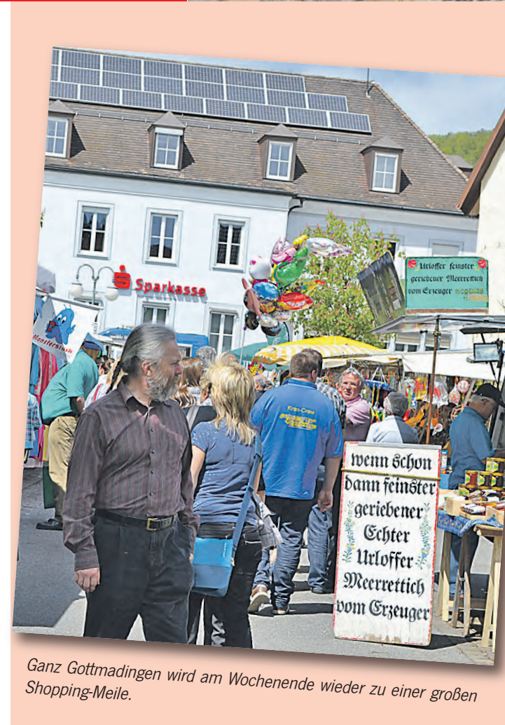
Ganz Gottmadingen wird am Wochenende wieder zu einer großen Shopping-Meile.