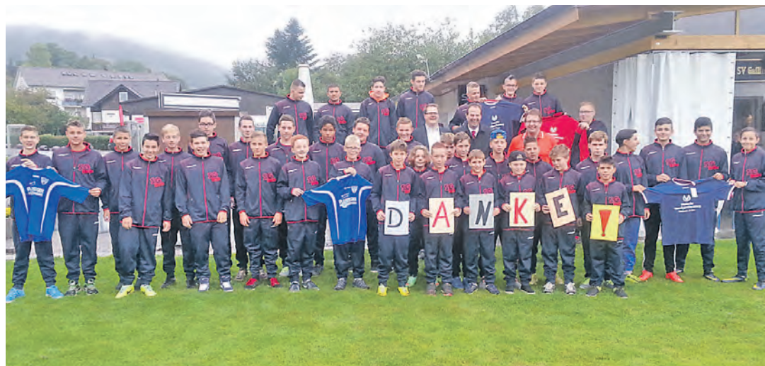
Die D-, C- und B-Jugend der Spielgemeinschaft SV Gailingen / VfB Randegg wurde zum Saisonstart mit neuen Outfits sowie Trikotsätzen ausgestattet. Somit wurde auch ein Zeichen für die gute Zusammenarbeit der beiden Vereine im Jugendbereich gesetzt. Ein herzliches Dankeschön geht an die Sponsoren: Kira Leuchten GmbH in Randegg, Sparkasse EnGo, DVAG Becker, Sport Müller, Continentale Messmer, Allianz Riegger, Gasthaus Hirschen Gailingen sowie die Randegger Ottilien Quelle.

»Ebringen«: Sa., 18.30 Uhr Eucharistiefeier am Vorabend, Segnung der Erntegaben.