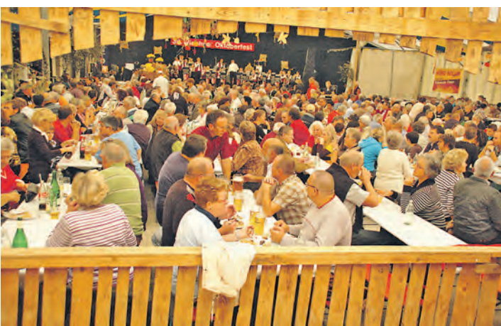
Beste Stimmung im Zelt garantiert das Wiechser Oktoberfest.

Auf unterhaltsame Weise regen die Vorführungen des Profi-Hackers dazu an, sich mit dem Thema »IT-Sicherheit« und dem eigenen Verhalten auseinanderzusetzen. Die kostenfreie Veranstaltung richtet sich an Unternehmer und Führungskräfte aus dem Hegau und beginnt um 19 Uhr im Feuerwehrhaus in Engen. Im Anschluss besteht die Gelegenheit, sich bei einem kleinen Umtrunk mit dem Referenten und anderen Teilnehmern auszutauschen. Aus organisatorischen Gründen ist eine Anmeldung bis 9. Oktober unter Telefon 07733/502212 oder formlos per E-Mail an PFreisleben@engen.de erforderlich.