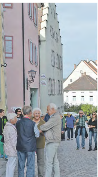
Die Engener Alt- und Vorstadt wurden beim »Oktoberle« zur Flaniermeile.