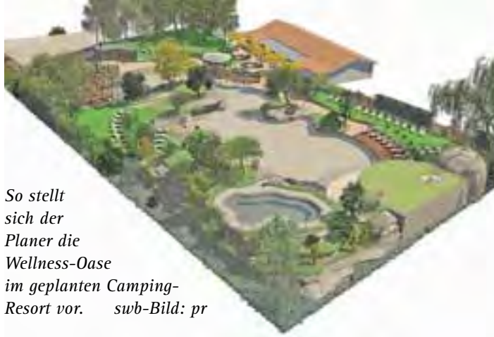
So stellt sich der Planer die Wellness-Oase im geplanten Camping-Resort vor.

Als Neuerung stellte er zusammen mit seinem Planer Martin Hoch eine Wellness-Oase vor, der auf der Fläche eines bislang als Biotop ausgewiesenen Bereichs entstehen solle. Dort sollen eine Saunalandschaft, Entspannungsbecken in einer Halle, ein Naturbecken unter freiem Himmel mit künstlichen Wasserfällen und Salzgrotte