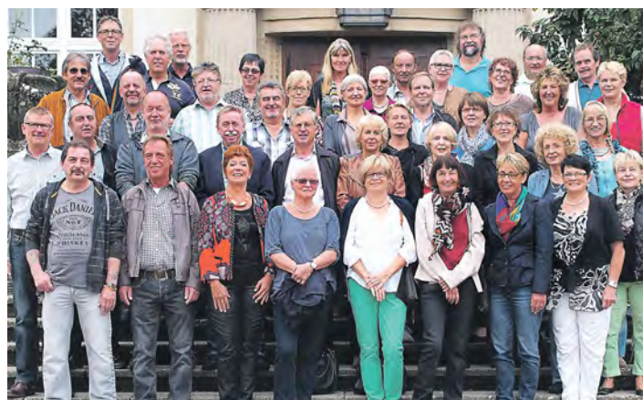
Viel zu erzählen hatten die ehemaligen Schüler der Hebel- und Eichendorffschule des Jahrgangs 1954 in Gottmadingen.

Gottmadingen (swb). Mit einem Apero-Frühstück im Kunststall in Gottmadingen, einem sonnigen Besuch der Insel Mainau und abschließendem Abendplausch im Hotel Sonne, mit feinem Büfett, feierten die ehemaligen Hebel- und Eichendorffschüler des Jahrganges 1954 aus den Gottmadinger »BERG-Gemeinden« ihr Wiedersehen zum 60. Jahrestag. »Wiä heisch du etz au nomol wider?«, war die oft gestellte Frage, zumindest während des Sektempfangs.