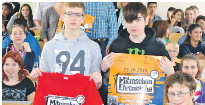
Schüler der Werkrealschule Engen freuen sich auf den »Mitmachtag« am 23. Oktober.