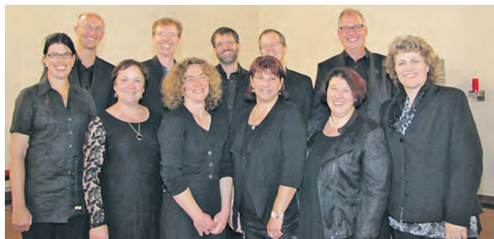
Das Hegau-Vokal-Ensemble tritt am Wochenende gleich zwei Mal für einen guten Zweck auf.