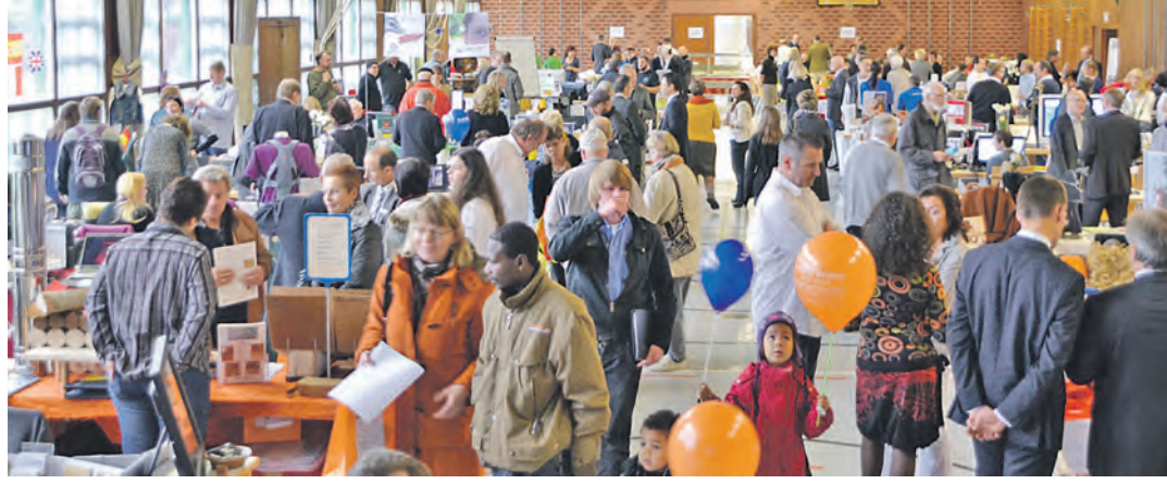
Zum ersten Mal findet die Tischmesse in der neuen Stadthalle statt. Sie wird alle zwei Jahre von der Stadt Engen und der Regionalen Wirtschaftsförderung Hegau e.V. veranstaltet.